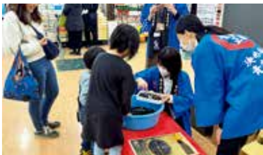
▲しじみすくい体験を行う来場者

同フェアには、小川原湖漁協の小川原湖産大和しじみが販売されたほか、アピタ鳴海店など3店舗では集客イベントとしてしじみすくい体験(子ども限定)も実施し、すくえたしじみが一定数以上の場合は冷凍しじみをプレゼントするなどして長蛇の列ができていました。