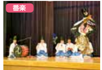
小川原神楽連中保存会