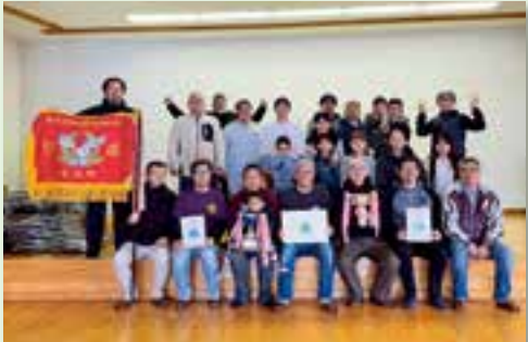
総合優勝した旭町