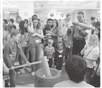
餅つきは結構大変です