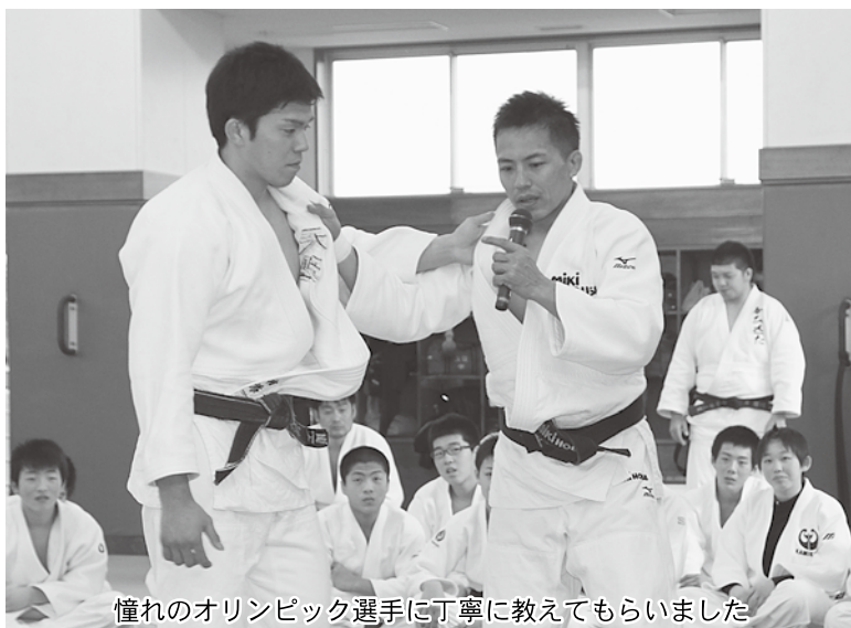
憧れのオリンピック選手に丁寧に教えてもらいました