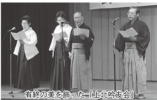
有終の美を飾った「上北吟友会」