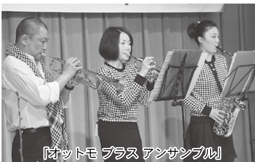
「オットモ ブラス アンサンブル」