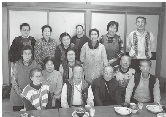
長生きの秘訣はバランスの取れた食生活

参加者は、和風オムライスやスイートポテトサラダなど、栄養のバランスがとれた5品目を調理。全員でおいしくいただいた後、栄養士から「今日からはじめる減塩作戦」と題した講演を受けました。