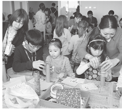
一緒に万華鏡を作りました