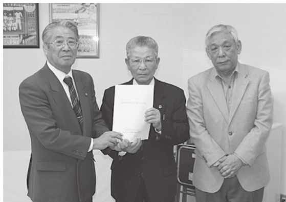
小学校統合に向けた意見書が提出されました

町教育委員会では、同委員会から提出された「上北地区は第一、上北、小川原小の3校を1校に、東北地区は蛸沢、千曳、水喰小の3校を1校に統合する」との意見書の内容を踏まえて議論していく方針です。