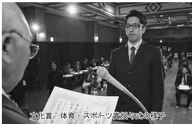
文化賞、体育・スポーツ賞授与式の様子