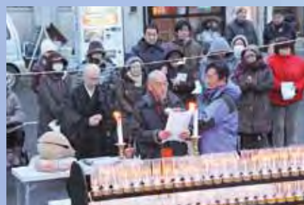
駅前広場で行われた追悼 供養の様子