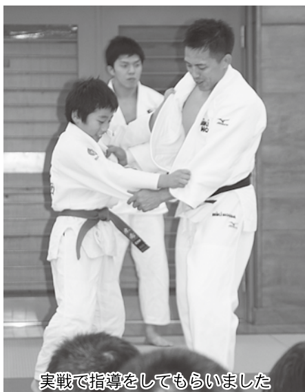
実戦で指導をしてもらいました