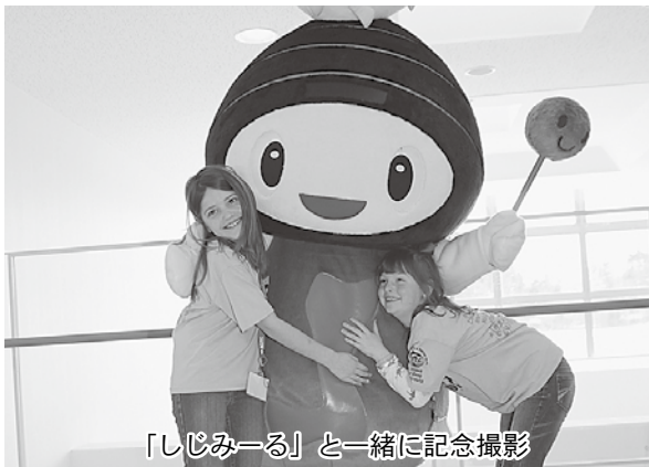
「しじみーる」と一緒に記念撮影

東北防衛局が主催する「日米交流ひな祭り in Tohoku Town」が2月28日、小川原湖交流センター「宝湖館」で開催され、参加した親子約100人がひな人形作りや手作り料理体験を通じて交流を図りました。