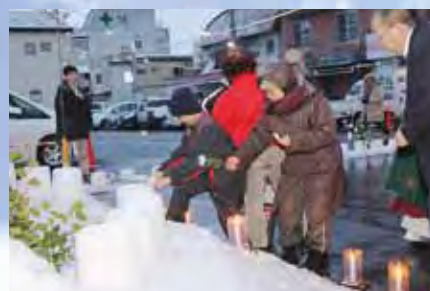
全員で花を手向け追悼 の意を表しました