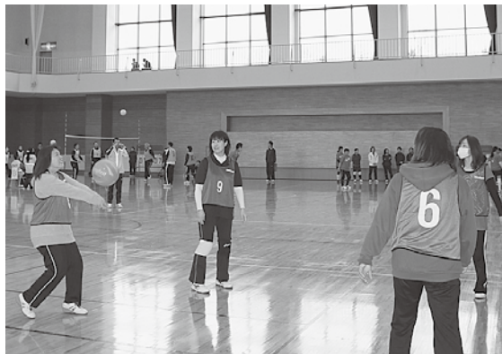
参加した選手たちが熱戦を繰り広げました

上位の結果は次のとおりです。■混合の部①ファンキーズ②カロリーゼロ③彩香園ブルースカイ ■女子の部①TJK②T.I.C③ぎりぎりガールズ