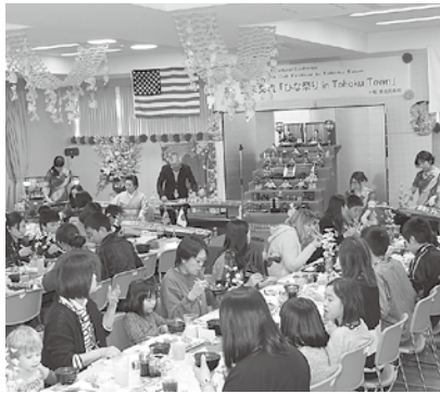
琴の演奏に心が和む昼食会