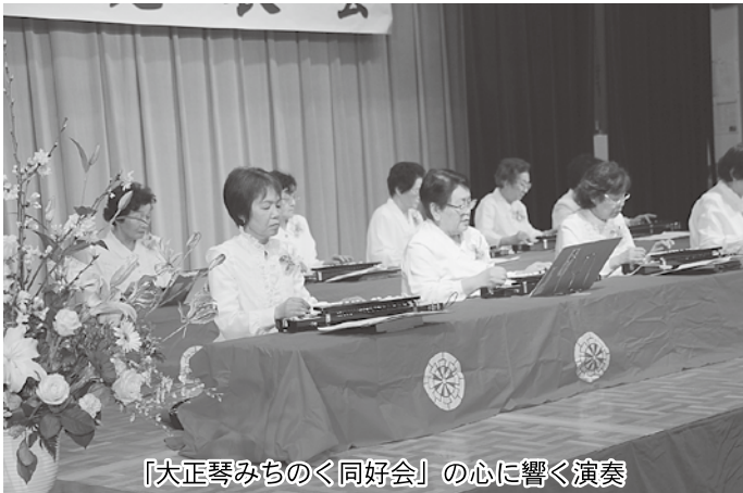
「大正琴みちのく同好会」の心に響く演奏

第6回文化協会芸能発表会が3月8日、町民文化センターで行われ、出演した15団体が、踊りや歌など、日ごろ練習してきた成果を堂々と披露しました。 来場者は、舞台で繰り広げられる多彩な演目に、惜しみない拍手と歓声を送っていました。