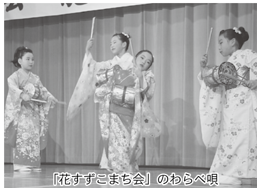
「花すずこまち会」のわらべ唄