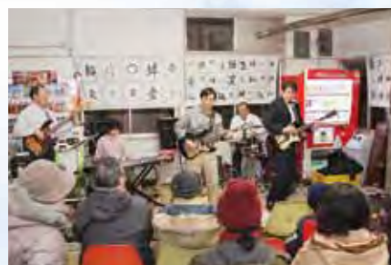
コンサートも開かれ、来 場者を楽しませました