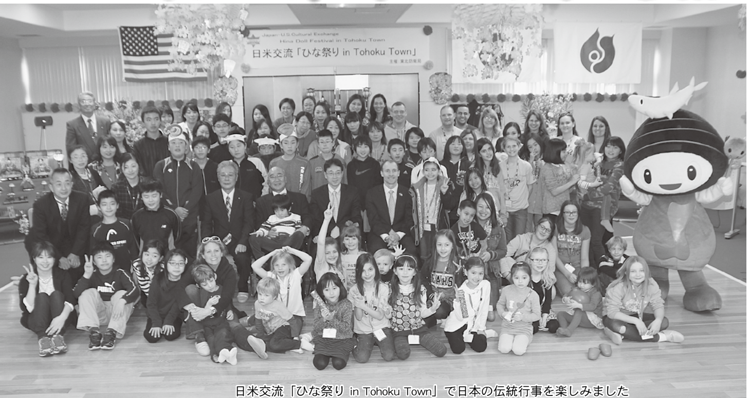
日米交流「ひな祭り in Tohoku Town」で日本の伝統行事を楽しみました