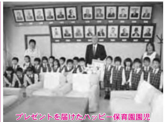
プレゼントを届けたハッピー保育園園児