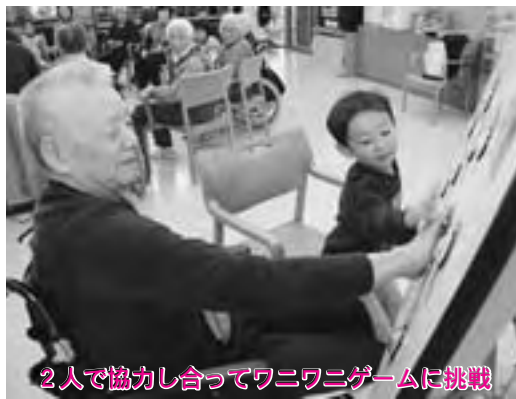
2人で協力し合ってワニワニゲームに挑戦