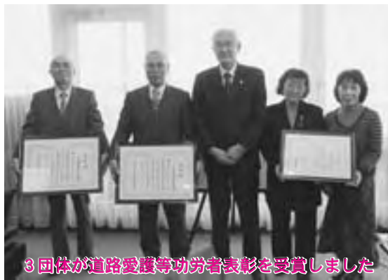
3団体が道路愛護等功労者表彰を受賞しました