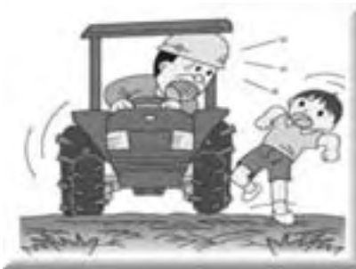
周りの安全を確認する

農作業をする際の服装や、農業機械の安全な利用方法などを再確認し、農作業事故ゼロを目指しましょう。