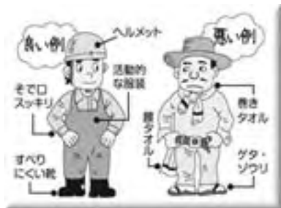
機械に巻き込まれない服装をする

◆問合せ－役場 農林水産課 (TEL 0176-56-3111、または TEL 0175-63-2111)