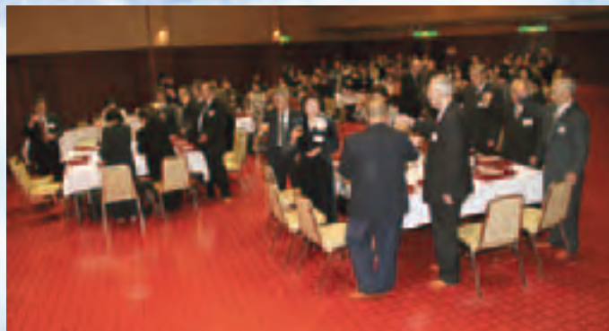
これからの充実した人生を祈って乾杯

式典後には祝賀会が行われ、参加者はこれまでの人生を振り返りながら、お互いのさらなる活躍を誓い合っていました。