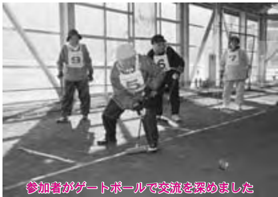
参加者がゲートボールで交流を深めました