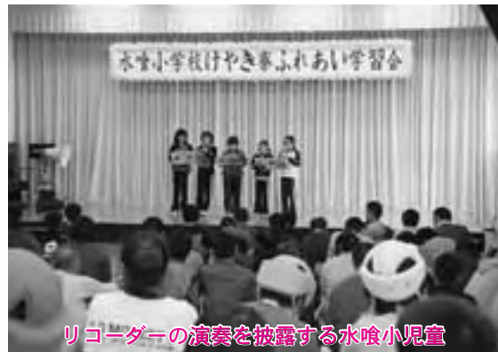
リコーダーの演奏を披露する水喰小児童