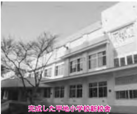
完成した甲地小学校新校舎

業、商工関係をはじめとする県内各産業に及んでおり、極めて厳しい経営を余儀なくされております。 わが町は、自然環境が豊かで、農業、漁業、酪農、温泉、観光等、各資源の魅力、地域力を持っております。 厳しい経済を踏まえ、それを活かすために、町独自で緊急経済対策を講じました。 (一) 農業、漁業、酪農等 約四千万円 (二) 商工関係 約九百万円 一 三月末までに支払う一地域の躍動と真の自立は、地域の知恵を結集した、地域の創意の中からこそ実現できると思っております。