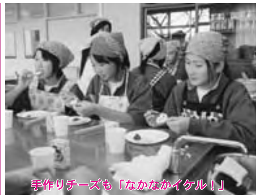
手作りチーズも「なかなかイケル！」