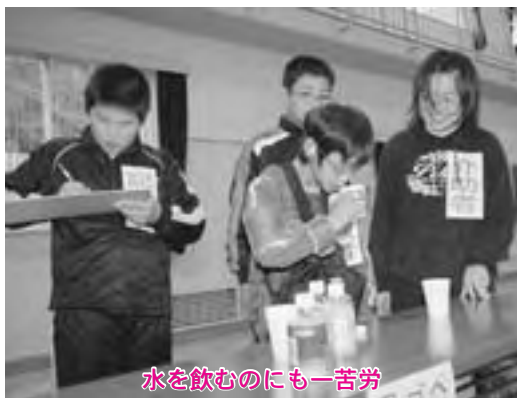
水を飲むのにも一苦勞

新聞を一枚ずつめくる、細かい字を読む、財布から小銭を出す、ペットボトルのキャップを開けて水を飲むなど、普段何気なくしている行動に悪戦苦闘した児童は、高齢者の大変さを身をもって感じたとともに、高齢者や体の不自由な人に対して何ができるのかを感じ取っていました。