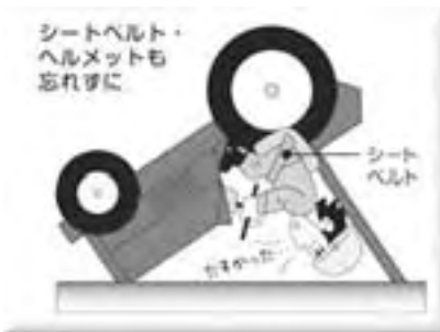
安全フレーム・キャブを装着する