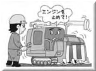
調整・点検、詰まりの除去の際は必ずエンジンを止める