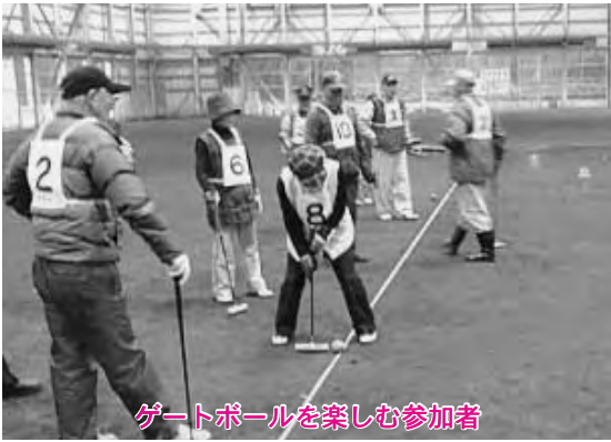
ゲートボールを楽しむ参加者

上位の結果は次のとおりです。 本町健老会 乙 供明老会 乙 供ことぶき会、栄町豊生会