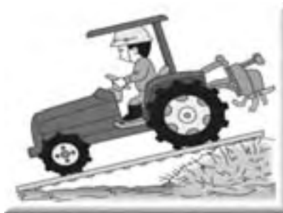
ほ場への出入りや畔越えは慎重に