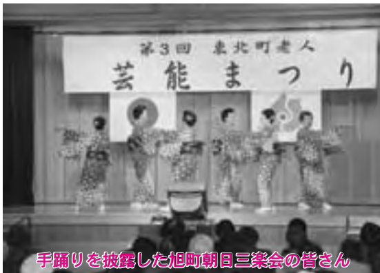
手踊りを披露した旭町朝日三楽会の皆さん

舞台では、華やかな衣装に身を包んだ出演者が、手踊りを踊ったり自慢ののどを披露したりするなど、さまざまな演目が繰り広げられ、会場に詰め掛けた大勢の観客は、大きな拍手と声援を送っていました。