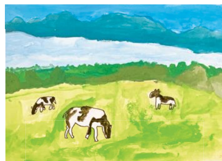
かわらない東北町