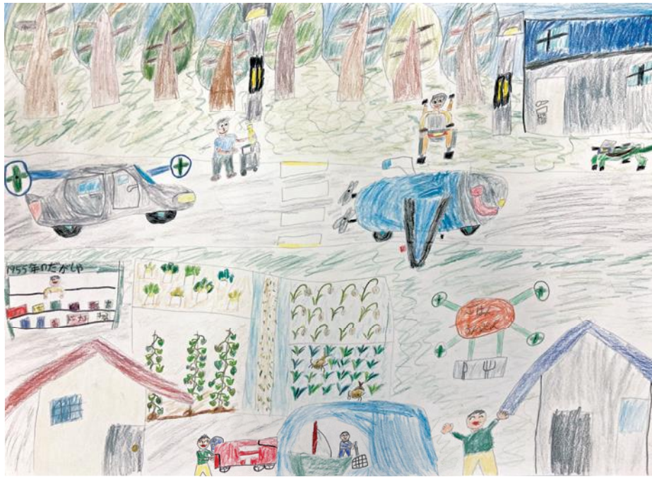
ぼくの未来予想絵