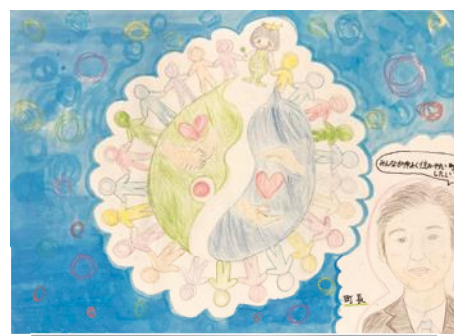
笑顔いっぱい、みんなで助け合うまち作り