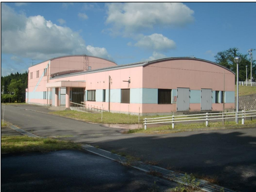
写真：東北町浄化センター