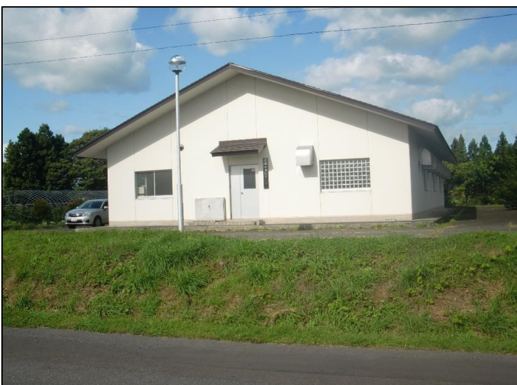
写真：千曳地区農業集落排水処理施設