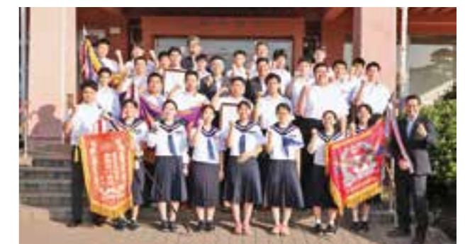
▲報告に訪れた選手たち