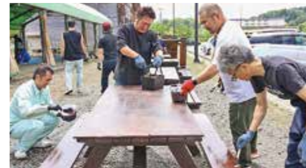
▲ペンキを塗る旭町青年部ら

旭町青年部が6月25日、利用者が心地良く使えるようにと、ボランティア活動の一環でレークハウスのバーベキュー用テーブルと椅子にペンキ塗りをしました。