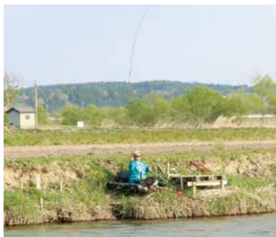
へらブナ釣りを楽しむ参加者