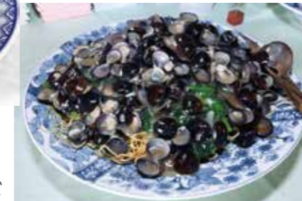
▶小川原湖産しじみと東北牧場青菜の餡かけ焼きそば