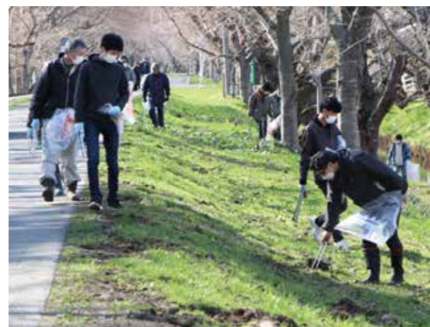
清掃活動に励んだ参加者

桜まつり会場は、22日に桜の見頃を迎え、天候に恵まれた24日には地元住民や観光客が、きれいになった桜のロードを散策し、桜に目を楽しませていました。