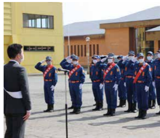
長久保町長の訓示を受けた消防団員