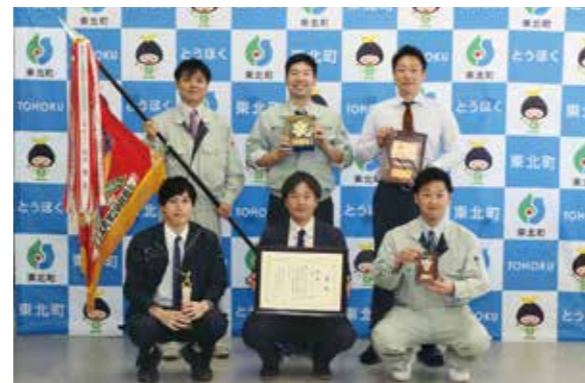
上北地区優勝 上北ソルマック