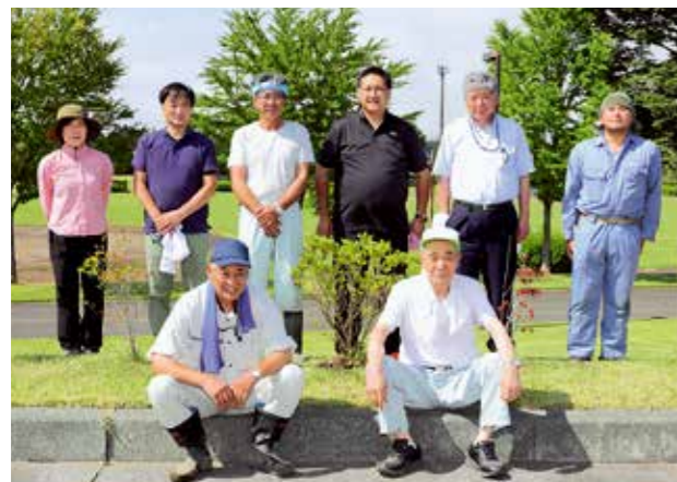
植樹に汗を流した佐藤住建スクラム会の参加者