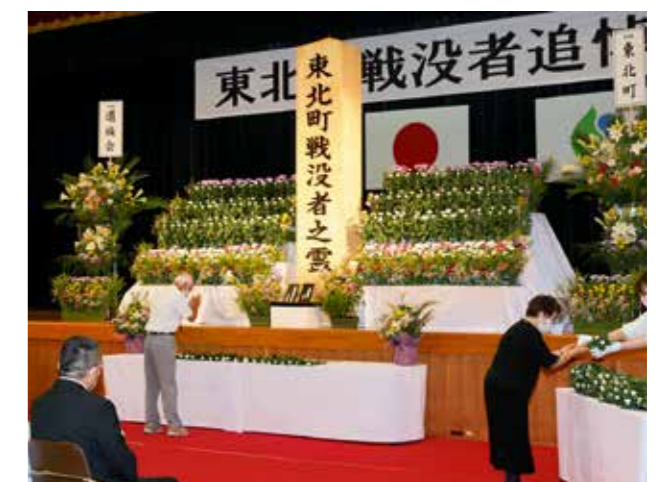
450余名の戦没者へ献花する遺族

献花では、大正琴みちのく同好会の演奏が流れるなか、遺族が白い菊を献花台に捧げました。