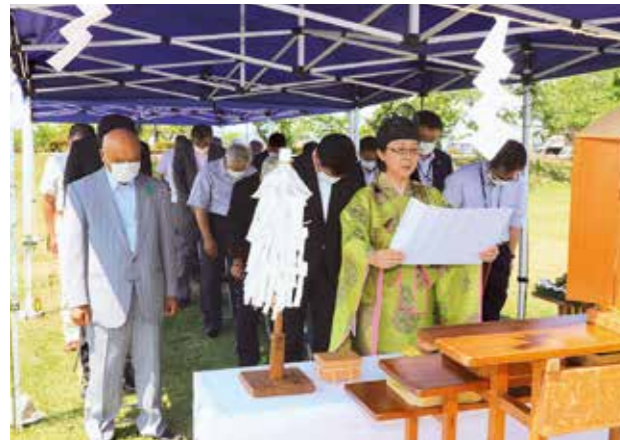
小川原湖の安全を祈った町の関係者

例年、湖水まつり期間に執り行いますが、新型コロナウイルス感染拡大の影響で、昨年に続いて、安全祈願修祓式のみを実施しました。