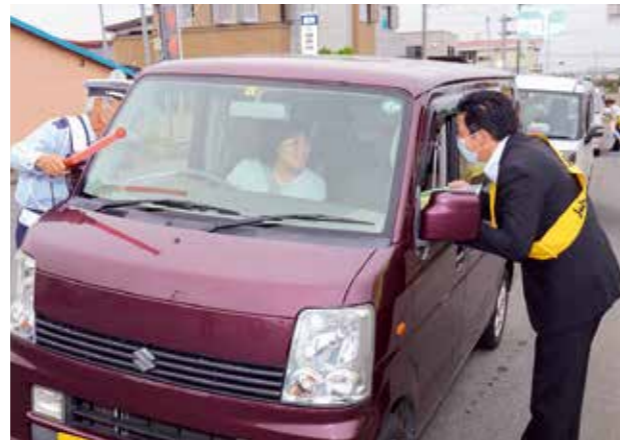
旭町地区で街頭活動を実施した関係者

『夏の交通安全県民運動』に合わせ、町は7月29日、七戸警察署員、交通安全協会、交通安全母の会および交通指導隊とともに、旭町運動場と東北消防署前で歩行者の安全確保や飲酒・暴走運転等の根絶に向けた街頭活動、飲食店へのポスター作戦を実施しました。