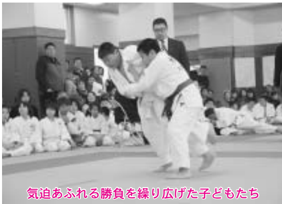
気迫あふれる勝負を繰り広げた子どもたち