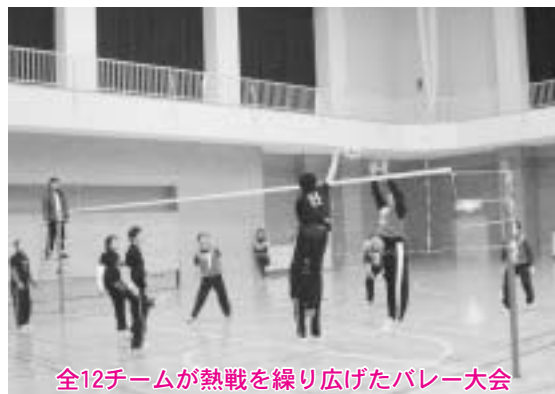
全12チームが熱戦を繰り広げたバレー大会