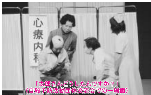
「太郎さんどうしたんですか?」 (自殺予防活動団体交流会での一場面)

その活動が認められ、このたび初の県外進出となりました。盛岡市で開催された「第5回自殺予防活動団体地域交流会」への出演です。いつもと違う、ガラス張りの近代的なビルの中での上演に、なんとなく戸惑った女優の皆さんでしたが、そこは光る女優魂!みごと演じきったのでした(全国規模の交流会なので、わが町なまりのおかしさや暖かさが伝わったか不安でしたけど...).