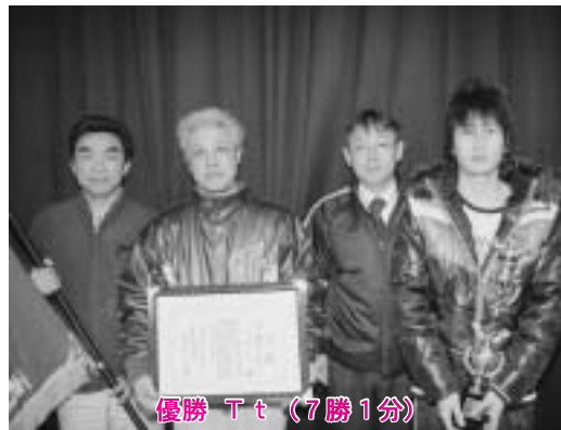
優勝 T t （7勝1分）