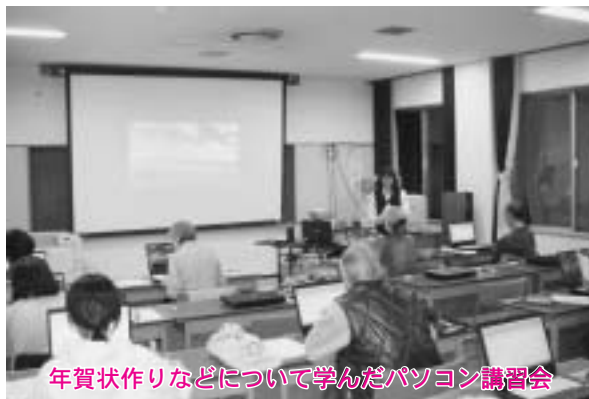
年賀状作りなどについて学んだパソコン講習会