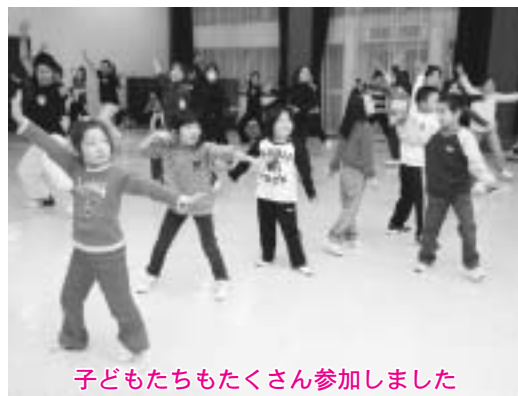
子どもたちもたくさん参加しました