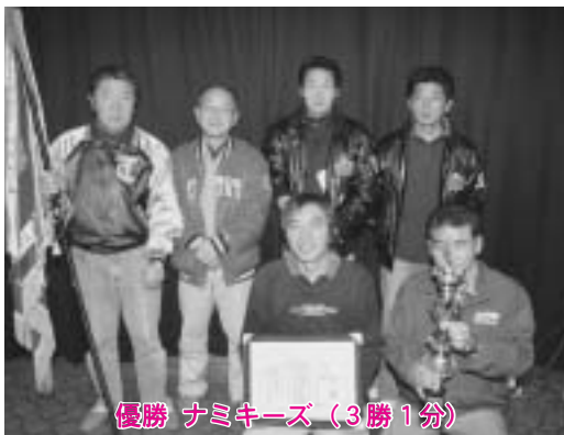
優勝 ナミキーズ（3勝1分）