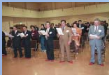
参加者全員で町民憲章の 唱和