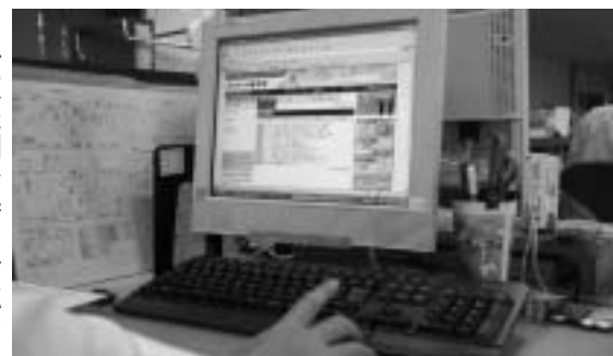
町内全域で高速インターネットサービスが利用可能に

タル放送開始時に対応できるよう、平成23年3月31日までに整備することとしております。