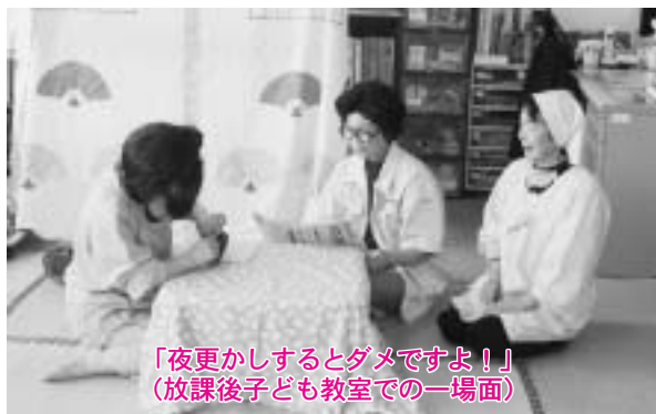
「夜更かしするとダメですよ!」 (放課後子ども教室での一場面)

なにせ、女優は女優でも、小道具等は全て自前なものですから、家にあるものを持ち寄ったり、布を切ってミシンをかけたたり...と、準備だけでも大忙しなのです。