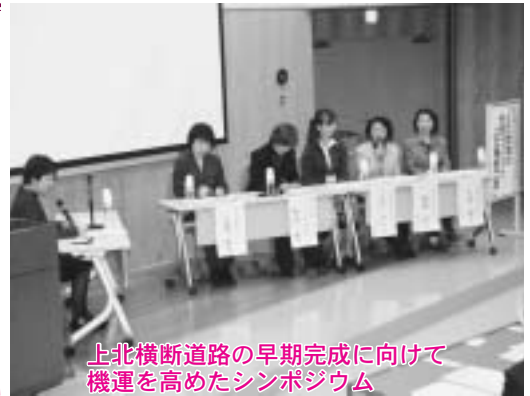
上北横断道路の早期完成に向けて機運を高めたシンポジウム