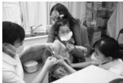
12月14日から始まった新型インフルエンザワクチンの集団接種

内容は、2回の接種費用6150円のうち、3000円を町が補助することとしました。さらに、生活保護世帯、町民