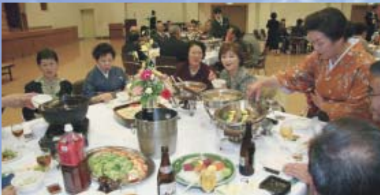
祝賀会では料理を囲んで楽しいひととき

式典後には祝賀会が行われ、参加者は久しぶりに会った仲間と会話を弾ませながら、今後の人生のさらなる活躍を誓い合っていました。