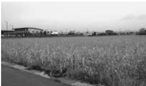
「(仮称) 小川原湖交流センター」の建設予定地。 左の建物は道の駅おがわら湖