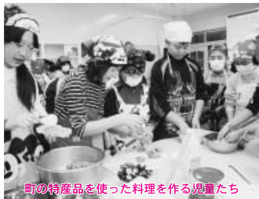
町の特産品を使った料理を作る児童たち