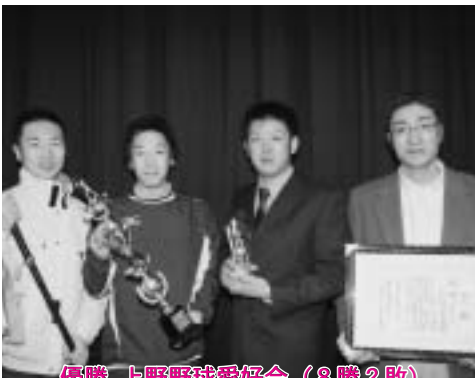
優勝 上野野球愛好会 (8勝2敗)