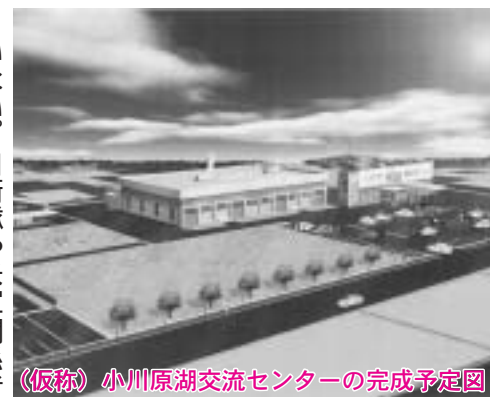
〔仮称〕小川原湖交流センターの完成予定図

いない。自衛隊や米軍関係者および一般客など、町内外の方との交流の場としても活用したい。