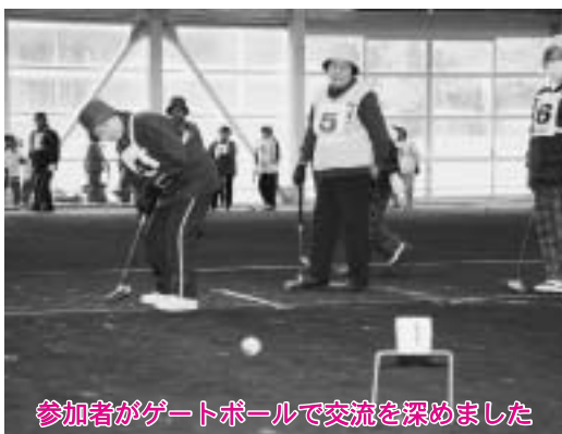
参加者がゲートボールで交流を深めました