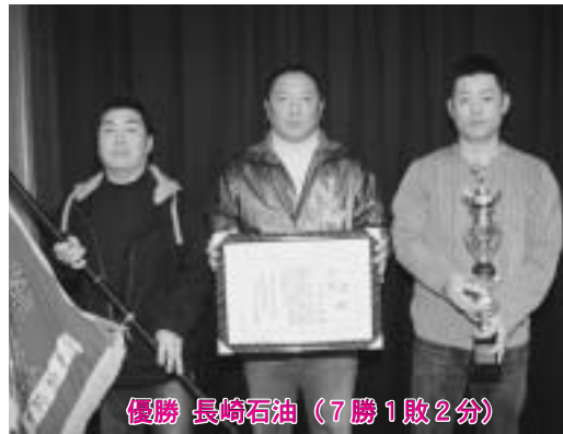
優勝 長崎石油 (7勝1敗2分)

極上 (7勝2敗1分) 虎兎 (5勝4敗1分) 蛭沢燃料店 クエスチョン 乙供ファイターズ