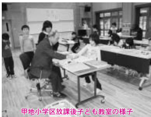
甲地小学区放課後子ども教室の様子