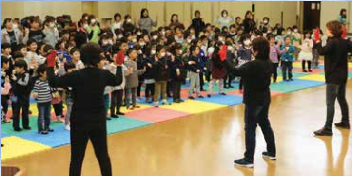
みんな大好きエビカニクスで「エビ！カニ！」

続いて、記念品の贈呈や全園児による「誓いのことば」の宣誓後、「一年生になったら」を合唱しました。