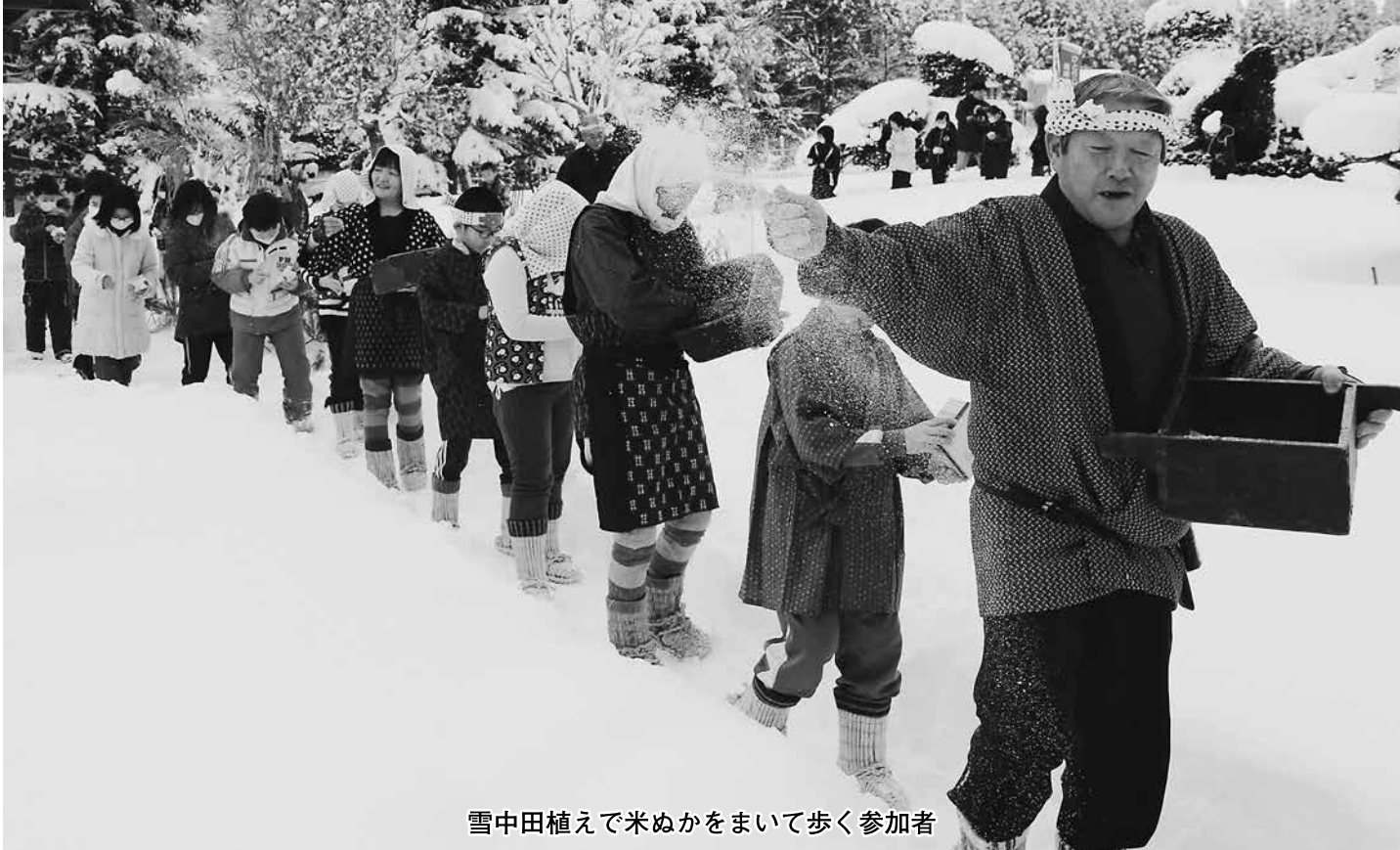
雪中田植えで米ぬかをまいて歩く参加者