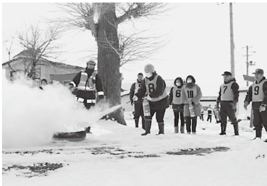
消火器の使い方を学ぶ地区住民