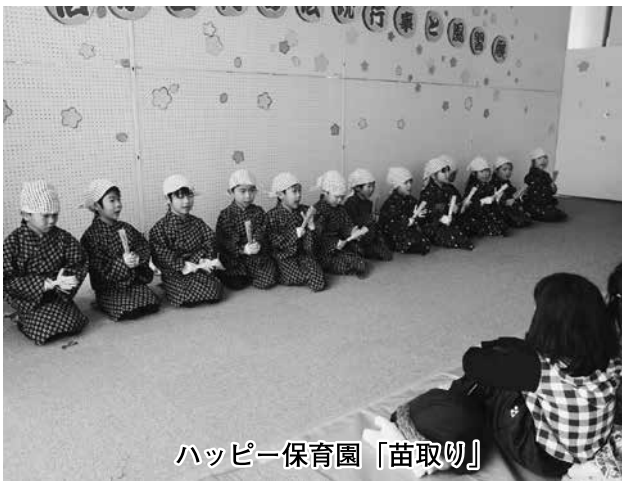
ハッピー保育園「苗取り」

で、昔の服装や田植えをすることができたとし、なにより3年生みんなが参加したので、とても楽しかったです。