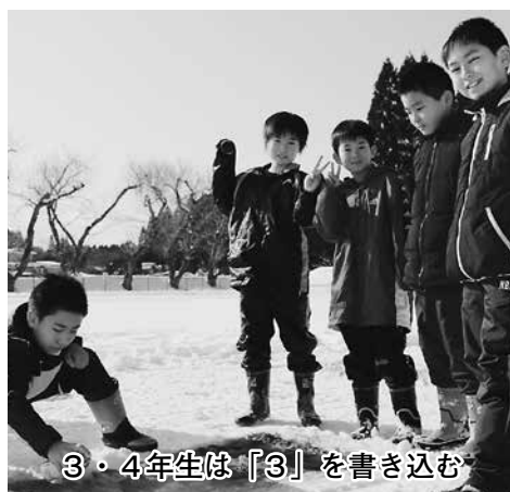
3・4年生は「3」を書き込む