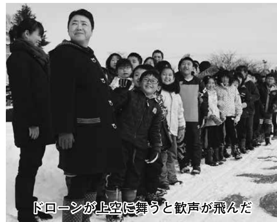
ドローンが上空に舞うと歓声が飛んだ

撮影は町内の山美建設と彦建設でつくる小川原湖地区安全衛生連絡協議会が、児童たちへ3月末で閉校する学びやとの思い出づくりにと企画しました。