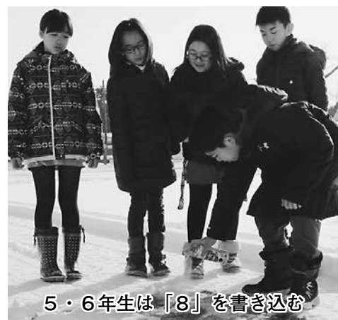
5・6年生は「8」を書き込む