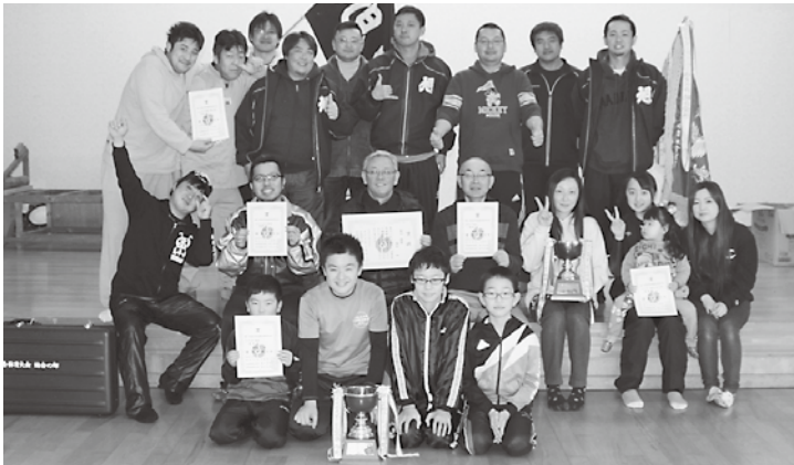
総合優勝した旭町チームのメンバー