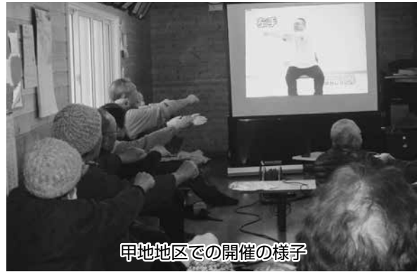
甲地地区での開催の様子

「生き生き100歳体操」に興味のある方、町内会や近所の人同士、友人同士で開催したいという方は、地域包括支援センターで開催に向けてのお手伝いをしますので、ご連絡ください。