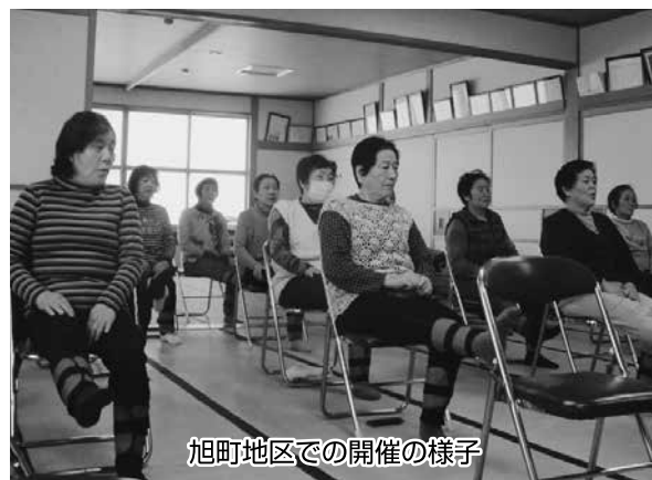
旭町地区での開催の様子

このような活動をしたいと、旭町地区と甲地地区は今年の1月から「生き生き100歳体操」を始めました。春になると農作業が忙しくなるため、開催はどうなるかわからないと話していますが、冬だけでも開催予定です。