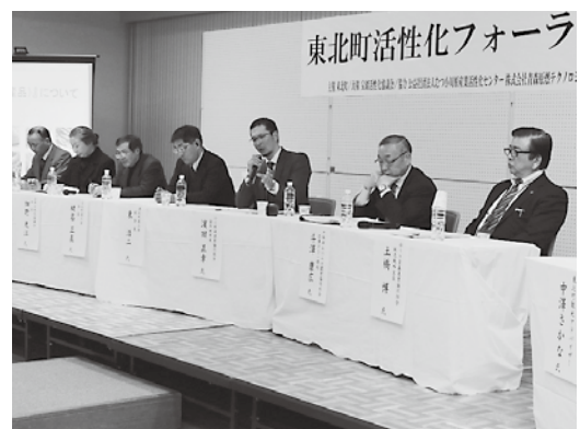
自身の団体の取り組みを発表する参加者