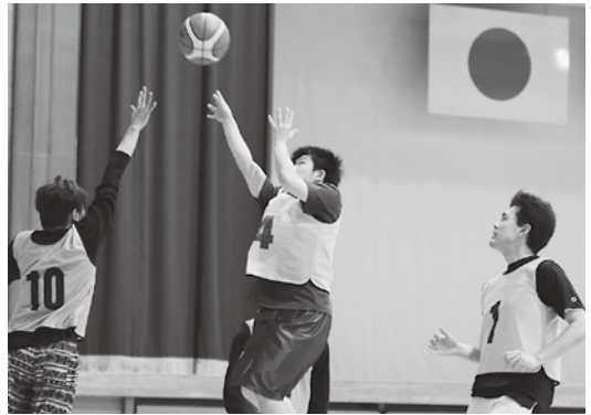
白熱した試合を繰り広げたバスケットボール

大会は9月に行われた秋季大会と今大会の種目別合計得点で争われ、旭町が3種目で優勝するなど、他競技においても安定した成績で見事総合優勝を果たしました。