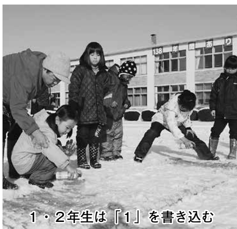
1・2年生は「1」を書き込む