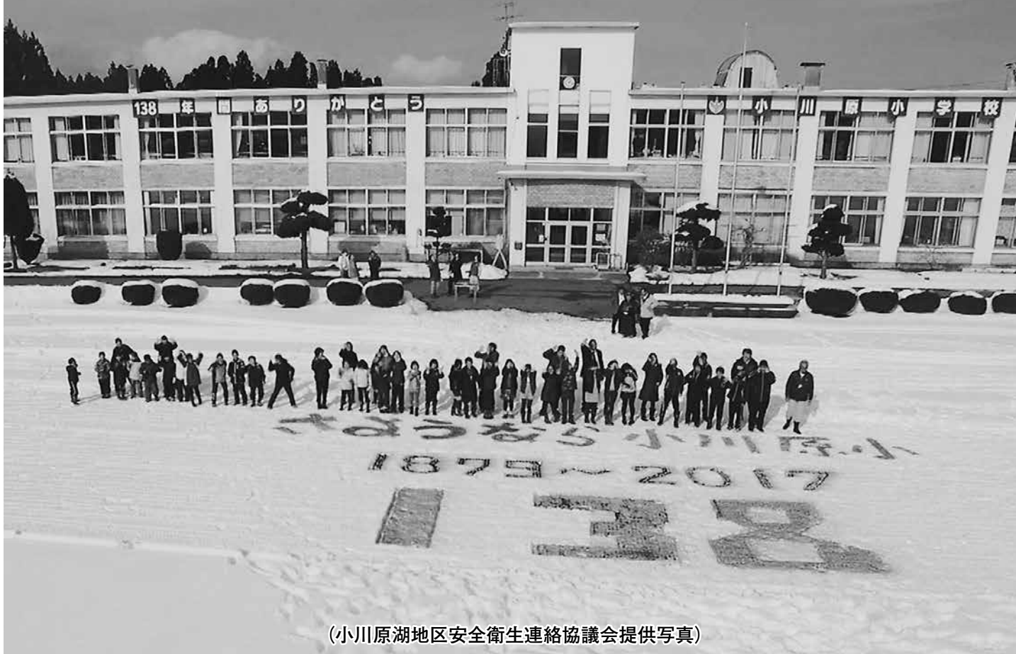
(小川原湖地区安全衛生連絡協議会提供写真)