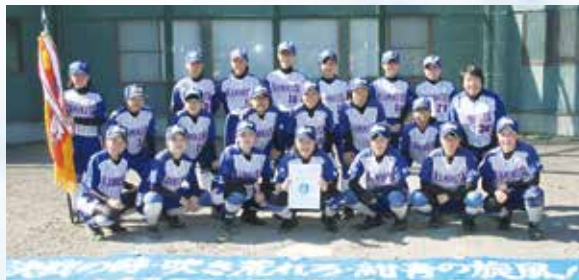
5連覇を果たした上北中ソフトボール部