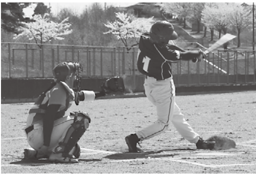
待ちに待った球春の到来