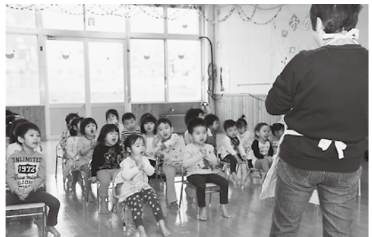
エプロンシアターの「おおきなかぶ」ではみんなで「ウントコショッ！ドッコイショッ！」