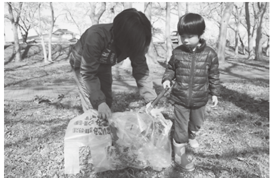
子供もたくさん参加してくれました

当日は天気も良く、小川原湖畔の千本桜も満開で、参加者は桜に魅了されながらも、清掃奉仕活動に精を出しました。