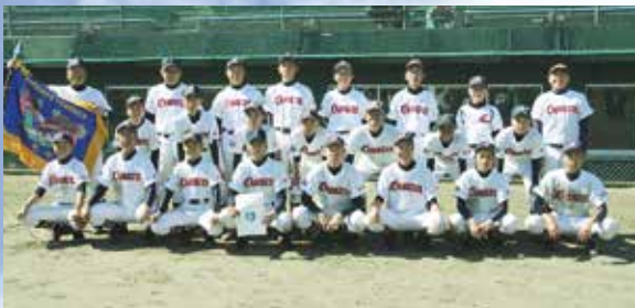
接戦を制し優勝した上北中野球部