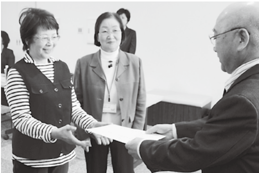
愛称は「食改（しょっかい）さん」