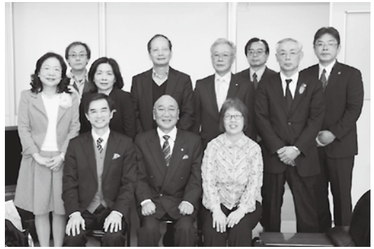
7月再見面吧！（7月にまた会いましょう！）

一行は7月に修学旅行で東北町を訪れる予定で、林名誉理事長は「今年の7月に訪問する台北市立天母國民中学と東北中学校、上北中学校との交流の絆が更に深まることを願います。」と述べました。