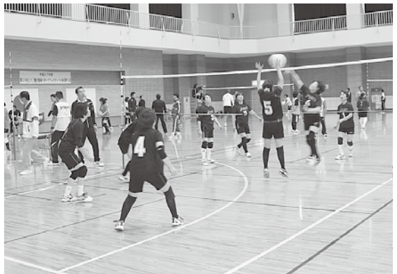
各チームが熱戦を繰り広げました

参加者らは、ソフトバレーボール、ラージボール卓球、グラウンドゴルフの3競技に分かれて、気軽に参加できるスポーツを通じて親睦を深めました。