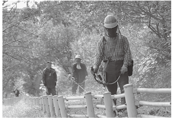
ボランティア活動に汗を流しました

同センターでは、10月21日を「シルバーの日」と定め、社会奉仕活動を実施し、地域社会にシルバー人材センター事業の社会的意義を宣伝・周知することを目的としており、参加者たちは2時間ほど、刈払い・清掃作業に汗を流しました。