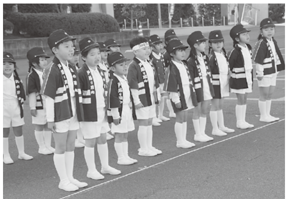
元気に防火の誓いをする園児たち

上北地区は、役場本庁舎前で防火式典を行いました。園児が「ぜったいに火遊びをしません」などと元気に防火の誓いをしました。