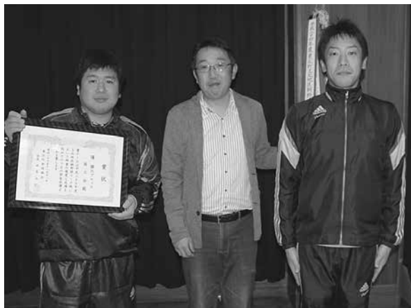
上北地区Bブロック優勝、商工会