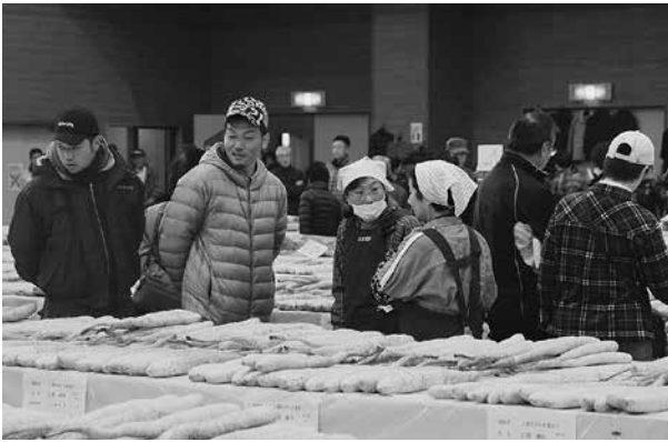
今年の「ながいも」どんだべなあ〜