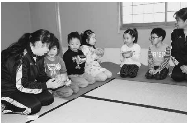
茶道体験でほっとひと息