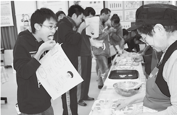
食生活改善試食実演コーナーではダシ活推進