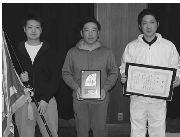
東北地区優勝、クエスチョン