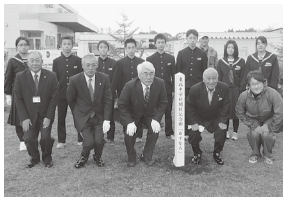
開校記念に「あすなろ」を植樹しました