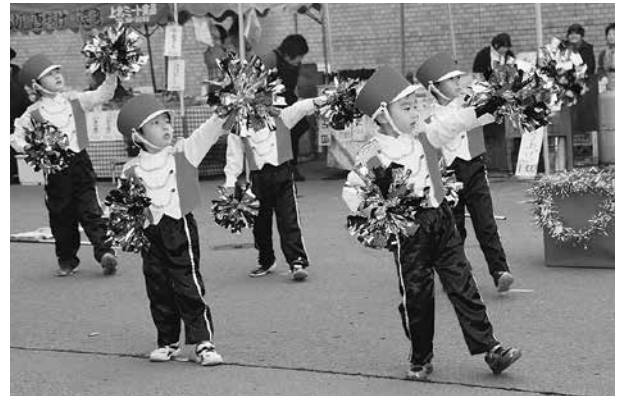
開会式では園児たちがお遊戯を披露