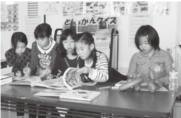
図書館クイズにみんなで挑戦!