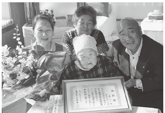
100歳の長寿をお祝いしました

贈呈式では斗賀町長が顕彰状などを贈ったほか、親族が花束やケーキなどを贈ってお祝いしました。