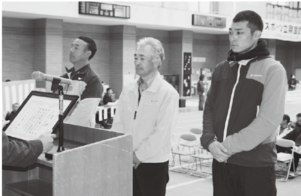
団体の部最優秀賞の乙部ながいも部会2