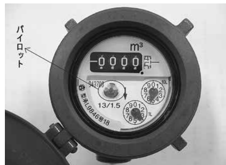
蛇口を閉めた状態で、図内のパイロットが回っている場合は漏水です