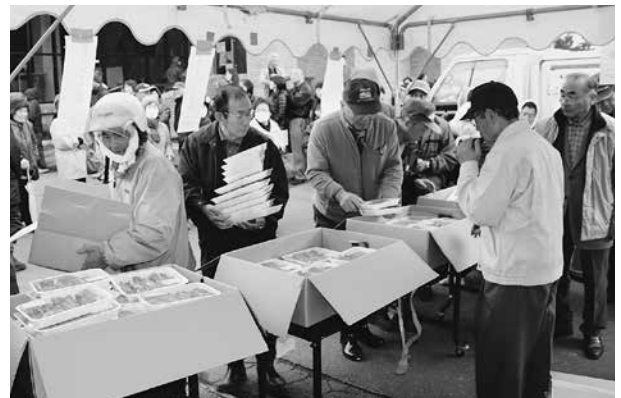
東北町産牛肉販売には長蛇の列ができました