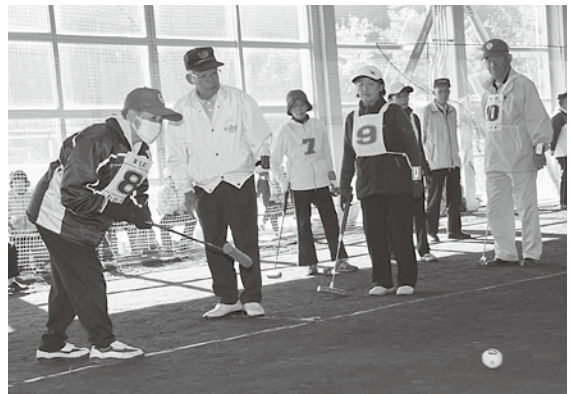
ゲートボールで親睦を深めました

上位の結果は①三木野クラブ（十和田市）②甲地モンキーズ（東北町）③乙供（東北町）