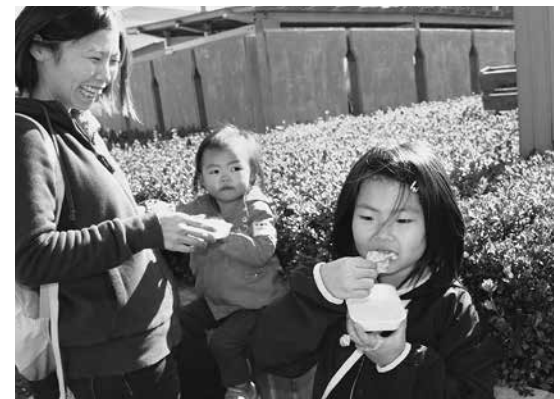
出来たてのお餅はウマウマです