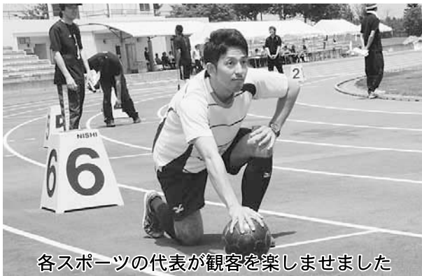
各スポーツの代表が観客を楽しませました