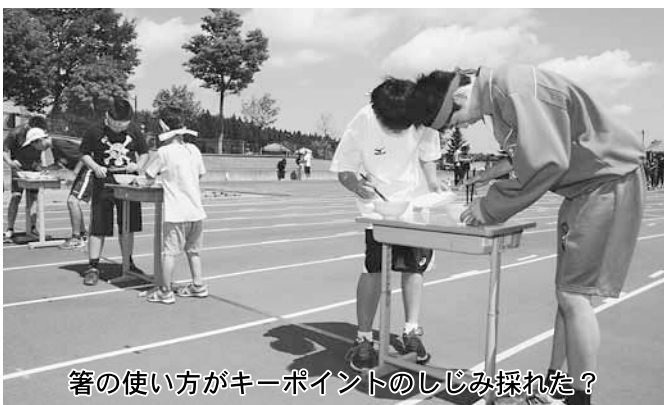
箸の使い方がキーポイントのしじみ採れた？

「いい汗・いい顔・明るい町づくり」を大会スローガンに、町制施行10周年記念、第10回町民大運動会が7月5日、北総合運動公園陸上競技場で開催されました。