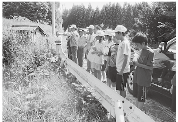
付近の危険箇所を実際に見て確認

これは、夏季に起こりがちな水場の事故や交通事故に注意して欲しいと行ったもので、この日は参加した30人が同管内のため池や河川を訪れ、過去の事例などを児童保護者と話し合い、安全確認を行いました。