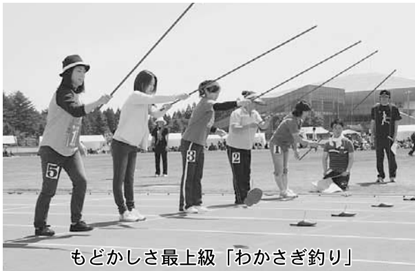
もどかしさ最上級「わかさぎ釣り」