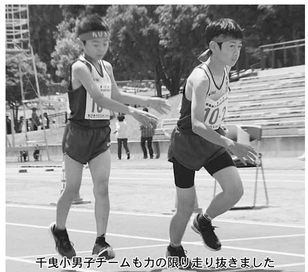
千曳小男子チームも力の限り走り抜きました