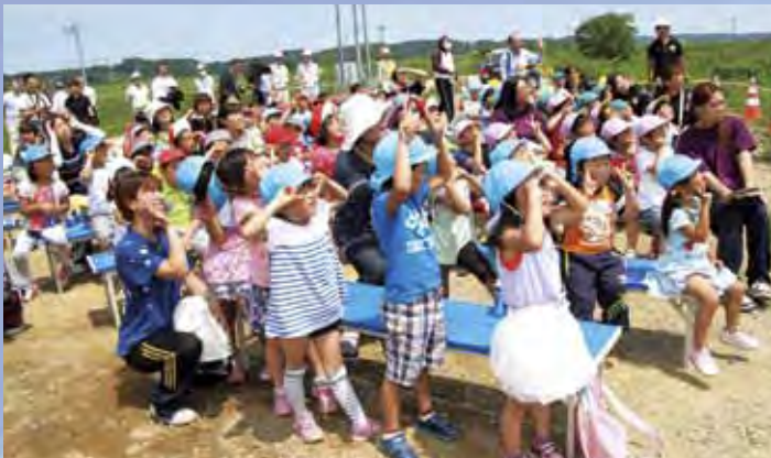
撮影をする「ドローン」にハイッ!チーズ

この見学会は、同営業所がCSR(企業の社会的責任)活動の 一環として行ったもので、町保育研究会が主導し、5月上旬から 町内13保育園をリレーして作成した「えがおのはな」と書かれ た横断幕が取り付けられた橋桁を架ける工程を見守りました。