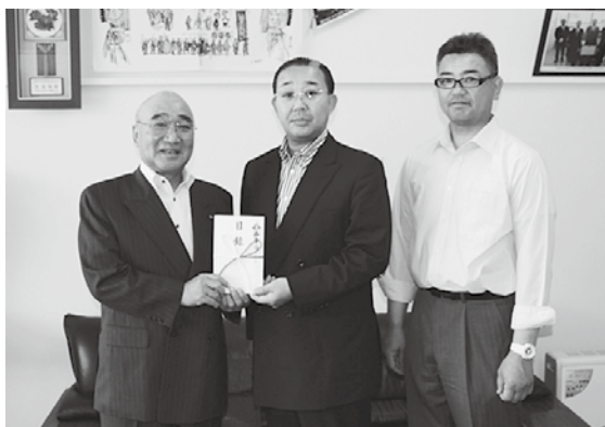
目録を手渡す南会長（中央）

目録を受け取った斗賀町長は「地域の安全のため、大切に使用させていただきます」とお礼を述べました。