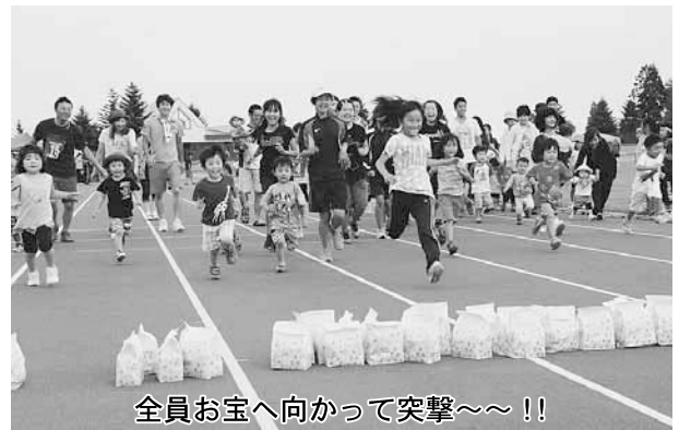
全員お宝へ向かって突撃〜!!