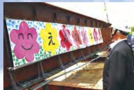
町内の年長児が色を塗 り手形を付けた横断幕