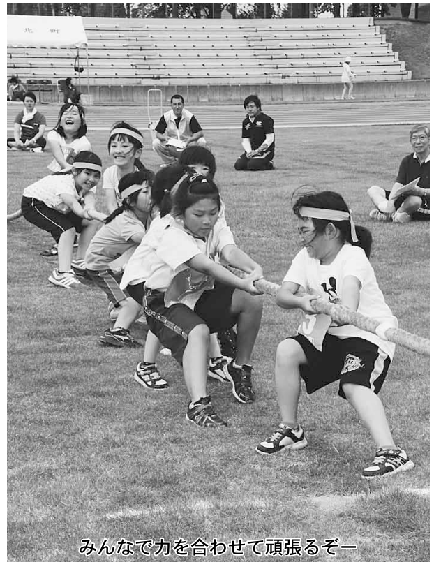
みんなで力を合わせて頑張るぞー