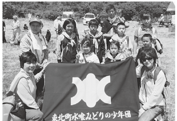
ブナとミズナラ2,200本を植樹しました

同プロジェクトは、国有林だった放牧場を以前の姿に戻し、次の世代に豊かな自然を贈ることを目的に、特定非営利法人森の里しちのへと中部上北広域事業組合の主催で行なわれ、家族連れや関係者など約150人が参加し、ブナとミズナラの幼木2200本を植樹しました。なお、小川原湖漁業協同組合からシジミ20 キ が提供されました。