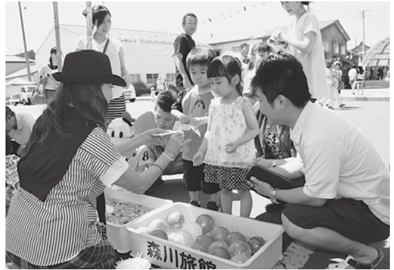
多くの家族連れなどでにぎわいました

12日には、人権擁護委員や上北小音楽部らが駅前イベント広場で開催式。縁日コーナーが設けられ、3on3バスケットボール大会などが行われたほか豪華賞品が当たるビンゴ大会が行われ、多くの家族連れなどでにぎわいました。