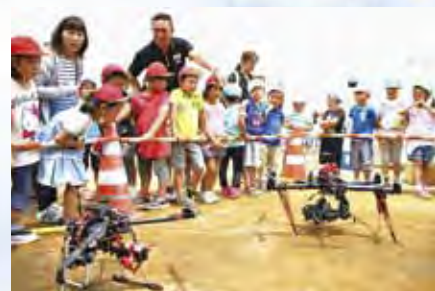
一連の作業を空撮した 「ドローン」を見学