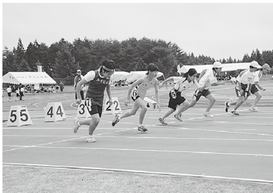
自己ベストの更新にチャレンジしました

大会には、町内7小学校の4年生以上の全児童約450人が参加。100m競走や200m競走、400mリレーなどのトラック競技5種目と、走り幅跳びとボール投げのフィールド競技2種目で、日ごろの練習の成果を発揮し、自己ベストの更新にチャレンジしました。