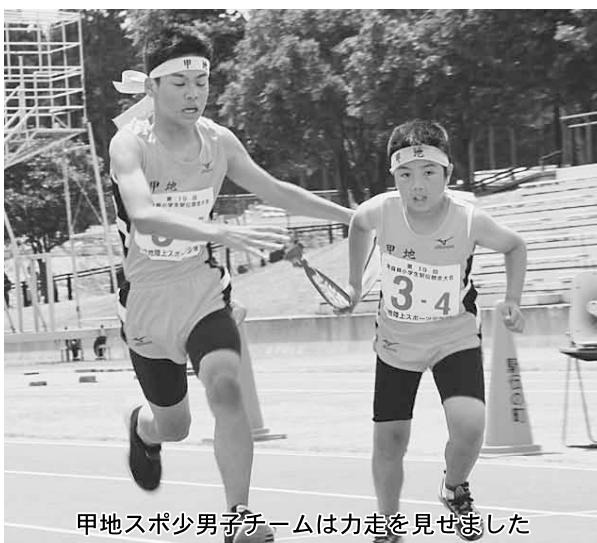
甲地スポ少男子チームは力走を見せました