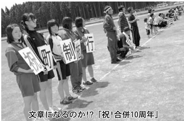
文章になるのか!?!「祝!合併10周年」