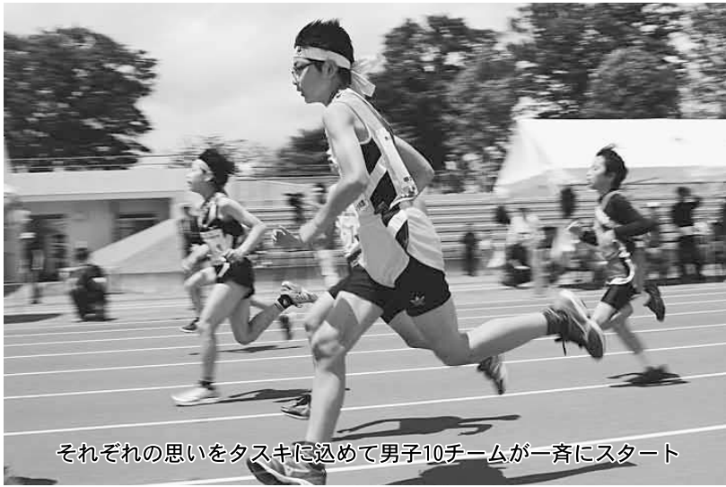
それぞれの思いをタスキに込めて男子10チームが一斉にスタート

第19回青森県小学生駅伝競走大会が6月13日、北総合運動公園で行われ、県内から参加した女子10チーム、男子10チームの選手が熱い思いを胸にタスキをつなぎました。