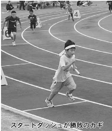
スタートダッシュが勝敗のカギ