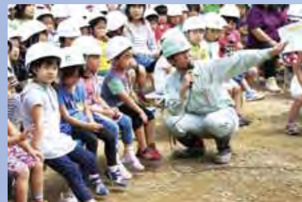
作業工程の説明を受け る園児たち