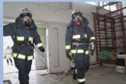
救助・救出訓練では屋内 検索を行いました