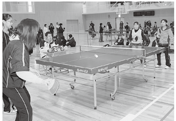
親子で卓球を楽しみました

競技は、親子ダブルスと小学3年生以上による学年ごとのシングルのほかチームの団体戦が行われ、出場した子供たちは保護者らの声援を背に熱戦を繰り広げていました。