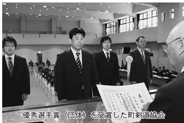
優秀選手賞（団体）を受賞した町剣道協会