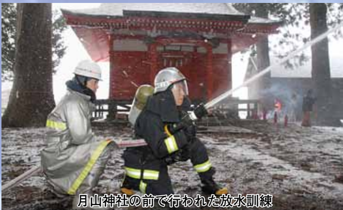
月山神社の前で行われた放水訓練

文化財防火デーに合わせて行われたこの訓練は、貴重な文化財を保存している建物で火災が発生したことを想定して実施。参加した町民らが消火器で初期消火を試みたり重要文化財に見立てた箱を屋外に運び出したりして、消火活動の手順を確認し合いました。