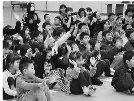
歌や音遊びを楽しみました