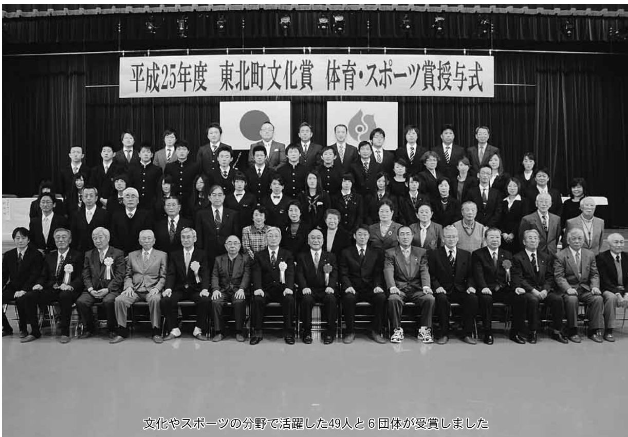
文化やスポーツの分野で活躍した49人と6団体が受賞しました