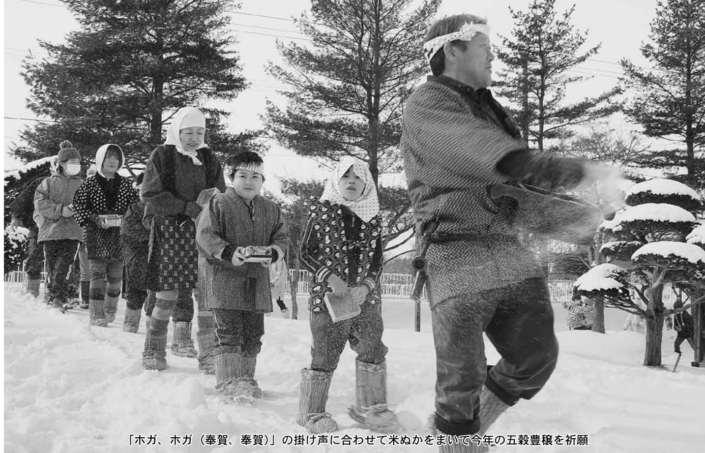
「ホガ、ホガ（奉賀、奉賀）」の掛け声に合わせて米ぬかをまいて今年の五穀豊穡を祈願