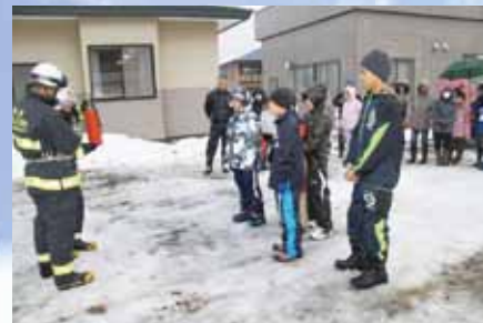
消火器の使い方方の説明を 受ける参加者