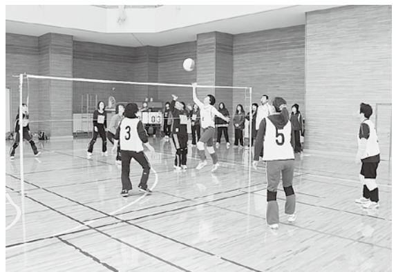
ソフトバレーで汗を流す参加者