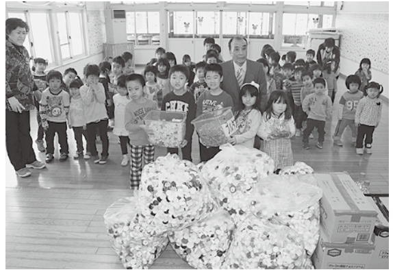
みんなで集めたプルタブとキャップです

同保育園で行われたセレモニーでは、園児たちと保護者らが協力して1年間集めた、プルタブ32.5kgとキャップ70.0kgを、園児たちが姥名会長へ手渡しました。