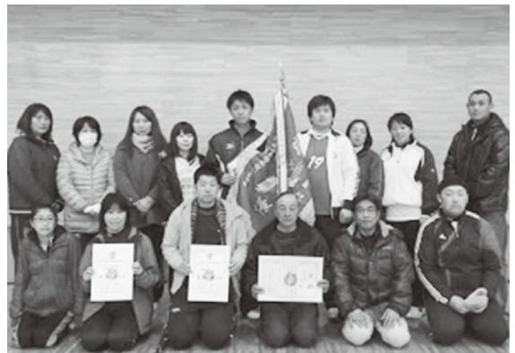
総合優勝を果たした上野チーム

なお、秋季大会との合計点数で争われる総合の部では、上野チームが初優勝を果たしました。