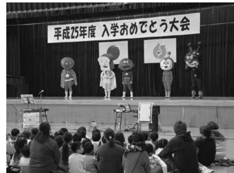
学校生活のお約束をしました