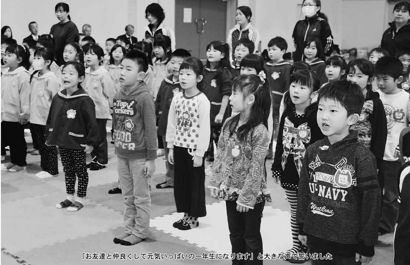
「お友達と仲良くして元気いっぱい的一年生になります」と大きな声で誓いました