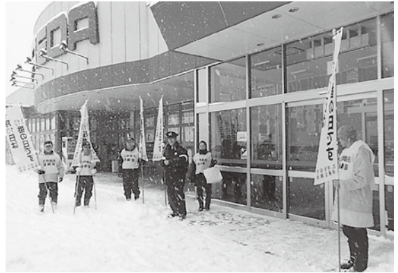
啓発活動を行う参加者

「110番の日」は110番の適切な使用を推進しようと、警察庁が定めた日で、当日行われた啓発活動には、同協議会員ら8人が参加。マエダストア乙供店に訪れた買い物客にチラシやティッシュなどを手渡し、110番の適切な使用を呼びかけました。