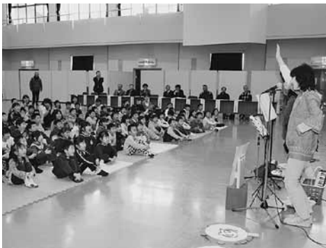
カカロと一緒に歌のお楽しみ会