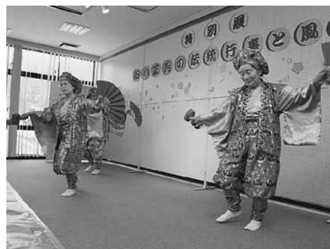
会場に福を呼び込む「大黒舞」