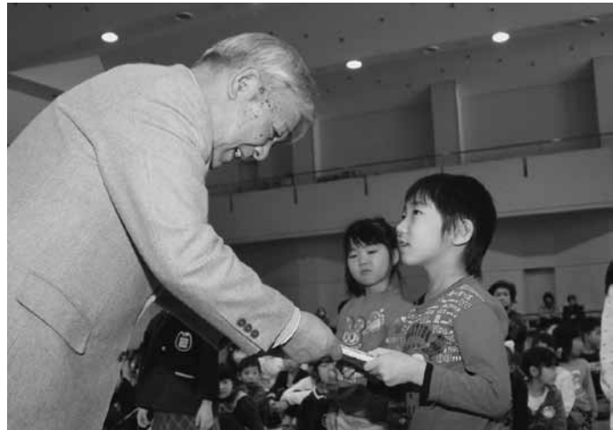
元気な声でお礼を言いました

入学おめでとう大会が1月27日、コミュニティセンター未来館で開かれ、春に新1年生になる子供たち139人が、学校生活への期待を膨らませました。大会では、子供たち全員で「お友達と仲良くして、元気いっばいの1年生になります」と誓い、「2年生になったら」を合唱しました。 続いて行われたお楽しみ会では、町保育研究会の会員によるアンパンマンとのお約束を元気良くしたほか、青森県あしゅまる隊認定・八戸市の子ども向けコンサートユニット「☆カカロ」と一緒に歌や音遊びを楽しみました。