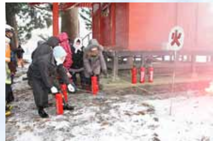
水消火器を使った初期消 火訓練も行われました