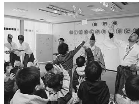
無病息災を願う「菓子まき」