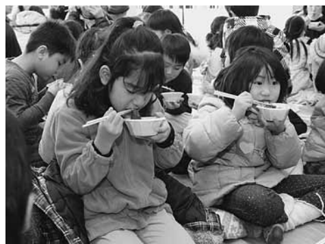
おいし〜い、おしること甘酒