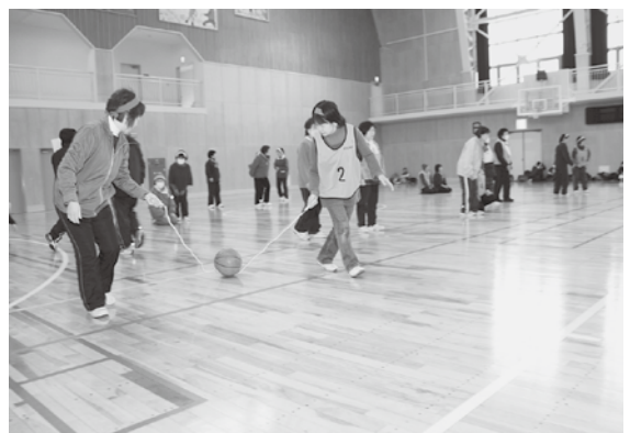
競技を楽しむ参加者

上位の結果は次のとおり。①新館・外蛭沢チーム②甲地チーム③乙供・本村・大浦チーム