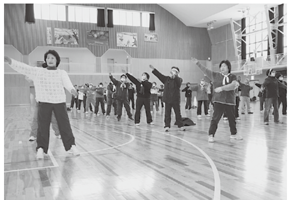
ラジオ体操で体をほぐします