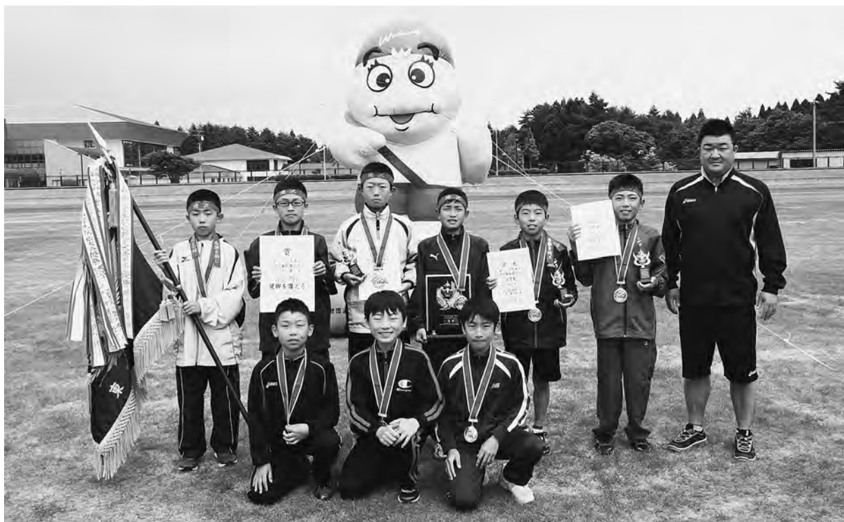
優勝旗を奪還し笑顔を見せる蛭沢小男子チーム