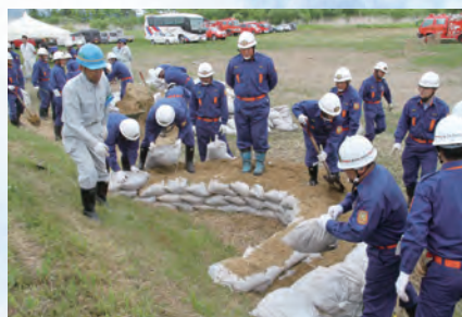
積み上げた土のうの間に土 を入れます