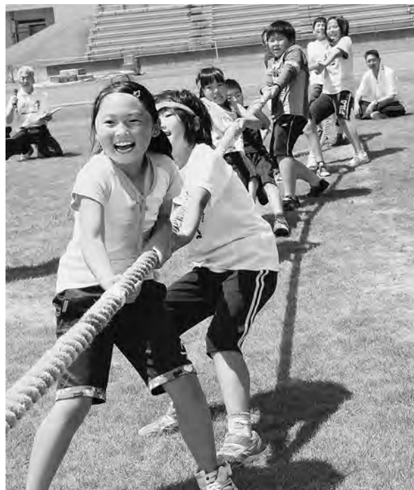
みんなで力を合わせてチームのために頑張るぞー