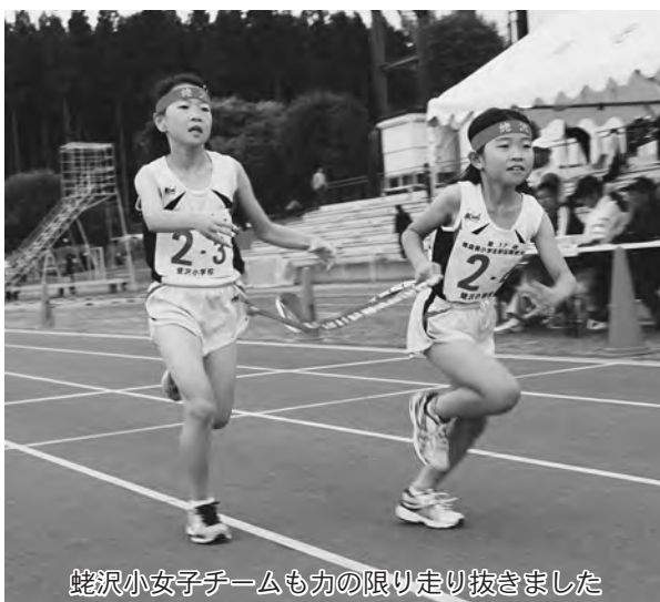
蛭沢小女子チームも力の限り走り抜きました