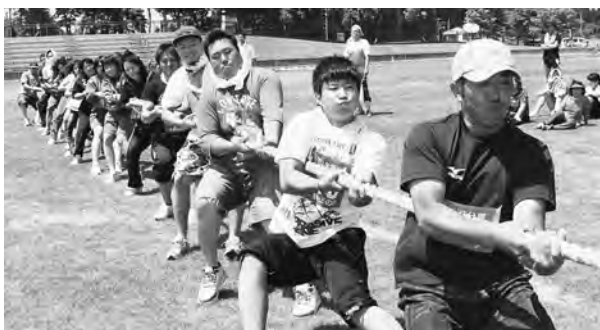
心を一つに勝利を引きよせろ