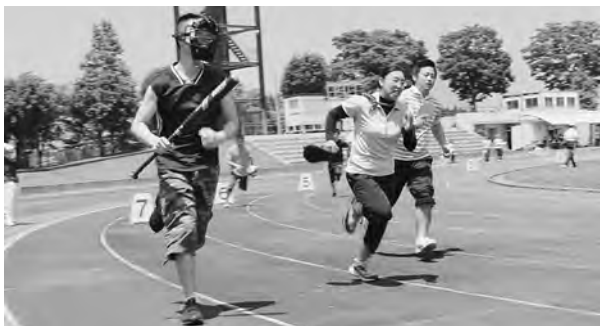
各スポーツの代表が観客を楽しませました