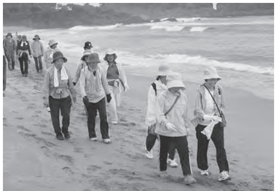
種差海岸の遊歩道を散策する参加者たち

参加者は、スタートの葦毛崎展望台からゴールの種差海岸キャンプまで、およそ5kmのコースを2時間ほどかけて散策。展望台から見える美しい景色や砂浜に打ち寄せる波の音を満喫していました。