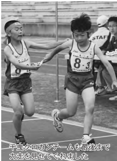
千巽タロカンチームも最後まで力走を見せてくれました

当町からは女子2チーム、男子3チームが参加。男子では蛭沢小チームが、最大36秒差を追い上げ逆転、みごと優勝旗を奪還し栄誉に輝きました。