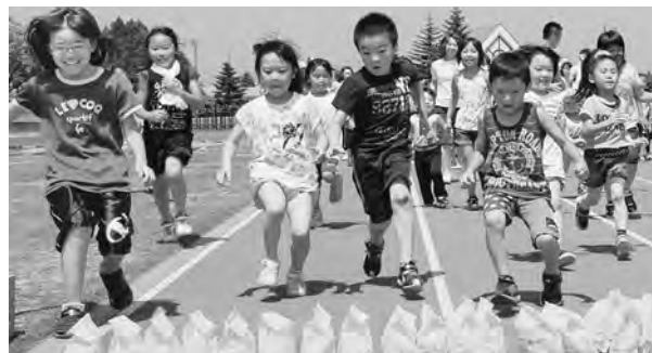
全員お宝へ向かって突撃〜〜!!