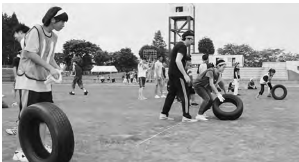
タイヤとの一体感が大事!?