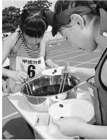
箸の使い方がキーポイント。しじみ採れた？