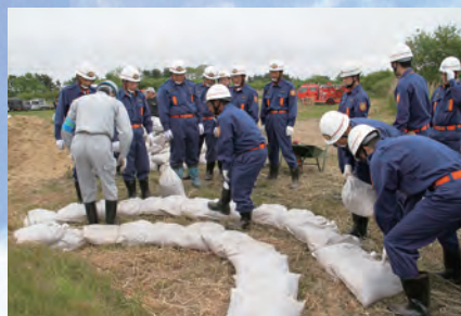
土のうを半円形の輪を描く 様に積み上げます