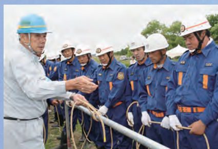
工法の基本となる ロープワーク

訓練には消防団員ら約70人が参加し、ロープワークの指導を経て、水防工法のひとつである「月の輪工」の説明を真剣な表情で聞き、住民の生命と財産を守る工法の訓練に汗を流しました。