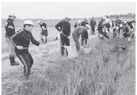
水辺にはどんな生物が住んでいるのかな？

児童たちは、水田に水を送る甲地揚排水機場を見学した後、水田の用水路で行なった簡易水質調査で水生生物がすみやすい水質か調査をしたり、生き物調査でタモアミを使いコオイムシやタナゴなどを見つけ、自然環境保全の大切さを学んでいました。