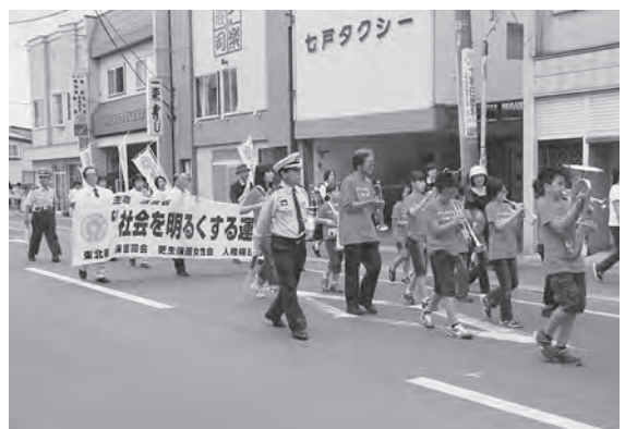
駅前通をパレードする参加者たち

4日には、豪華賞品が当たるビンゴ大会が行われ、多くの家族連れなどでにぎわいました。