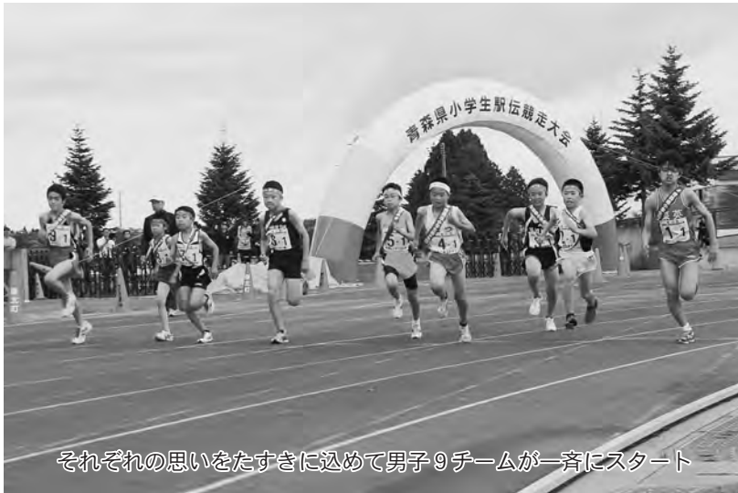
それぞれの思いをたすきに込めて男子9チームが一齐にスタート

第17回県小学生駅伝競走大会が6月22日、北総合運動公園で行われ、県内から参加した女子9チーム、男子8チームの選手が熱い思いを胸にたすきをつなぎました。