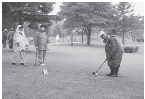
グラウンドゴルフを楽しむ参加者