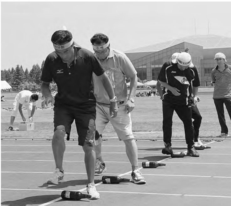
足元に集中してビール瓶を立てます