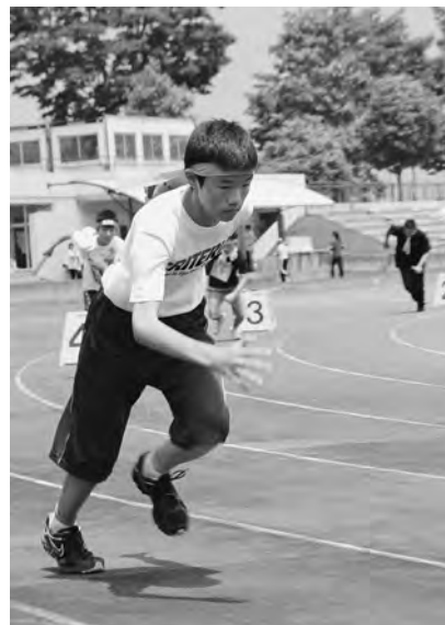
スタートダッシュが勝敗のカギ