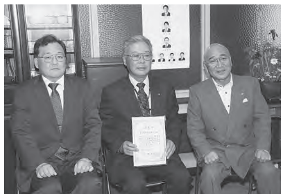
認定証を受け取る甲地代表理事（中央）