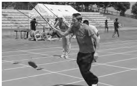
ワカサギ釣りならまかせろ!!