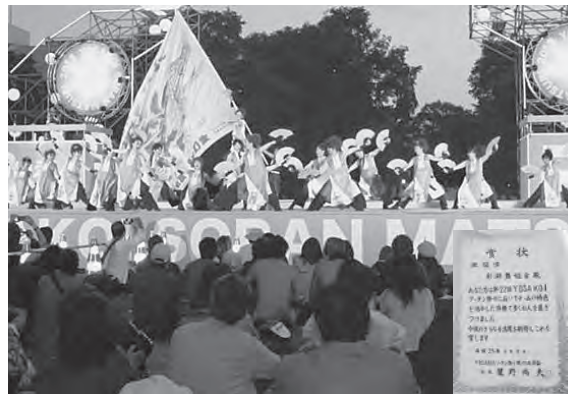
メインステージで演舞する彩湖舞姫会

同チームは初出場で、全国各地から参加した139チームの中から、もう一度見たいと思うチーム10選として敢闘賞を受賞、名古屋代表は「所属人数が100人を超えるチームが多い中、私たちのチームが選ばれた事に感激しています。今まで支えてくれた皆に感謝したい」と話していました。