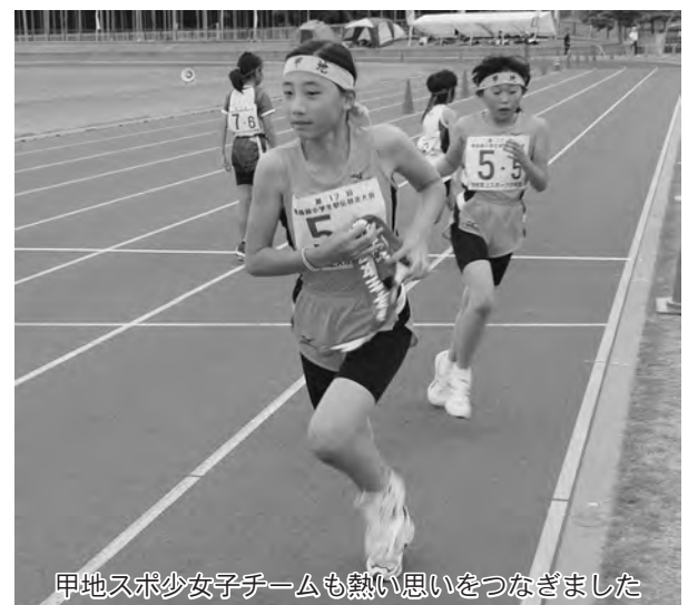
甲地スボ少女子チームも熱い思いをつなぎました