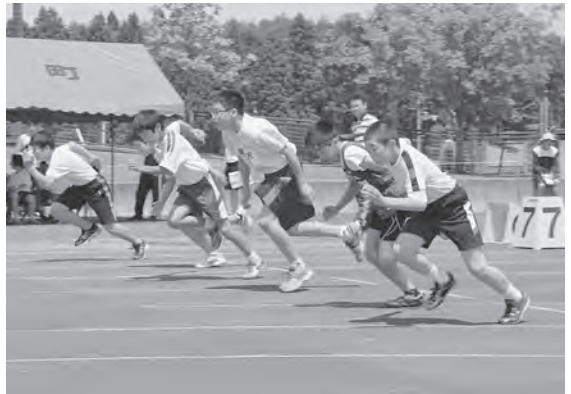
さあ、自己ベストに挑戦!!

大会には、町内7小学校の4年生以上の全児童約500人が参加。100m競走や200m競走、400mリレーなどのトラック競技5種目と、走り幅跳びとボール投げのフィールド競技2種目で、日ごろの練習の成果を発揮し、自己ベストの更新にチャレンジしました。