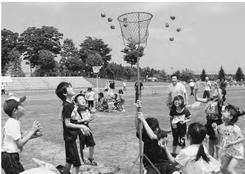
みんなで大空へ向かって「えいっっ!!」