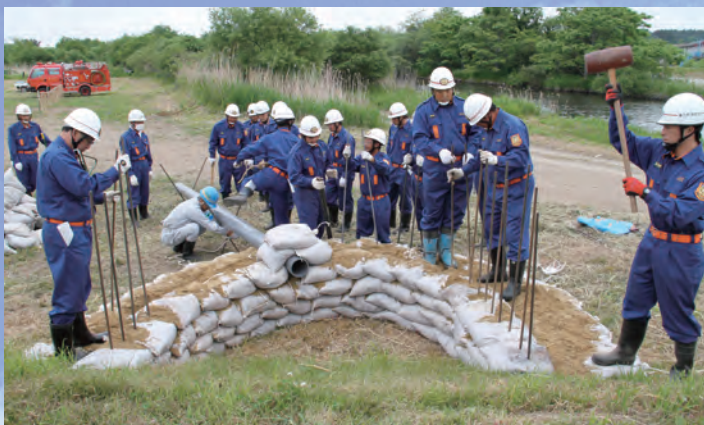
支え杭を打ち込んで月の輪工が完成しました