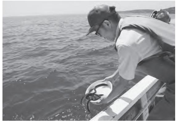
ウナギの稚魚を放流する様子

この日放流したのは、都内の養殖業者から空輸で届いたばかりの15～20センチの稚魚で、船に乗り込んだ漁協関係者が、ウナギの成長に適しているポイント5箇所、大きく育つことを願いながら放流しました。