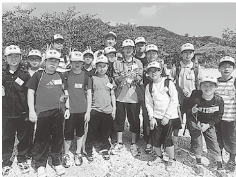
小笠原で思い出の一枚（右から4人目手前）

このB&G体験クルーズを体験して、とても楽しかったです。たくさんの友達、いくつもの思い出を作ることができました。ぼくが一番の宝物の思い出です。