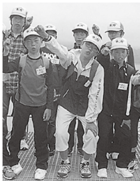
みんなと一緒に（中央手前）

最後にぼくは海について分かったことがあります。それは、小笠原から東京に戻った時、海を見てみると小笠原の海とは違い、にごつていました。そこから分かったことは「東京の海は小笠原と違い、文化が発達しているけど環境保全については、まだまだできていないなあ」と思いました。つまり、一人一人が環境について考えた方がいいと思います。今回は体験クルーズに参加する機会をあたえていただき、ありがとうございました。