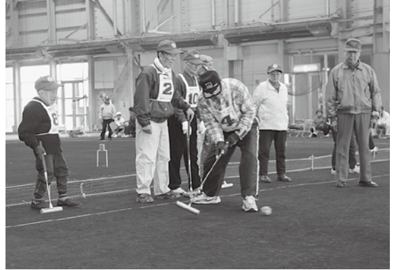
選手たちがプレーを楽しみました