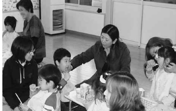
H25.5.11 乙供文化保育園 おいしくぱくぱく教室から

むし歯や歯周病は、食事や歯みがき、疲労、喫煙などの生活習慣と密接にかかわり合っています。むし歯や歯周病を予防するためには生活習慣を見直し、かかりつけの歯科医で定期的に歯科健診を！