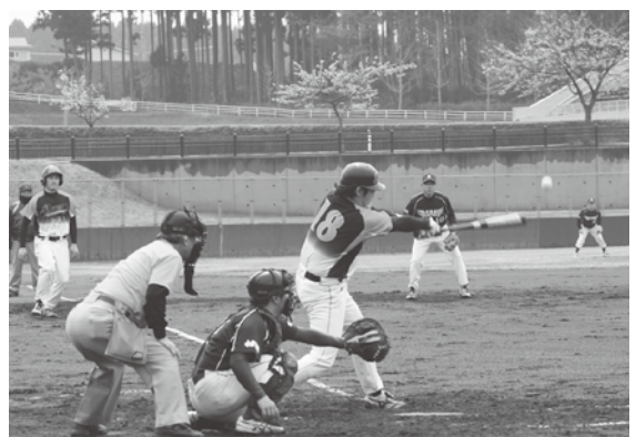
野球シーズンの到来を告げる観桜旗