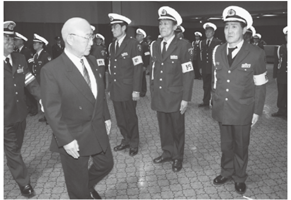
斗賀町長から査閲を受ける隊員

式では、斗賀町長が隊員一人一人の服装や手帳などの査閲を行った後「地域住民が安全・安心な生活ができるよう、交通安全・防犯意識の高揚に努めてほしい」と隊員を激励しました。