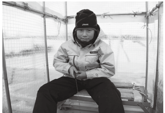
ワカサギの氷上釣りを楽しみました

釣り堀は3月10日、毎週土・日・祝日の9時から15時まで営業しており、料金は餌代・さお代で300円。