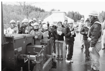
工事現場では色々な作業車が活躍しています。