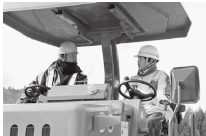
振動タイヤローラの振動にビックリ!!