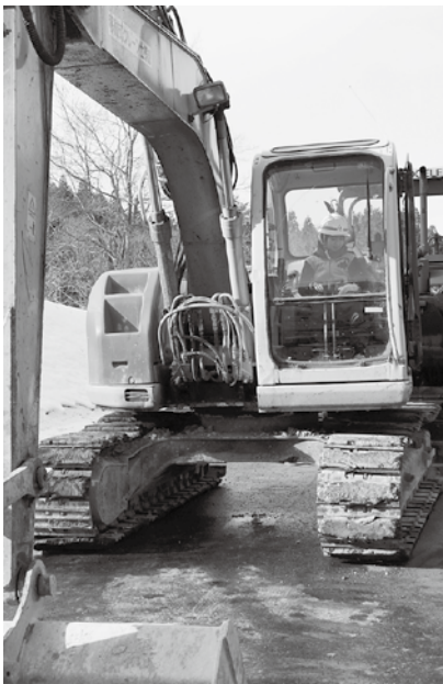
パワーショベルの乗り心地も体験しました。