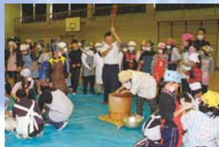
みんなで今年収穫した紫黒米の餅つきをしました