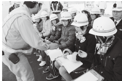
工事現場のテントでアスファルトの構造について学びました。