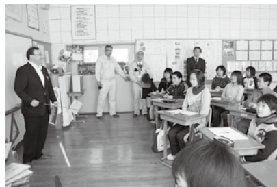
道路の役割りやどのように出来るかなど、概要を勉強しました。