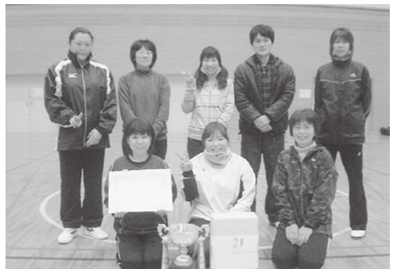
優勝したナインナインチーム