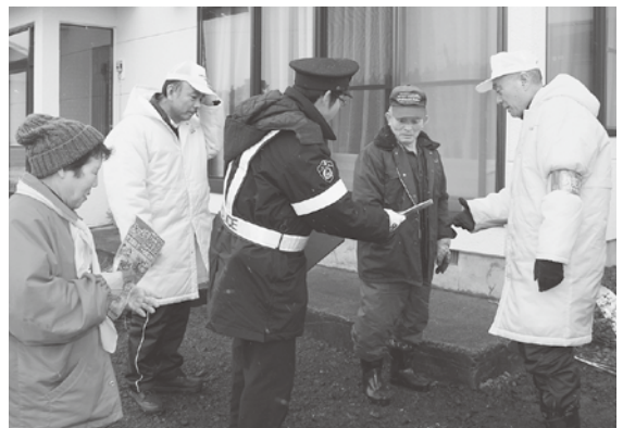
安全チェックのポイントを説明しました

これは、高齢者の皆さんが安心して新年を迎えられるよう毎年実施しているもので、この日は参加した13人が、各世帯の分電盤や非常口の点検をしながら、火の取り扱いや雪道の歩行に気をつけるよう呼び掛けました。