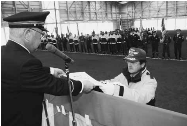
10年勤続表彰を斗賀町長から受ける消防団員