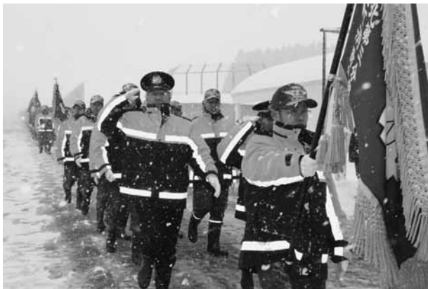
消防団員ら約320人による一糸乱れぬ分列行進