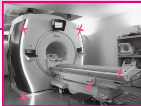
新たに設置された1.5テスラのMRIです