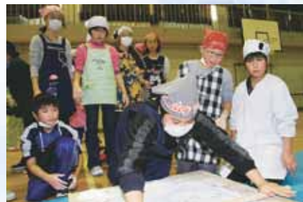
つきあがった餅をのし棒で伸ばしました