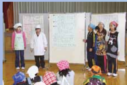
各グループが学習のまとめを発表しました