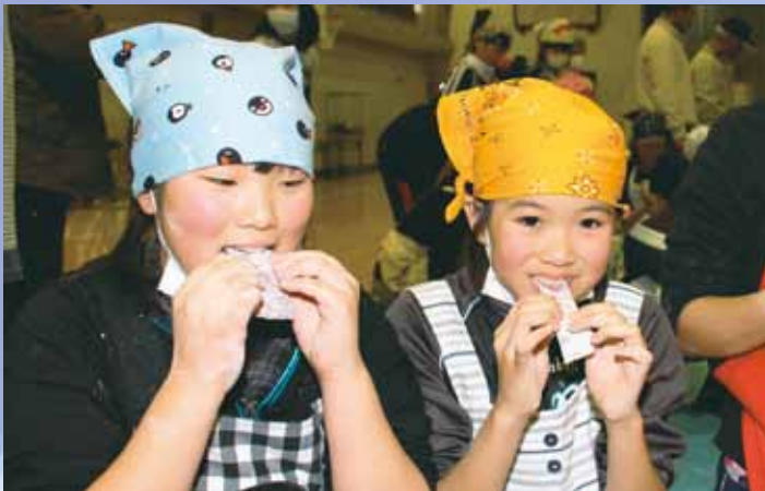
出来たての餅は「やわらか〜い！」

餅つき会では、5年生が12グループに別れ、米について学習のまとめを発表した後、紫黒米研究会や老人クラブ、保護者の方々と一緒に餅つきをし、今年収穫した紫黒米を使った紫色の餅を味わいました。