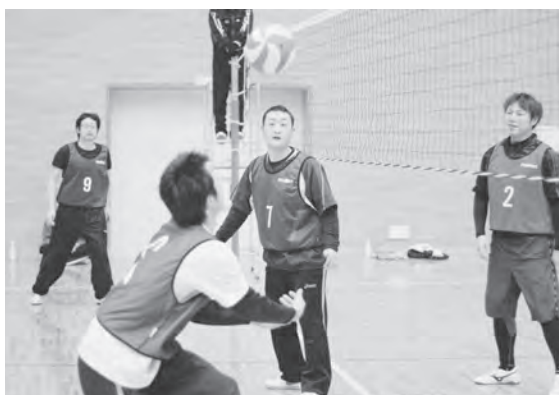
和気あいあいとプレーを楽しみました