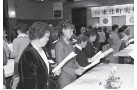
出席者全員で町民の歌を斉唱