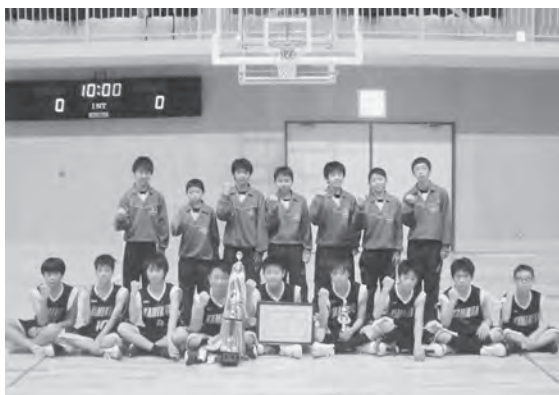
見事優勝に輝いた上北中男子