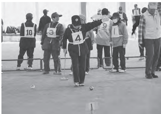
各チームが熱戦を繰り広げました