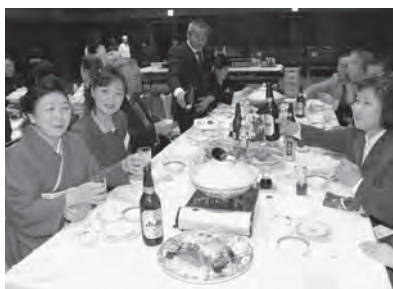
思い出話に花を咲かせた祝賀会