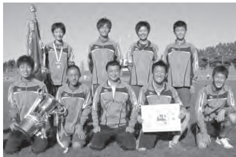
熱い思いをつなぎ、町の部王座奪還を果たした東北町チーム

次にスポーツでは「駅伝の町・ 東北町」は、県民駅伝で、2年 ぶりに町の部の優勝を飾ってい ます。今年は、総合優勝を期待 します。中学校駅伝競走大会で は、東北中学校が男女とも東北 大会へ出場し、男子は全国大会 へも出場しています。