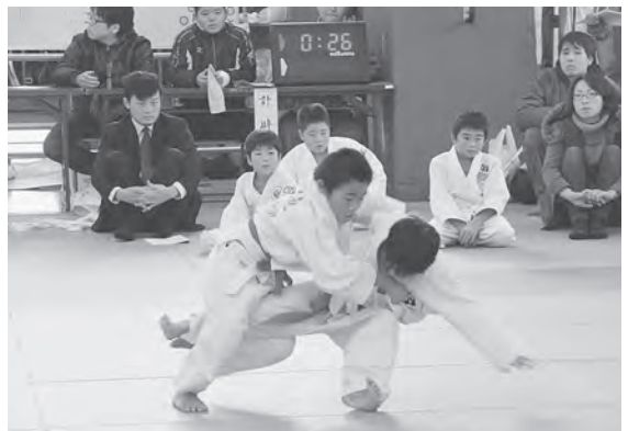
多彩な技が飛び出しました

また、会場には保護者らが応援に駆けつけ、大きな声援で子供たちの熱戦を後押ししていました。