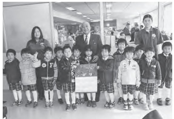
手作りカレンダーを送った園児たち