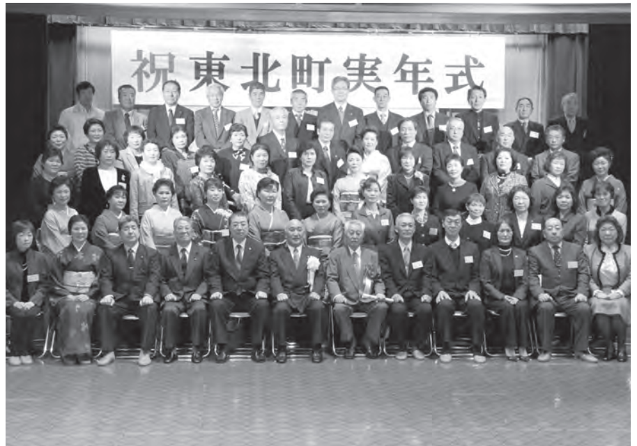
出席者56人が笑顔で記念撮影