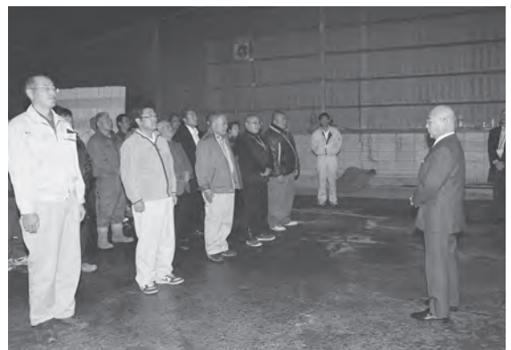
安全作業を誓い合いました