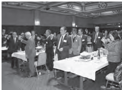
さらなる活躍を誓い合って乾杯