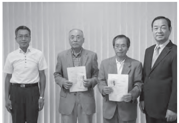
補助金の交付を受けた文化芸能団体

補助金の交付を受けた両団体は、「半纏（はんでん）や衣装をそろえて、これからの文化芸能活動を活発にしていきたい」と、声をそろえて感謝していました。