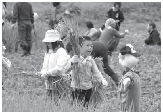
稲の刈り取り作業を楽しむ児童たち

刈り取ったもち米は、11月の収穫祭で地域の方々と、もちつきをして一緒に味わうことにしています。