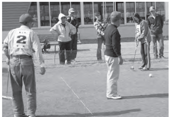
熱戦を繰り広げたゲートボール