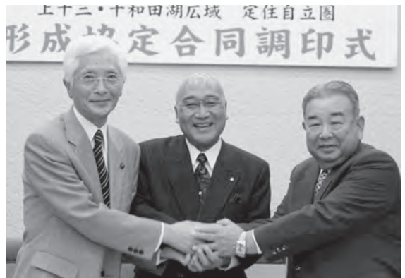
協定書を掲げる10市町村長

10市町村は、本年度末までに共生ビジョンを策定し、来年度から連携事業を展開する予定です。