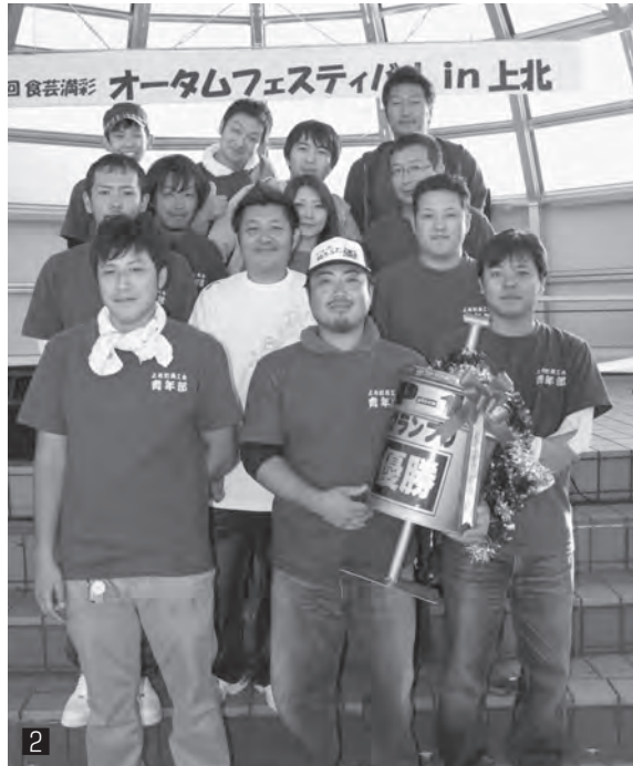
P-1 (ピザワン) グランプリ結果