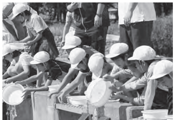
稚ガニを放流する児童たち

稚ガニの放流を、授業の一環として取り入れたのは今年度がはじめて、地域資源の保全を目的として、今後も続けていく予定です。