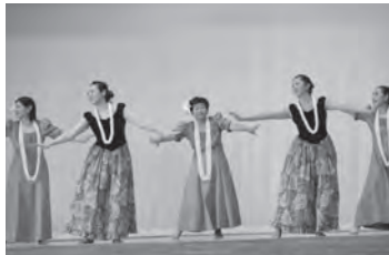
懇親会では踊りやダンスが披露されました