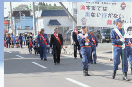
上北町駅前まで防火パレ ーの様子