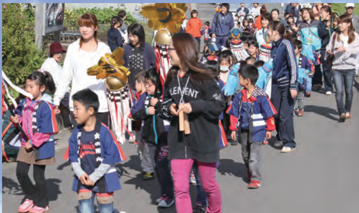
乙供駅周辺で火災予防を呼びかけました

上北地区は、雨天のためふれあいドーム上北で出発式だけを実施。園児が「火遊びば絶対にしません」などと、元気に火の用心を約束しました。