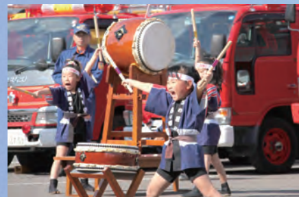
アトラクションのあと防 火の誓いをしました