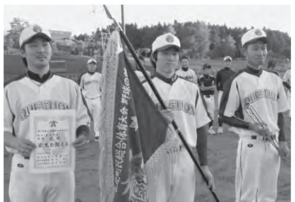
野球は乙供チームが1位