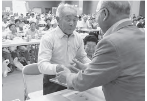
米寿のお祝いに顕彰状の授与