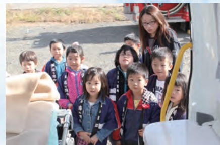
救急車の中を見学する園 児たち