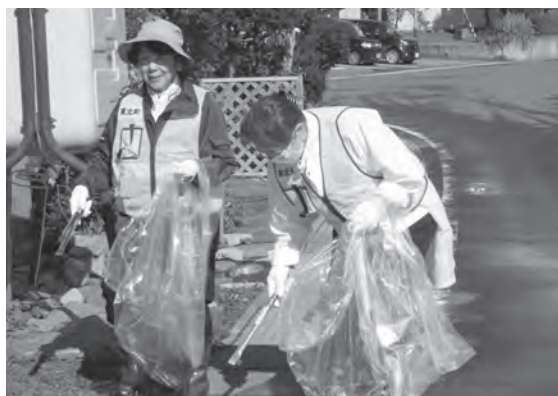
空き缶などを拾い集める参加者

清掃活動は9月24日から10月1日までの環境衛生週間の事業の一環として行われ、参加者は1時間ほどかけて両施設周辺の空き缶やゴミをていねいに拾い集め、ボランティア活動に汗を流しました。