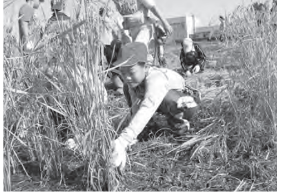
紫黒米の稲を刈り取る児童たち