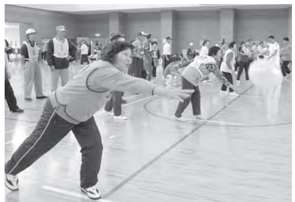
ユニークな各競技を楽しむ参加者

大会には、上北郡内の老人クラブが10チームに分かれて出場。スプーンの上にボールを乗せて運ぶ「スプーンリレー」や、ビール瓶を棒で転がして進む「ビン転がしリレー」などの10競技で心地よい汗を流し、参加者相互の親睦を深めていました。