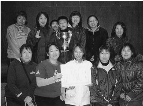
女子優勝、ピンクパンサーチーム

イベントの情報や身の回りで起きた出来事など、情報をお寄せください。 また、広報に関するご意見やご希望等がございましたら、匿名でも構いませんのでお待ちしております。 役場企画課 広報係 Tel.0176-56-3111 (代表)またはTel.0175-63-2111 (内線233)