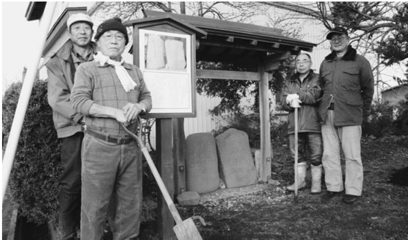
大浦の「念仏供養塔」と「庚申塚」を説明する看板を設置しました

申（こうしん）塚」の2つで、2つ並んで置かれているのは大変珍しいとのこと。向かって右側の念仏供養塔は、厄除けのほか、男たちが力比べをするための「力石」としても用いられ、左側の庚申塚は、道路標識の役割があり、2つとも家内安全や五穀豊穰などの願いも込められています。