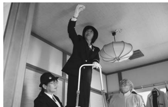
火災警報器を設置して防火を呼び掛けました

東北消防署や表町婦人防火クラブの皆さんが高齢者宅を訪れて警報器を設置し、使用方法などを説明。「火の元に気をつけて」などと呼び掛けていました。