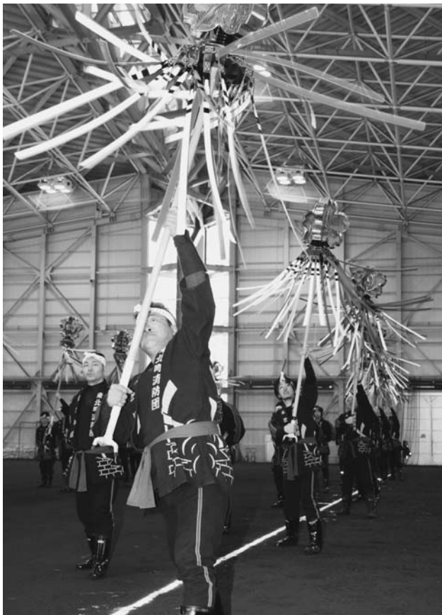
勇壮なまとい振りで消防団員の心意気を披露