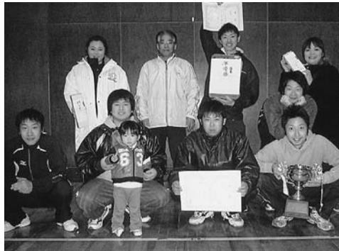
男子優勝、上北ホームガスチーム

16チームが熱戦展開 ナイターバレー大会 第5回町ナイターバレーボール大会がこのほど開催され、16チームが熱戦を繰り広げました。