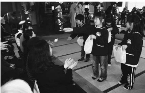
参列者に餅をまく乙供保育園の園児たち

続いて、参列者が持ち寄ったしめ縄やお守りなどを燃やす「どんど焼き」が行われ、新しい年の健康を願いながら、もくもくと上がる煙を頭や体に浴びていました。