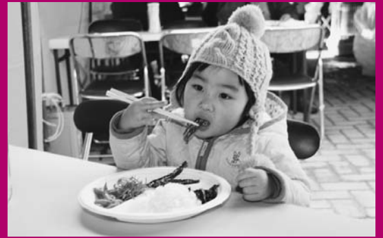
おがわら湖美味満彩祭り

小川原湖の新鮮で豊富な食の魅力をアピールする「おがわら湖美味（うめえ）満彩祭り」が12月19日、道の駅おがわら湖で開かれ、町内外から訪れた大勢の家族連れなどが、湖の幸を味わいました。 祭りではさまざまなイベントが行われ、ワカサギの佃煮やコイの甘露煮などの無料バイキングに長蛇の列ができたほか、ザリガニ釣りやモクズガニレースでは子どもたちの歓声が響いていました。 また、「シラウオ丼」や「大和（やまと）巻き」など、宝湖（たからこ）活性化協議会が企画した新メニューも披露され、来場者は湖の幸の食べ比べを楽しんでいました。