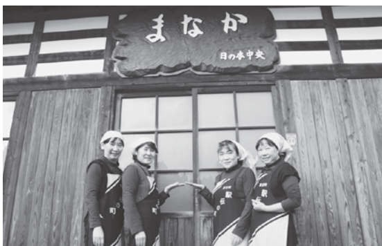
レストラン営業に意気込むメンバー