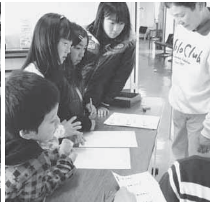
図書館クイズコーナーも大盛況