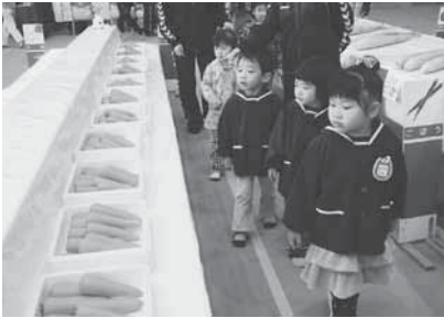
どのニンジンが一番おいしそうかな？

また、東北会場ではオープニングセレモニーや農林畜産物共進会が、上北会場では健康展や野菜即売会などが行われ、2日間にわたり大勢の来場者でにぎわいました。