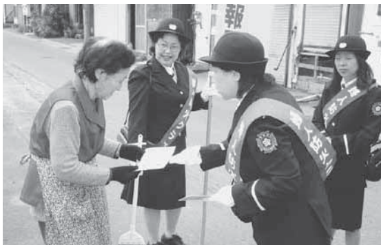
火災警報器設置を呼び掛けるさくら分団団員