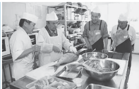
大きな鯛の3枚おろしに挑戦