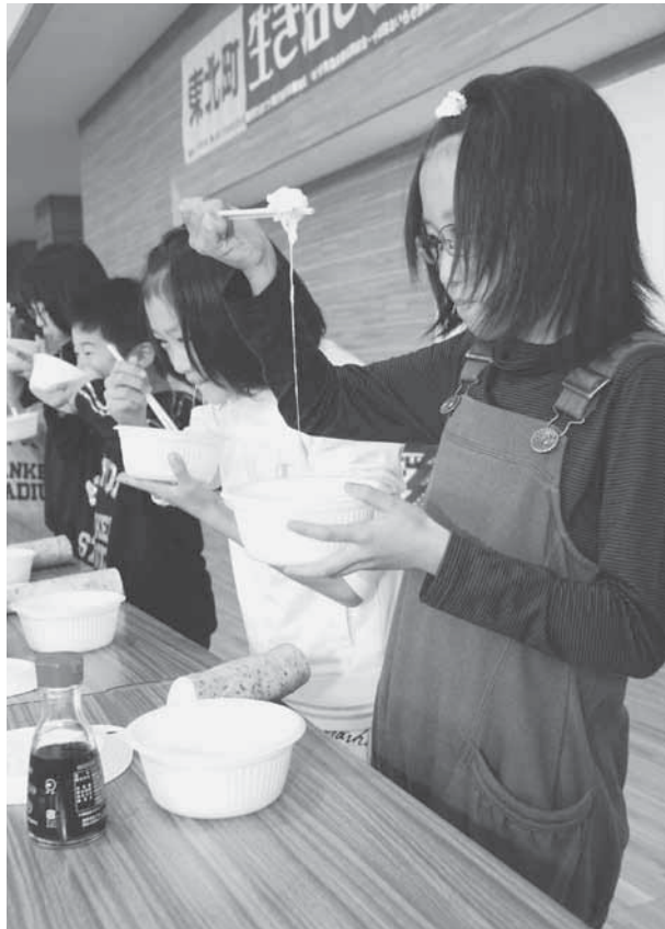
粘りと風味がたまらない。ナガイモとろろ早食い大会