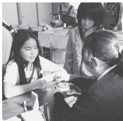
歯科相談コーナーでブラッシング指導