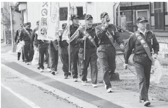
火の用心を呼び掛けながら歩く消防署員たち

署員は、拡声器で火災警報器の設置を呼び掛けながら、歩道のごみを拾い集めていました。