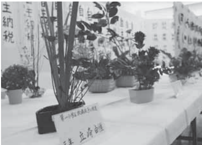
放課後子ども教室の児童も立派な花を出展