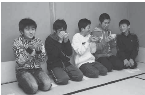
「緊張して笑っちゃうなあ」茶道体験コーナー