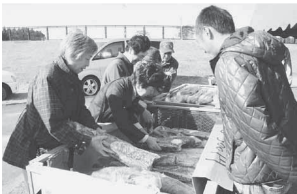
「ナガイモもハクサイもネギも何でも安いよー」