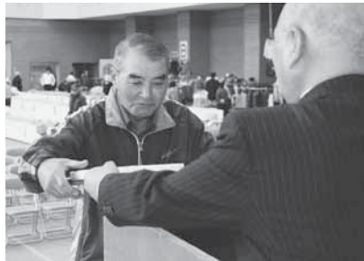
立派な野菜ができました。農林畜産物共進会表彰式