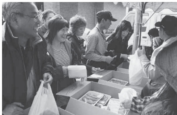
きれいな霜降りの和牛肉を特価で販売