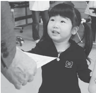
むし歯のない子の表彰式