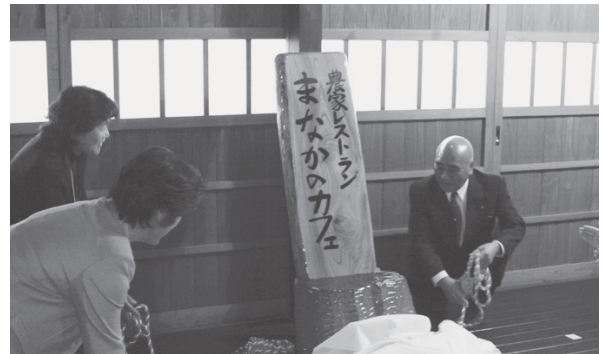
看板の除幕式でレストランの名前を披露しました

たちの念願。特産品をふんだんに使った料理で、町の魅力を全国にアピールしたいです」と意気込みを語りました。 出席者は、重厚なはりや趣のある座敷など古民家ならではの雰囲気満載しながら、お膳に並んだ五目ご飯やガニ汁、シラウオとナガイモの揚げあんかけなど、町の豊かな食材を生かした8品に舌鼓を打ちました。 まなかのカフェは、毎週日曜日に営業して、ランチやケーキなどの軽食を提供。日曜日以外は予約制（10人以上から）で、予算に応じたお膳や弁当の注文に応じます。