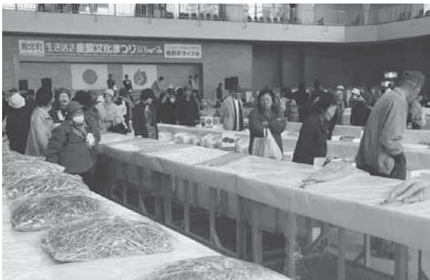
精魂込めて作った農産物がずらりと並んだ共進会