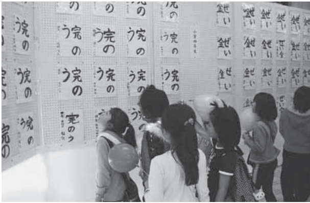
力強い筆遣いをご覧あれ