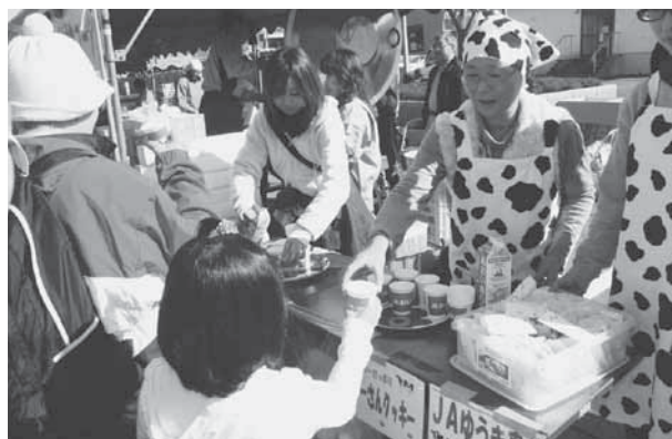
新鮮でおいしい牛乳を召し上げ