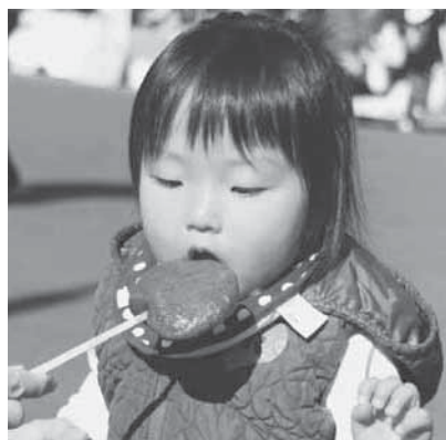
アツアツの串もちをパクリ