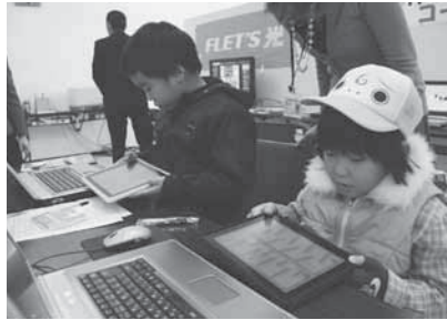
パソコン体験コーナーで人気のiPadを体験