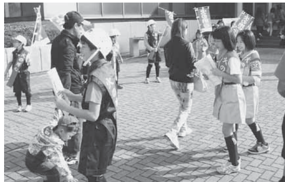
警報器設置をPRする表町少年消防クラブのメンバー