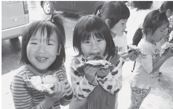
「あったかくておいしいね」

パックドックとは牛乳パックに入れたホットドッグを焼いて調理するもので、園児たちはお姉さんやお兄さんと一緒に作業を進め、焼き上がったアツアツのホットドッグをおいしそうにほおばっていました。