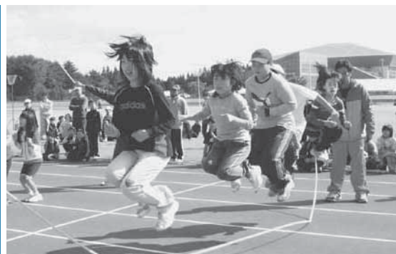
長縄跳びに汗を流す子どもたち

同団員9人は東北消防署員4人と一緒に、警報器設置を呼び掛けるのぼり旗を掲げながら2班に分かれて家庭を訪問。設置状況を調査しながらパンフレットを手渡して歩きました。