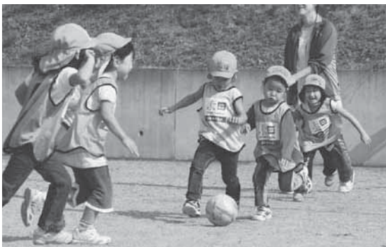
華麗なボールさばきを見せる園児たち

指導を行ったのは、県サッカー協会キッズ委員会のインストラクター3人。まず鬼ごっこで動きの基本を学んだり、ボールの感覚に触れたりした園児たちは、インストラクターを相手にしたゲームに挑戦。ドリブルやシュートなど華麗なボールさばきを見せ、ゴールを決めるたびに歓声を上げていました。