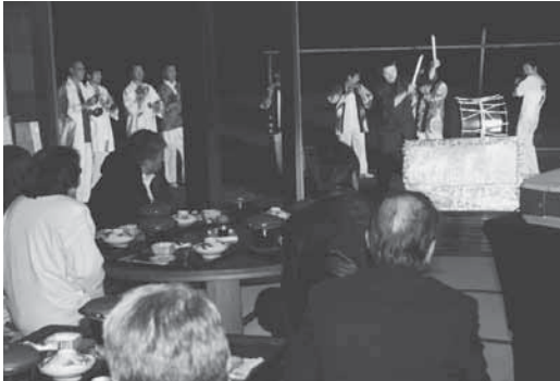
交流会参加者を神楽囃子でお出迎え

また、初日に「まなか」で開かれた歓迎セレモニーでは、東北神楽会やませ太鼓（伊賀賀代表）の皆さんが、来場者を神楽囃子（ばやし）でお出迎えしました。