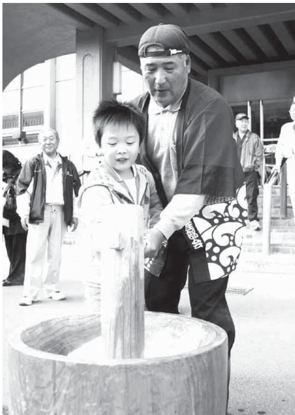
「おいしいおもちになあれ！」