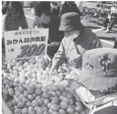
袋詰め限界に挑戦