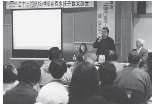
講演会や情報交換会が行われた家族交流会

また、レクリエーション交流会や日ごろの悩みや思いを語り合う情報交換会も行われました。