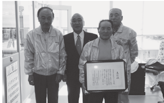
表彰を受けた、ひのものとまなかパトロールの会