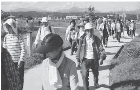
深まり行く秋を満喫しながら歩く参加者

十和田市役所前をスタートした参加者30人は、官庁街通りや稲生川遊歩道などを元気に散策。赤、黄、緑と錦色に染まった八甲田連峰を眺めて深まり行く秋の自然を満喫しながら、再び十和田市役所へ戻る約7キロのコースを2時間ほど掛けて歩きました。