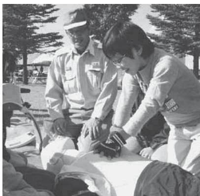
子どもたちも救急法を体験