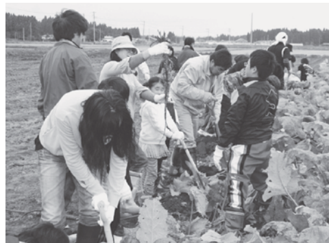
力を込めてゴボウを引っこ抜くツアー参加者