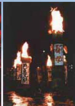
【入選】上「清流に映える炎」藤林哲夫（弘前市）、上右「赤川 火の海 たいまつ祭」野々宮彰（三沢市）、右「乙女の願い」佐藤幸一（十和田市）