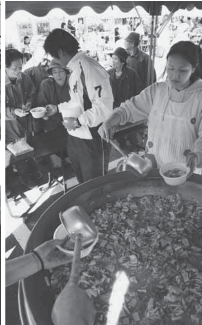
400人分の特大鍋でじっくり煮込んだ馬肉汁には長蛇の列