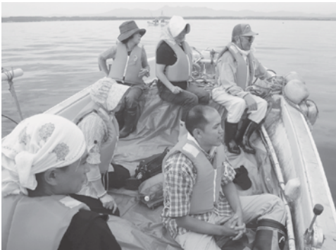
漁船に乗ってシラウオ・ワカサギ漁の見学

同ツアーでは、漁船で小川原湖へ繰り出してワカサギ・シラウオ漁の見学を実施したほか、湖の新鮮な魚介類を使った料理作りの体験、一里塚や日本中央