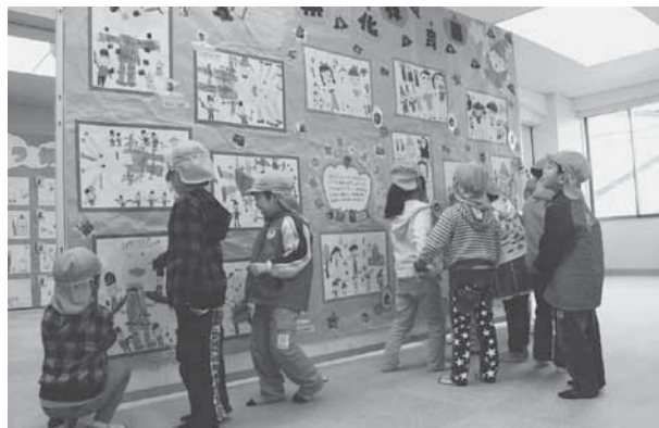
「ぼくが描いた絵、上手でしょ」