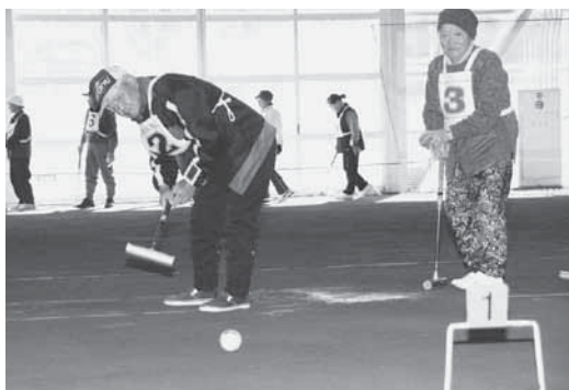
一打入魂でプレーする選手たち