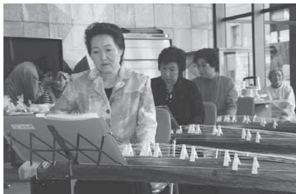
箏に親しむ会による優雅な琴の調べ