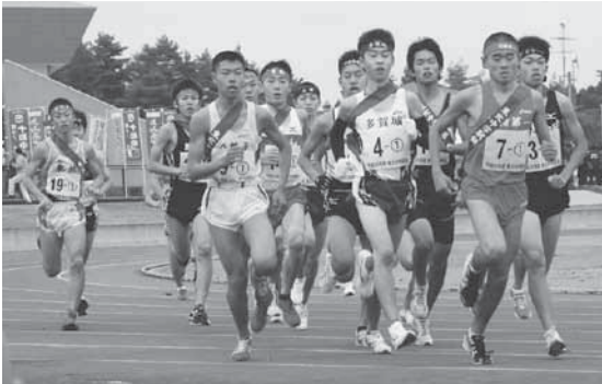
東北6県のトップランナーたちが力走

当町からは、9月の県予選を勝ち抜いた東北中がアベックで出場。沿道の大きな声援を受けて力走した結果、女子は18位、男子は17位でした。