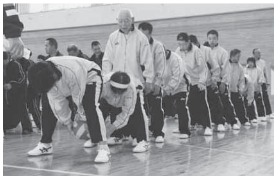
ハッスルプレーを展開する参加者