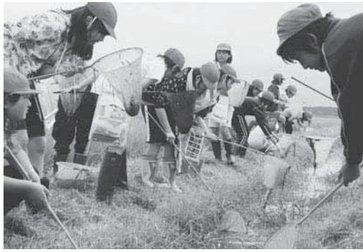
水路を網ですくって生き物調査をする児童たち