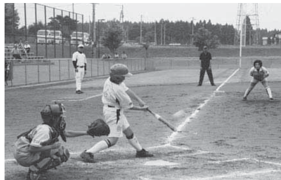
東北第一スポ少チームが優勝したソフトボール大会

また、「シジミ漁で使用する「シヨレン」を持参し、児童に漁の大変さを体験させました。児童たちは「シジミはどこに出荷されるの」とか「シジミがたたくさん取れる時期は」など、次々に質問を投げ掛けていました。