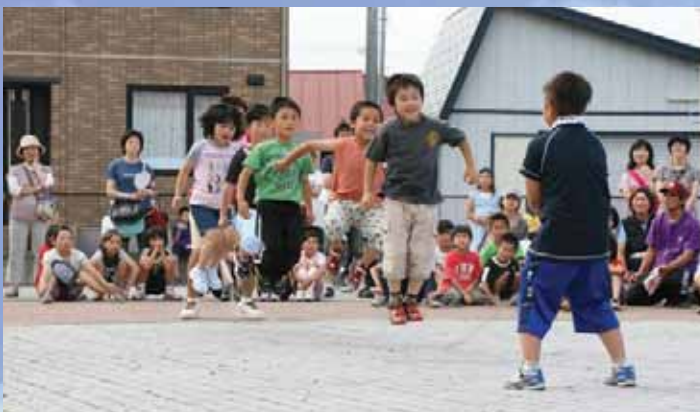
心をついにジャンプ！7人一組長縄跳び大会

4日には、豪華賞品が当たるビンゴ大会が行われ、多くの家族連れなどでにぎわいました。