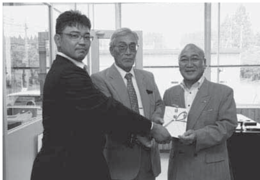
斗賀町長に目録が手渡されました

児童たちは初めに、専用の検査キットを使って水路の水の汚れを調査。酸素が多く含まれていて、生き物が生息しやすい環境であることを確認しました。続いて、網で水路の水や泥をすくって、魚や貝、昆虫を次々と見つけ、きれいな水がたくさんの生き物の生息を助けていることを学んでいました。