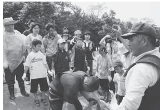
網に掛かった魚の説明を受ける参加者

また、漁獲したモクスガニを棒でつぶしてモクスガニ汁作りを体験したほか、コイの刺身やフナの空揚げなど、新鮮な湖の幸に舌鼓を打っていました。