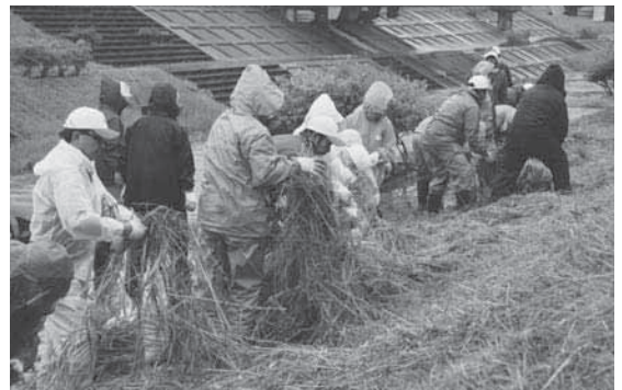
たいまつ祭会場の草刈りをする青森クボタの社員