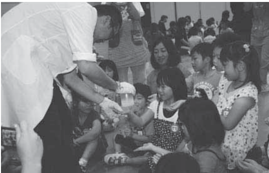
液体窒素の冷たさに驚く園児たち

モクモクと白い煙が出る液体窒素を見てお湯のように熱いと思っていた園児たちは、液を入