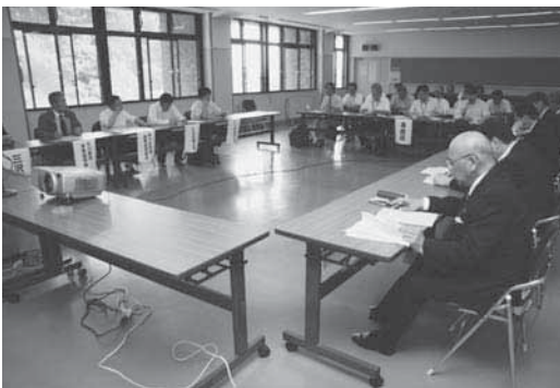
湖資源活用のため連携することを確認しました

設立会では、会長に斗賀町長を選出したほか、事務局の上北地域県民局が、活動案としてジャガイモ入りシジミ汁コンテストの実施や、地元で作られている郷土料理を基にした新たな