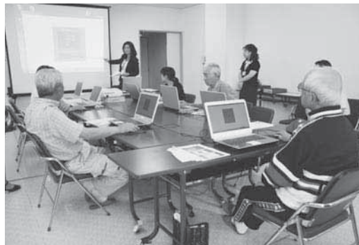
ITサポートセンターで開催している講習会