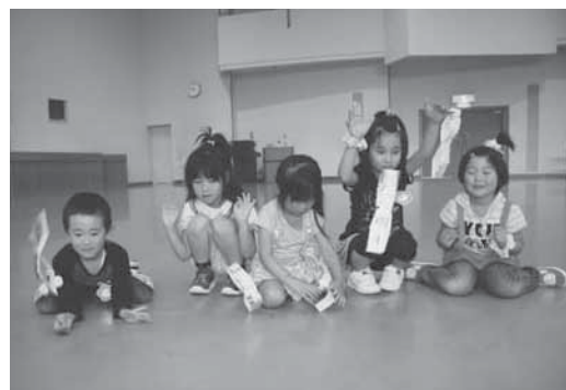
ビックリカエルで「ピョーン」

れたピーカーに触らせてもらおうと「冷たい」とびっくり。液につけたバラの花がパリパリと音を立てて粉々になったり、床に投げたゴムボールがポンと破裂したりと、マイナス200度近い液体の不思議に驚きの連続でした。