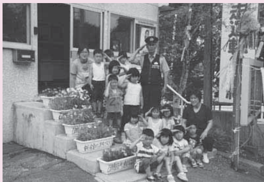
華やかな七夕飾りを贈った乙供文化保育園児