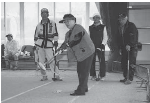
屋内での開催となったグラウンドゴルフ大会