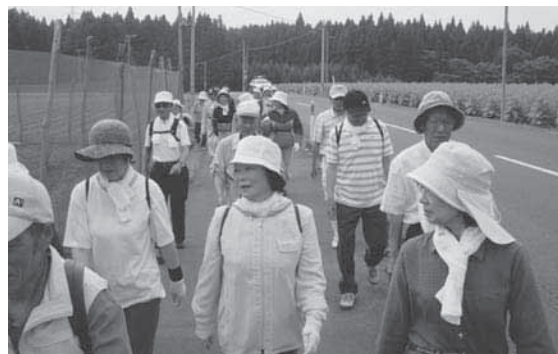
7キロのコースを歩き心地よい汗を流すウォーク会員

上北地方の代表として出場した上北中は、初戦の五戸町にコールドゲームで大勝すると、決勝戦の相手、六戸中を6対2の逆転勝ちで制し、2年連続で県南地区の頂点に立ちました。