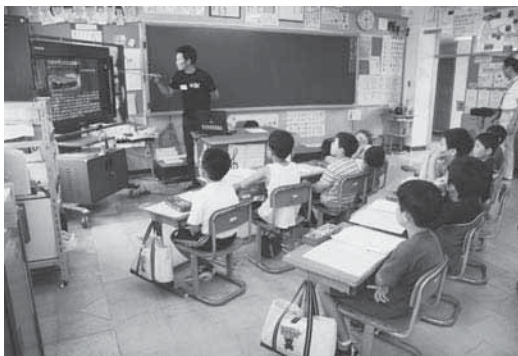
ゲストティーチャーが電子黒板を使って授業

これは、総合学習の一環として今年初めて実施したもので、学習するテーマは児童のリクエストにより、「シジミ」「シラウオ」「ナガイモ」「たいまつ祭り」「駅伝」の5つに決定。テーマごとにJAゆうき青森や町役場などの職員をゲストティーチャーに招いて実施しました。