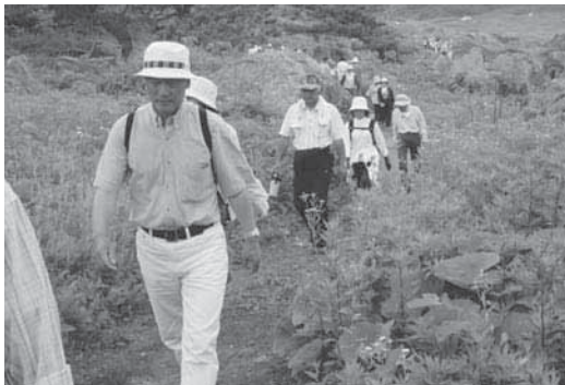
種差海岸の遊歩道を散策する参加者たち

また、コース途中には、種差海岸の絶景を満喫できる場所もあり、参加者たちは疲れを忘れて初夏の海辺の景色を楽しんでいました。