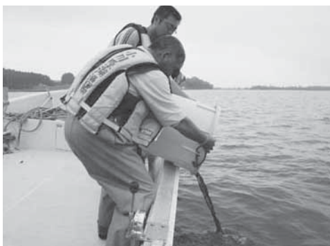
シジミの稚貝を放流する漁協関係者

ゴール地点付近では、工事が進む「(仮称)小川原湖交流センター」の工事現場を見学し、関係者から進捗状況などについて説明を受けていました。