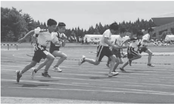
記録に挑戦し、元気に駆け回る児童たち

競技は、学年ごとに、100メートルや200メートル、リレーなどのトラック競技5種目と、走り幅跳び、ボール投げのフィールド競技2種目が行われ、出場した児童たちは自己ベストや大会記録の更新に挑戦し、実力を競い合いました。