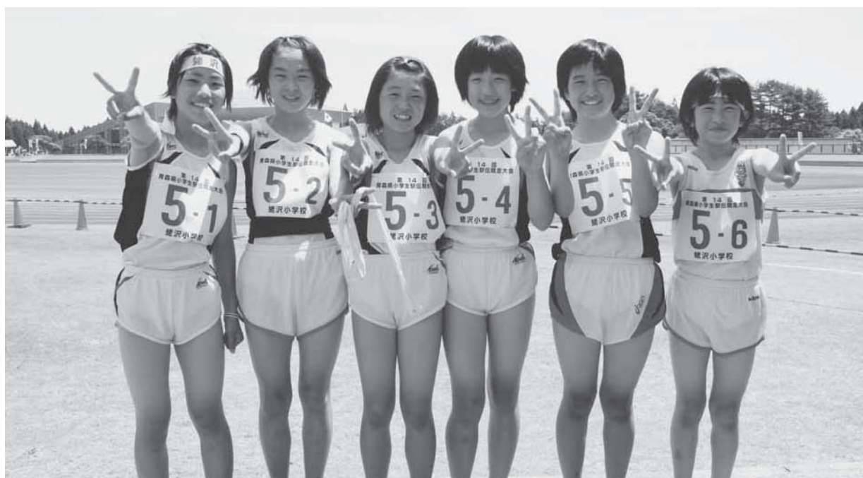
3年ぶり5度目の栄冠に輝いた蛭沢小女子チームのメンバー（左から走行順）