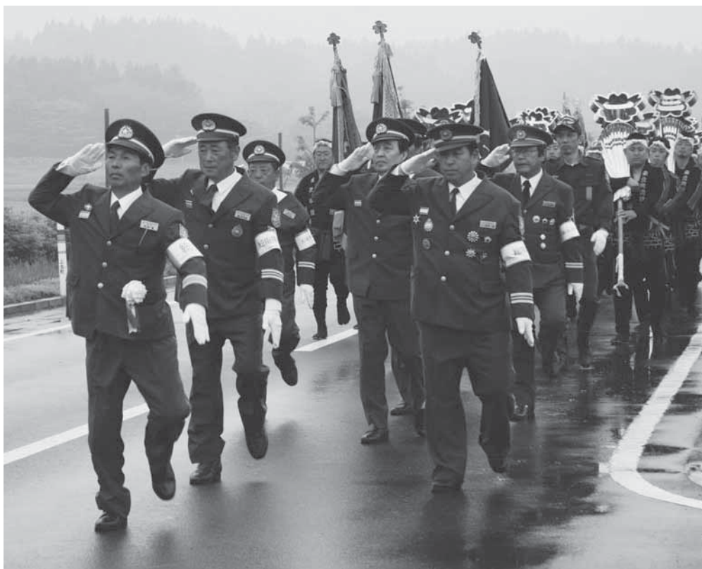
567人の団員と32台の消防車両が気迫のこもった威風堂々の分列行進を披露

県消防協会上十三支部中部上北地区消防連絡協議会の連合観閲式が6月20日、小川原湖キャンプ場周辺で行われ、中部上北地区（東北町・七戸町）から参加した消防団員が、磐石の防災体制確立へ士気を高めました。観閲式では、団員567人と消防車両32台が、斗賀町長らに服装や車両器具などの点検を受けた後、道の駅おがわら湖からレークハウス駐車場までを分列行進しました。レークハウス駐車場では、消防団員による勇壮なまとい振りや、息の合った消防ポンプ操作が披露されました。続いて、中部上北幼年消防クラブを代表し、乙供文化保育園の園児がミニ操法を、ポプラ保育園の園児がまとい振りの遊戯を披露し、「火遊びをしません」と元気に防火の誓いをしました。式典終了後には、分団対抗の玉落とし競技が行われ、団員たちが日頃の練習の成果を競い合いました。