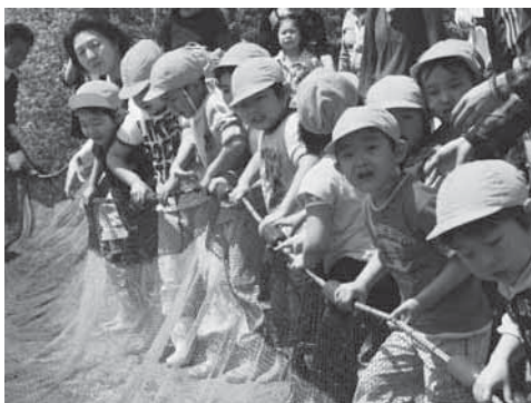
力を合わせて網を引く園児たち

全員で網を手繰り寄せ、掛かった魚をシートの上に広げると、ナマズやモクスズガニなどがどっさり。50斤を超えるフナの大さに驚き怖がる園児もいましたが、小さきままな魚を捕まえて歓声を上げていました。