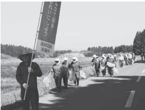
たばこのマナーアップを呼び掛けました

参加者は「みんなでまちをきれいにしよう」のぼり旗を先頭に、新山地区から菩提寺地区までの町道を約2時間かけて歩き、歩道や側溝などに落ちていたたばこの吸い殻などを拾い集め、町民にたばこのポイ捨てをやめるよう呼び掛けていました。