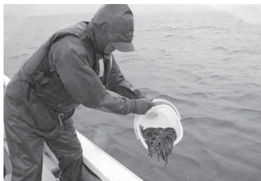
小川原湖にウナギの稚魚を放流する漁協職員

この日放流したのは、東京都の養殖業者から空輸で届いたばかりの20センチ前後の稚魚で、漁協組合員と職員が船に乗り込み、水深が深くウナギの成長に適しているポイント3箇所、大きく成長することを願いながら放流しました。