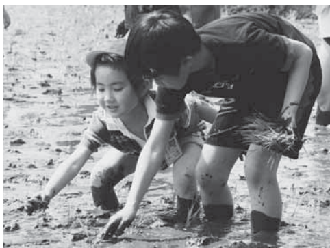
上級生に教わりながら丁寧に植え付け