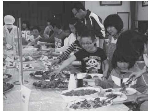
バイキング形式の給食を楽しむ児童たち