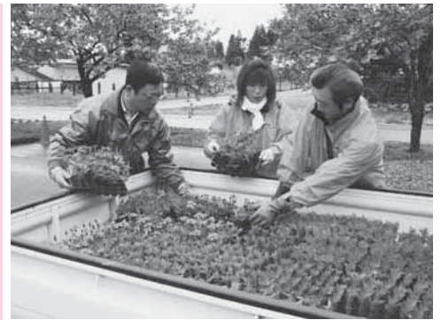
トラックに花苗を積み込む関係者

普段とは違うたくさん料理の中からお好みのメニューを選んだ児童は、縦割り班ごとのテーブルに着き「いただきます」と元気にあいさつ。おいしい食事に会話も自然と弾み、楽しい昼のひとつきを過ごしました。