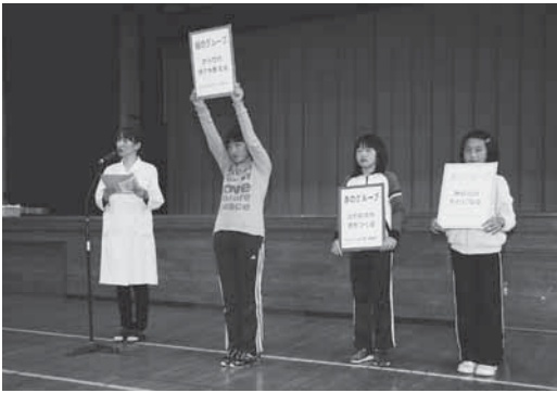
4年生がバランスのとれた食事の大切さを発表

給食の前に、4年生が「熱や力の元になる主食」、「血や筋肉や骨をつくる野菜」、「体の調子を整える副菜」の3種類の料理