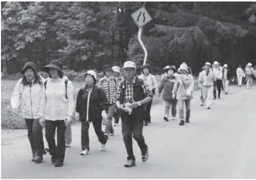
初夏の散策を楽しんだ参加者

散策の途中には、キツネと遭遇。思わぬ珍客との出会いに、参加者たちは夏の訪れが近いことを感じていました。