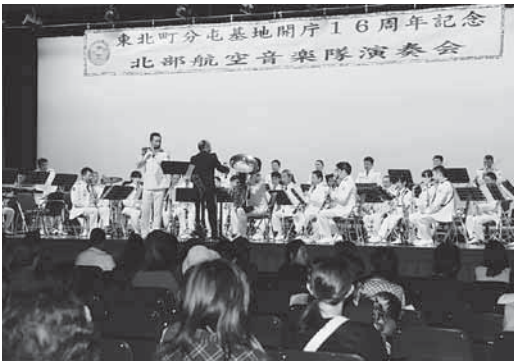
北部航空音楽隊による迫力ある演奏

12日には北部航空音楽隊による演奏会がコミュニティセンター未来館で開かれ、基地内で実際に吹奏されているという起床や消灯の曲を、ラッパ隊5人が披露したほか、総勢30人以上の奏者による迫力あるクラシック音楽などが演奏され、大勢の吹奏楽ファンが迫力ある楽曲を満喫しました。