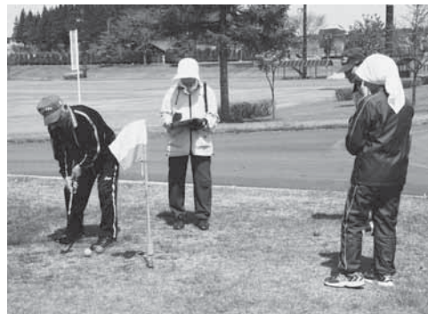
グラウンドゴルフで親睦を深めました

第5回町グラウンドゴルフ大会が5月16日、北総合運動公園グラウンドゴルフ場で行われました。