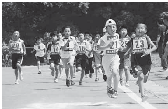
マラソン大会で健脚を披露する子どもたち

13日は同基地が一般開放され、基地内で保管されている装備品などを展示して、来場者に紹介しました。