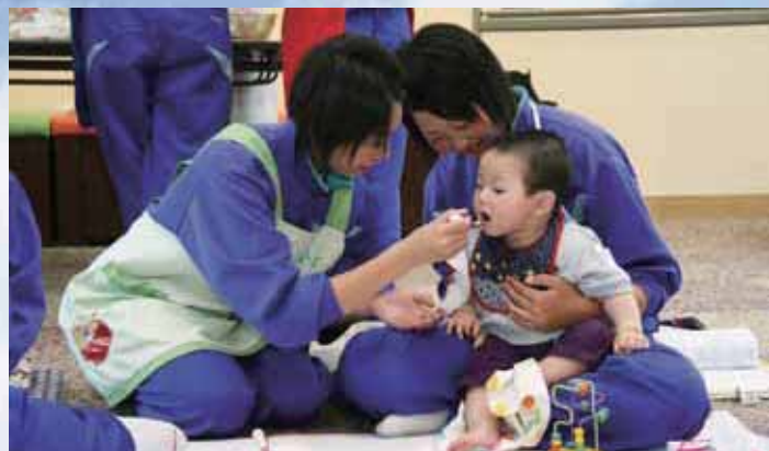
育児の楽しさや大変さを実感 (東北中)

その後、おもちゃで遊んだり、離乳食を食べさせたりして赤ちゃんに触れ合い、育児の喜びや苦勞を体験しながら、命の大切さを学びました。