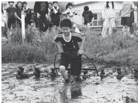
カタツケを引くのは結構力が必要です

また、カタツケと呼ばれる機具を引いて、苗を植えるポイントに印をつける作業にも挑戦しました。