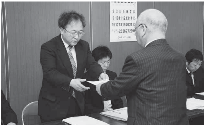
斗賀町長(右)から委嘱状を受け取る委員

小川原湖など東北町の地域資源を生かした滞在型観光を確立するための「小川原湖191里づくり協議会」の委嘱状交付式が5月27日、役場本庁舎で行われ、21人の委員が委嘱を受けました。