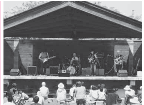
熱いステージが繰り広げられたコンサート

5月30日と6月1日には、JR上北駅から沼崎踏切までの線路沿いの花壇で、草取りと花苗の植え付け作業を行いました。また、6月8日には、上北駅前地区のごみステーションをトラックで回り、周辺に散乱しているごみを拾い集めたり、ごみ出しのルールが守られず収集されていないごみ袋を回収したりしました。