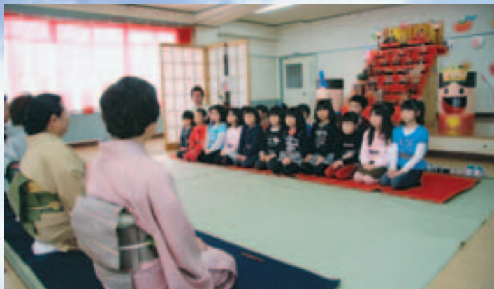
ひな壇の前で行儀よく正座(第二保育園)

お茶会で使用した茶碗は、夏に園児たち自らが作ったもの。初めての抹茶の味に苦そうな顔をする園児もいましたが、「お茶をどうぞ」など、作法通りにあいさつし、代わる代わるお茶をたててお菓子とともに味わっていました。