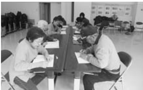
たまには机に向かって勉強