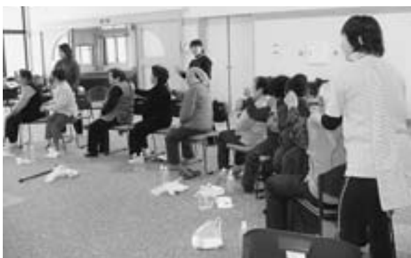
みんなでハツラツ体操