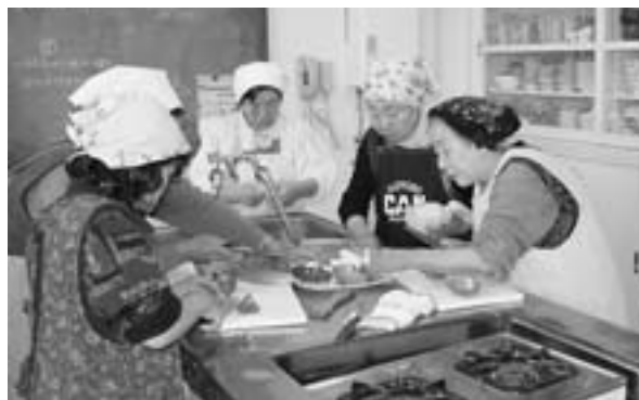
料理の腕前はプロ級