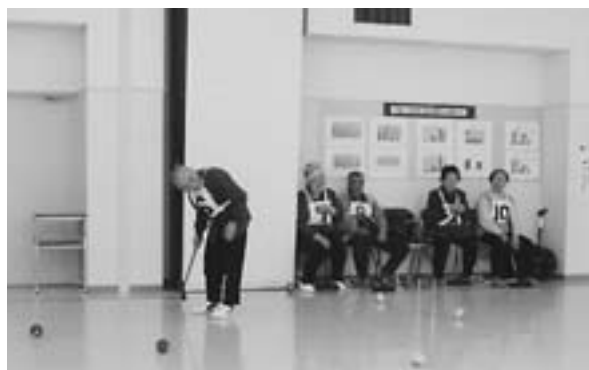
大熱戦のゲートボール