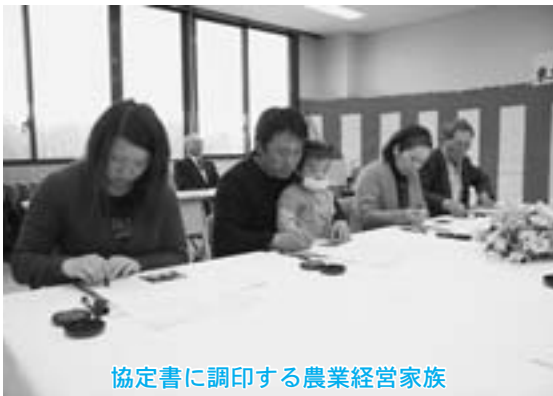
協定書に調印する農業経営家族

平成21年度家族経営協定合同調印式が2月23日、青森原燃テクノロジーズセンターで行われ、5世帯の農家が、労働時間や就業条件などといった、農業経営に関する家族内のルールを定めた協定書に調印しました。 この協定は、農業経営者の高齢化や担い手不足に対応し、家族の絆を深め、意欲とやりがいのある農業経営を推進するために行っているもので、町内で協定を結んだ世帯は延べ74世帯となりました。 調印式には新たに協定を結ぶ