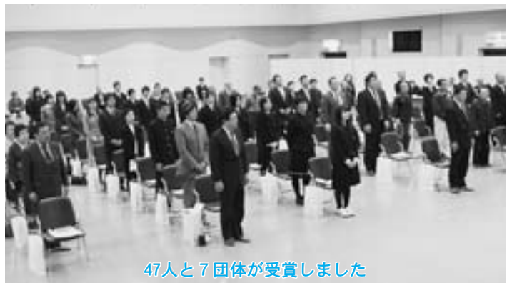
47人と7団体が受賞しました