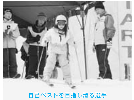
自己ベストを目指し滑る選手