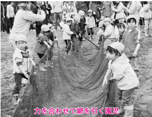
力を合わせて網を引く園児

取れた魚のうち、コイはその場で刺し身にして振る舞われ、園児たちは小川原湖の新鮮な味覚を楽しんでいました。