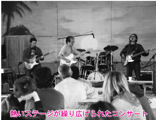
熱いステージが繰り広げられたコンサート