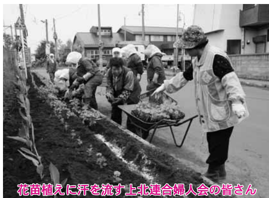
花苗植えに汗を流す上北連合婦人会の皆さん