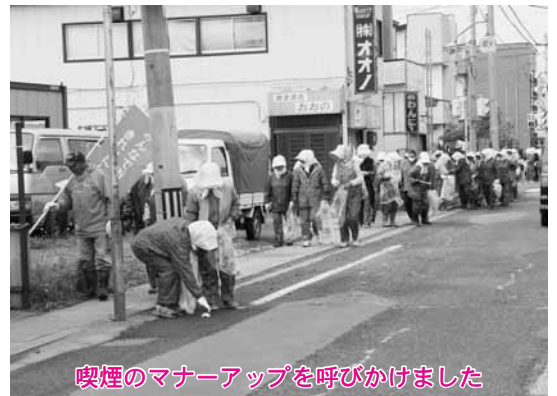
喫煙のマナーアップを呼びかけました