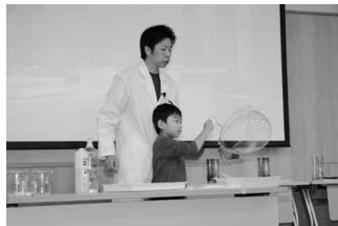
ハンガーを使ってシャボン玉ができるかな? 「石ちゃんの科学実験教室」