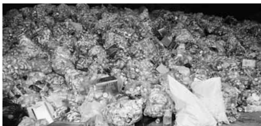
清掃センターに搬入された大量の空き缶

昨年は、作業員がスズメバチに刺される被害も出ていますので、ご面倒かとは思いますがご協力をお願いします。