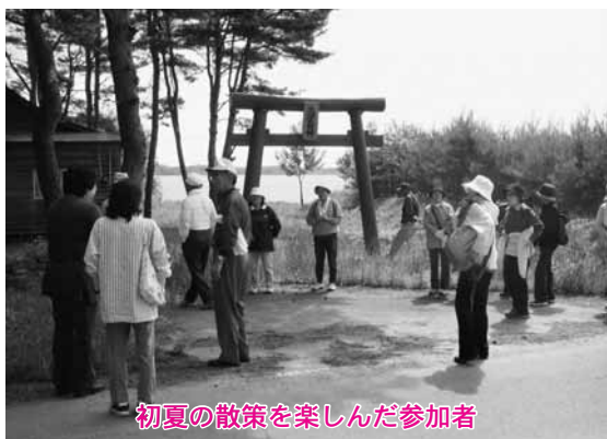
初夏の散策を楽しんだ参加者

今回のコースはわかさぎマラソンと同じだったこともあり、参加者はランナーの気分を味わいながら、心地よい汗を流していました。