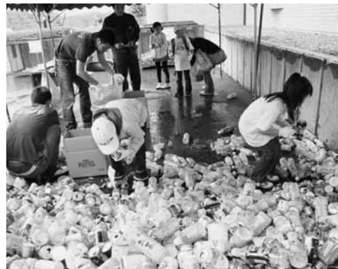
ごみを分別するとジュースなどと交換できる券をもらえるコーナー