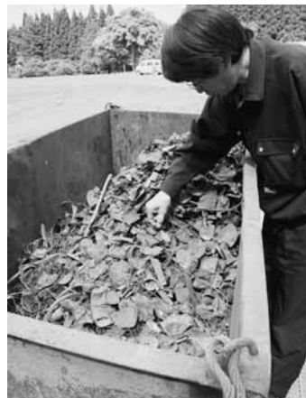
焼却炉から不燃物として排出された金属。その量は1週間で1トン以上に

排出される金属には、針金や調理用ラップのカッターなどといった小さなものから、空き缶や鉄パイプなどの大きなものまで、その量は1週間で1トン以上にも上ります。