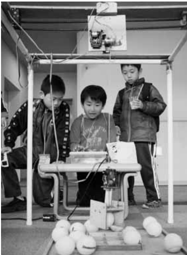
50を超える科学実験や遊びのコーナーが用意されました