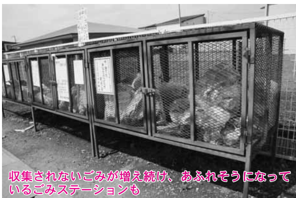
収集されないごみが増え続け、あふれそうになっているごみステーションも