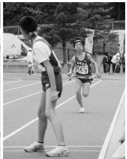
最後の力を振り絞る！男子水喰小野田頭北東選手