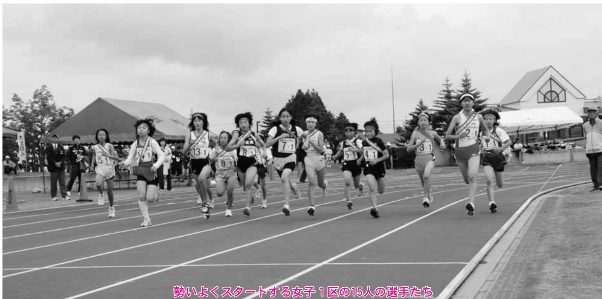
勢いよくスタートする女子1区の15人の選手たち