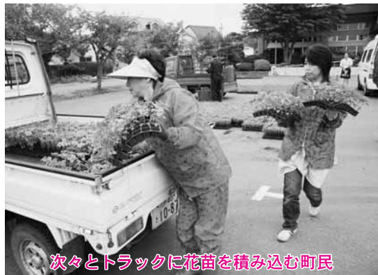
次々とトラックに花苗を積み込む町民