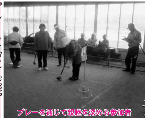
プレーを通じて親睦を深める参加者

出演したのは、ブルースやジャズ、ロックなど、町内外の愛好家たちで結成された10バンドで、客席に詰め掛けたバンド仲間らが盛んな拍手と声援を送っていました。