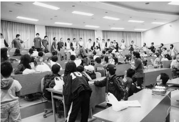
会場をぐるっと囲んで手をつないだスタッフ100人全員に電流は流れるか? 「サイエンスウルトラクイズ」は実験スタイルで実施