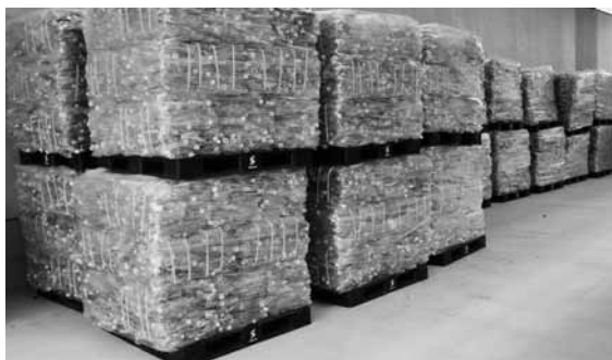
リサイクル原料に加工されたペットボトル

リサイクル率や作業効率アップのため、またリサイクル原料売却額を確保するためにも、分別が必要です。