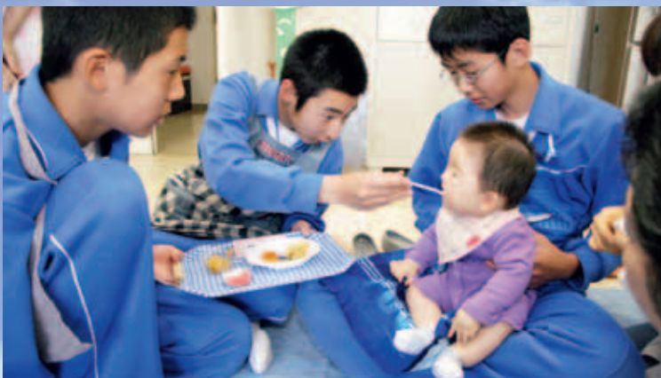
「ハイ、アーンしてー」ご飯を食べさせるのも意外と大変

その後、実際に赤ちゃんと遊んだり離乳食を食べさせたりして、育児の大変さや喜び、命の尊さを感じ取っていました。