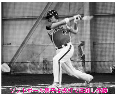
ソフトボール男子は投打で圧倒し優勝