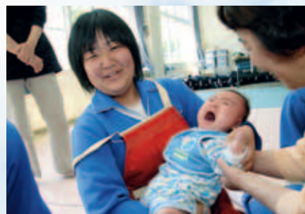
子育ての大変さを実感した1日でした