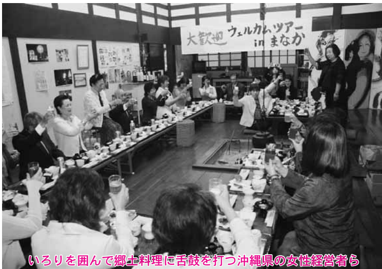
いろりを囲んで郷土料理に舌鼓を打つ沖縄県の女性経営者ら