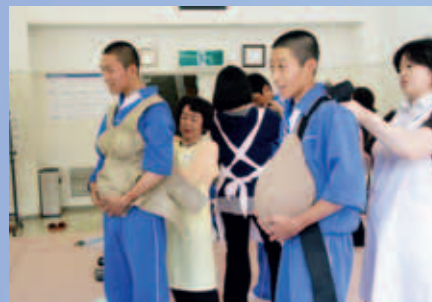
未来のパパたちも妊婦の大変さを体験