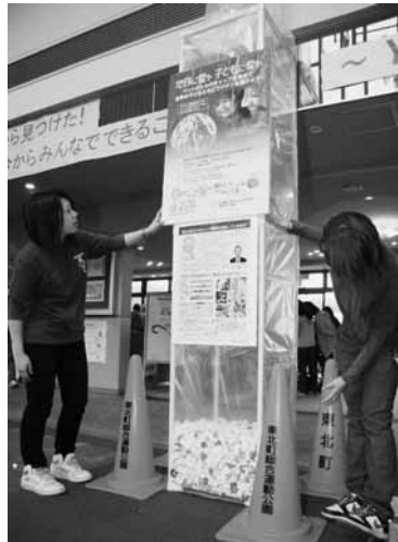
ペットボトルキャップ収集のために設置された巨大タワー