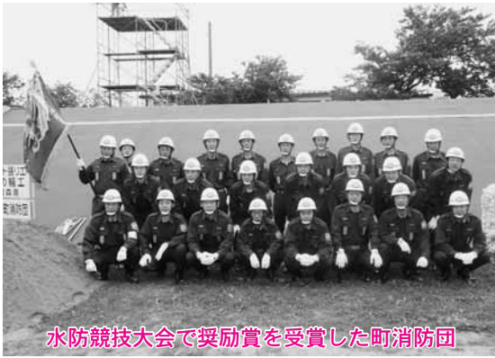
水防競技大会で奨励賞を受賞した町消防団

同大会には、東北6県の各代表6消防団が参加し、堤防の崩壊と透水防止のために堤防にシートを張る「シート張工」と、透水した堤防部分に半月状の土のうを積む「月の輪工」の2工法で、技術を競いました。