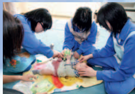
3人ががりでおむつ替えに挑戦