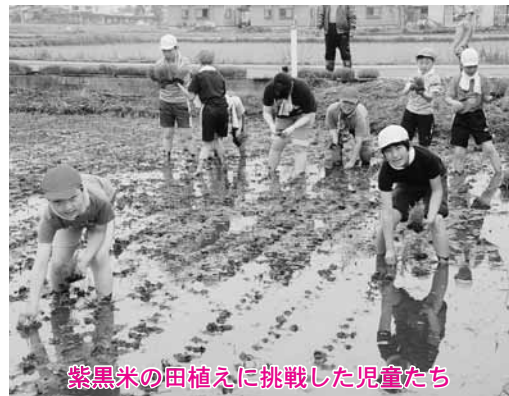
紫黒米の田植えに挑戦した児童たち