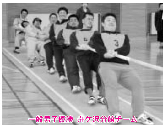
一般男子優勝 舟ヶ沢分館チーム

▽一般男子 舟ヶ沢分館 武者丸グール プ 長久保農場 敢闘賞 甲地分館C チーム特別賞 甲地分館B ▽一般女子 ナイトクイーンズ 舟ヶ沢分館 栄町レディース ▽小学生 舟ヶ沢分館A 舟ヶ沢分館C チーム滝沢平 敢闘賞 舟ヶ沢分館D