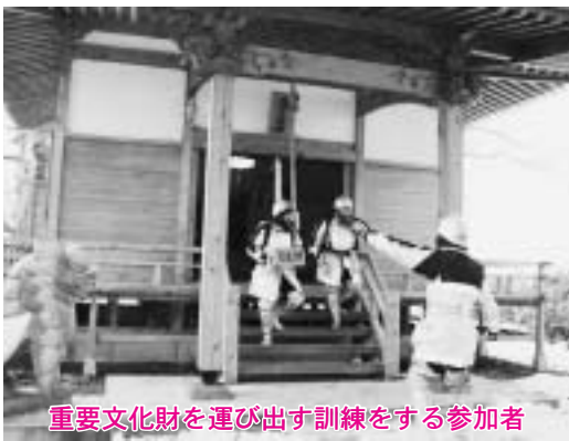
重要文化財を運び出す訓練をする参加者

文化財防火デーに合わせて行われたこの訓練は、貴重な文化財を保存していた建物で火災が発生したことを想定して実施。参加者が重要文化財を見立てた箱を屋外に運び出したり、消火器で消火を試みたりするなど、貴重な文化財を守る手順を再確認しました。