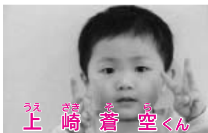
うえ 上 さき 崎 そ ら 蒼 空 くん