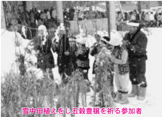
雪中田植えをし五穀豊穡を祈る参加者

参加者は繭玉作りや大浦神楽保存会のメンバーによる門打ちを楽しみながら交流。続いて、上北小学校の児童とお年寄りが、田んぼに見立てた雪の上に五穀のワラを植え込む雪中田植えを再現したほか、わかさぎ保育園の園児による「苗取り」の歌や踊りなどが披露されました。