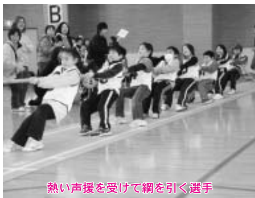
熱い声援を受けて綱を引く選手

第三回町民綱引き競技大会が二月十五日、北総合運動公園トレーニングセンターで行われ、分館や仲間同士で結成された、十六チーム、約百五十人の選手が、駆けつけた応援団の大きな声援を受けて熱戦を繰り広げました。 綱引きはパワーだけではなくスタミナも必要とされるスポーツ。一瞬で勝敗が決する試合もあれば、競技時間いっぱい三十秒間引き合う試合もあり、会場は一日中熱気に包まれていました。