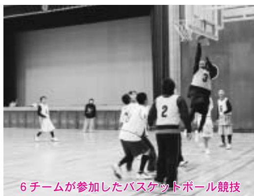
6チームが参加したバスケットボール競技

第一小 小川原 旭町 上野 栄町 南町 本町・乙供 新町 甲地 新山・蛭沢 船ヶ沢 千曳 清水目