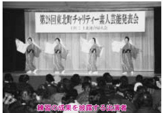
練習の成果を披露する出演者