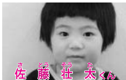
さ 佐 とう 藤 そう 壮 た 太 くん