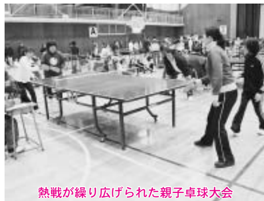
熱戦が繰り広げられた親子卓球大会