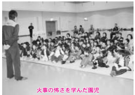
火事の怖さを学んだ園児

第三回町民バレーボール大会(九人制)が一月十八日、北総合運動公園トレーニングセンターで行われ、参加者が心地よい汗を流しながら親睦を深めました。冬期間の運動不足解消と健康増進のために開催された同大会には、五チームが参加。熱戦の末、ナインナインチームが二連覇を果たしました。上位の結果は次のとおりです。 ナインナイン やるよね〜 ぽぷらデライト