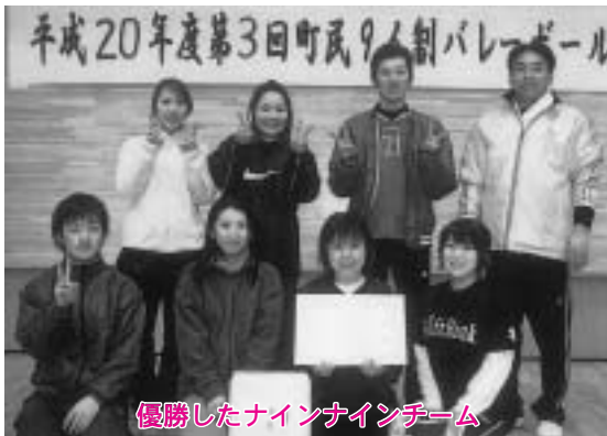
優勝したナインナインチーム

イベントの情報や身の回りで起きた出来事など、情報をお寄せください。 また、広報に関するご意見やご希望等がございましたら、匿名でも構いませんのでお待ちしております。 役場企画課 広報係 Tel.0176-56-3111またはTel.0175-63-2111 (内線234)