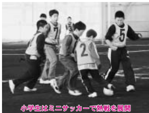
小学生はミニサッカーで熱戦を展開

▽バスケットボール男子 南町 上野 第一小・小川原 ▽バレーボール男子 上野 第一小 栄町・蛭沢 ▽バレーボール女子 第一小 小川原 南町・旭町 ▽卓球 栄町 小川原 上野・新山 ▽ミニサッカー 第一小 旭町 新山 ▽ポウリング 南町 舟ヶ沢 栄町