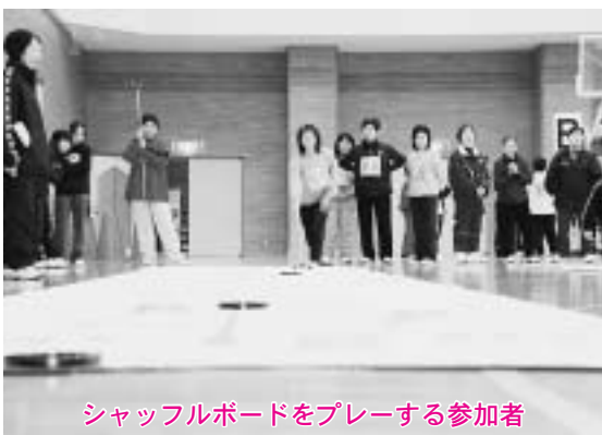
シャッフルボードをプレーする参加者