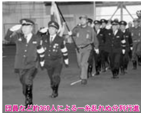
団員など約360人による一糸乱れぬ分列行進