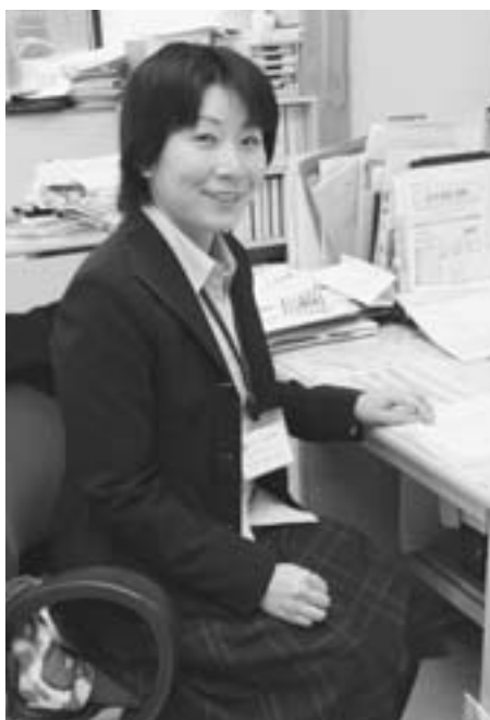
東北町保健衛生課

うつ病の治療は、まずゆっくり休ませることから。無理をさせず、相手の気持ちに寄り添いながら温かく見守りましょう。