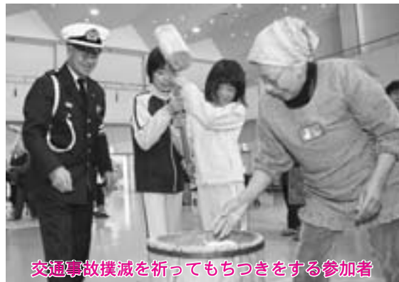
交通事故撲滅を祈ってもちつきをする参加者

また、読み聞かせの合間には、ハンカチ取りゲームなどの昔遊びやなぞなぞ遊びを取り入れ、子どもたちを楽しませました。