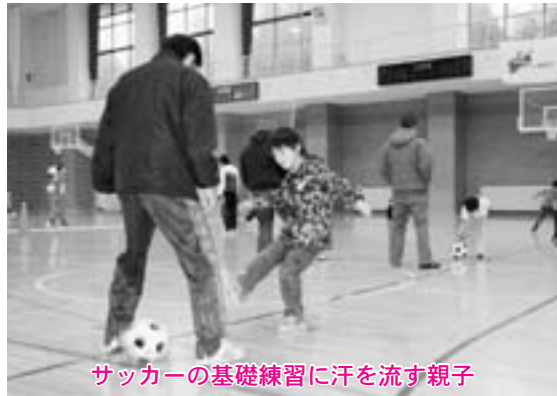
サッカーの基礎練習に汗を流す親子