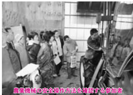
農業機械の安全操作方法を確認する参加者