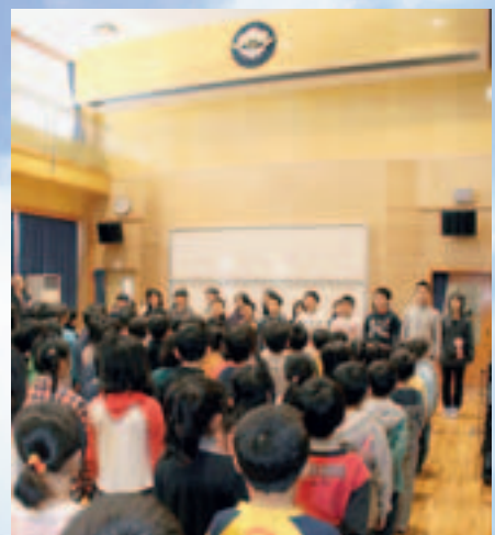
新校舎の目玉である、吹き抜けの多目的教室で行われた竣工式典