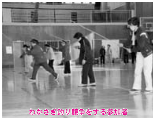
わかさぎ釣り競争をする参加者