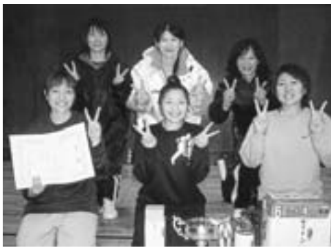
女子優勝、たんだかたん'08チーム