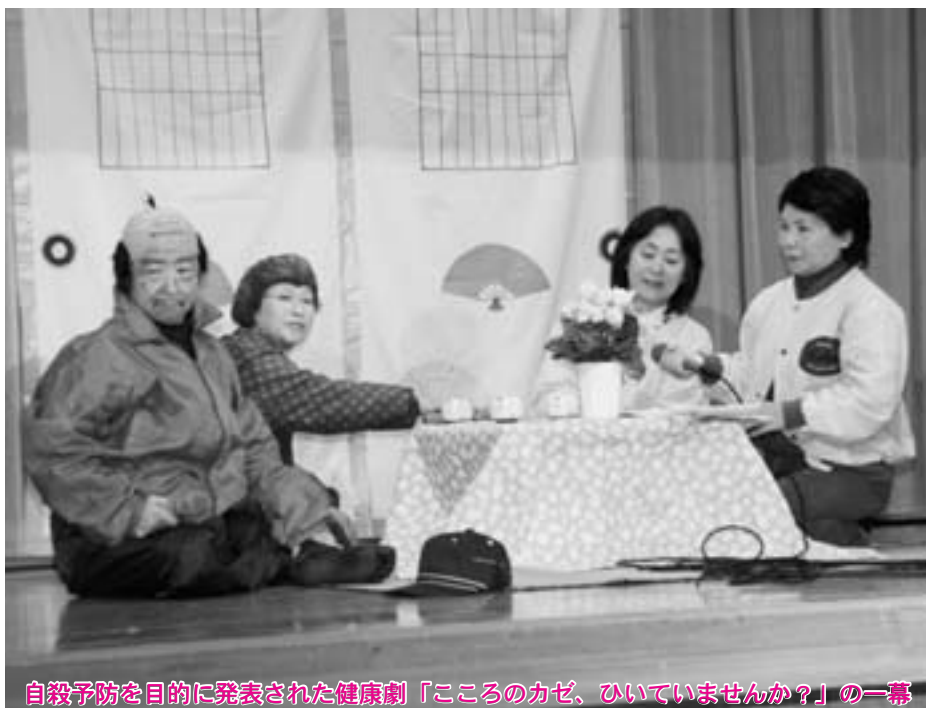
自殺予防を目的に発表された健康劇「こころのカゼ、ひいていませんか？」の一幕