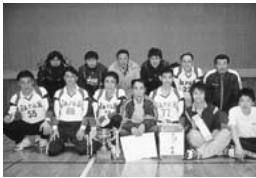
男子優勝、全日本チーム

18チームが熱戦を展開 ナイターバレーボール大会 第三回町ナイターバレーボール大会がこのほど行われ、十八チームが熱戦を展開しました。