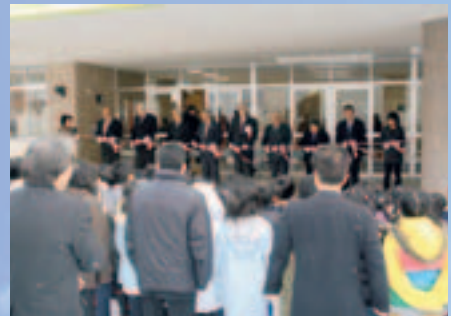
全校児童が見守る中、テープカット