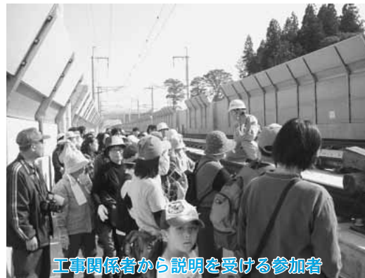
工事関係者から説明を受ける参加者

上北地区では役場本庁舎前で出発式が行われ、同地区の消防団員や六保育園の園児ら約百十人が参加。ハッピー保育園の園児が鼓笛を披露したあと、「火事のない町をつくります」と元気に防火の誓いをしました。続いて防火パレードが行われ、参加者全員が上北町駅までを約二十分かけて練り歩き、町民へ火災予防をPRしました。両地区ではパレード終了後、消防団員が消防車両へ分乗して、警鐘を鳴らしながら町内を巡回し、町民へ火の取り扱いに注意するよう呼びかけました。