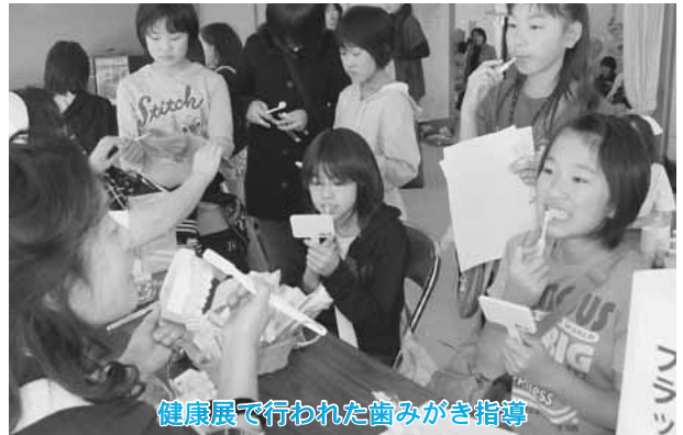
健康展で行われた歯みがき指導