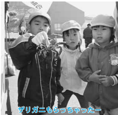
ザリガニもちっちゃったー