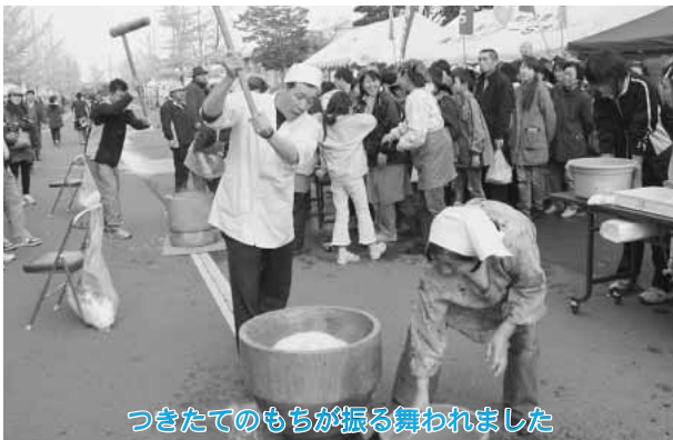
つきたてのもちが振る舞われました