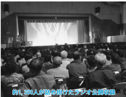
約1,300人が詰め掛けたラジオ公開収録

また収録では、小川原湖や温泉など東北町の情報が紹介され、来場者だけでなく、ラジオを通じて全国へ東北町がPRされました。