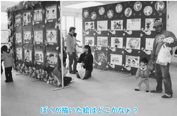
ぼくが描いた絵はどこかなあ？