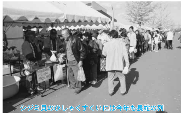
シジミ貝のひしゃくすくいには今年も長蛇の列