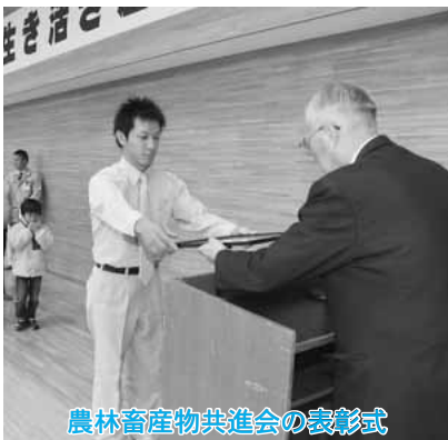
農林畜産物共進会の表彰式