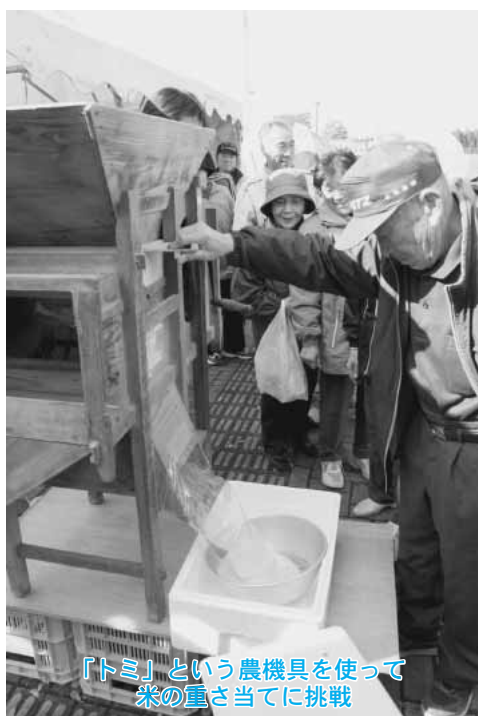
「トミミ」という農機具を使って 米の重さ当てに挑戦