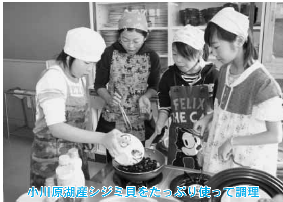
小川原湖産シジミ貝をたっぷり使って調理

上北小学校と蛸沢小学校ではこのほど、家庭科実習で小川原湖産のシジミ貝を使った料理に挑戦し、地元産の味覚を味わいました。