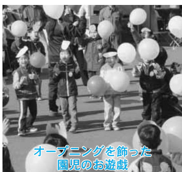
オープニングを飾った 園児のお遊戯

また、東北会場では、オープニングセレモニーや農林畜産物共進会が、上北会場では、健康展や茶道・華道展などが行われ、2日間にわたり大勢の来場者でにぎわいました。