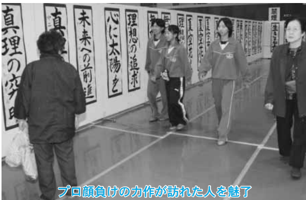
プロ顔負けの力作が訪れた人を魅了