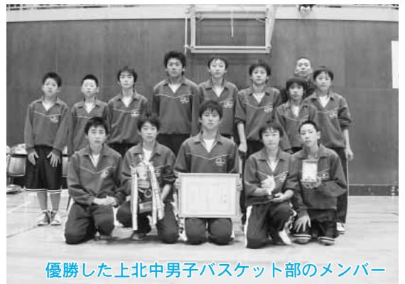
優勝した上北中男子バスケット部のメンバー