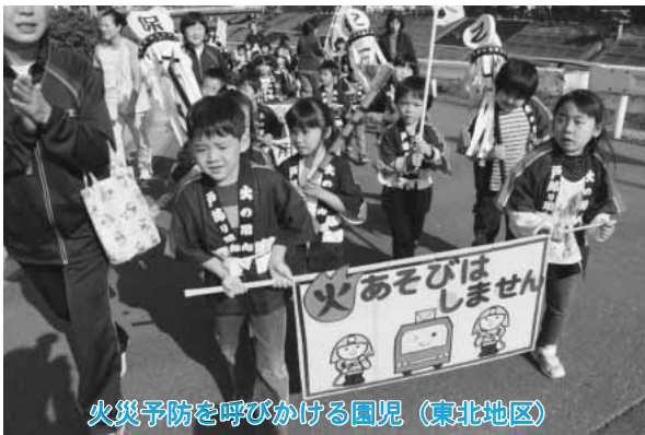
火災予防を呼びかける園児（東北地区）

秋の火災予防週間初日の十月二十日、東北・上北両地区で火災予防パレードが行われました。東北地区では館花地区で出発式が行われ、同地区の消防団員や八保育園の園児ら約百二十人が参加。園児が「絶対に火遊びをしません」などと、元気に防火を誓いました。続いて消防車両を先頭に、参加者全員で駅前通を約二十分かけてパレードし、町民へ火災予防を呼びかけました。