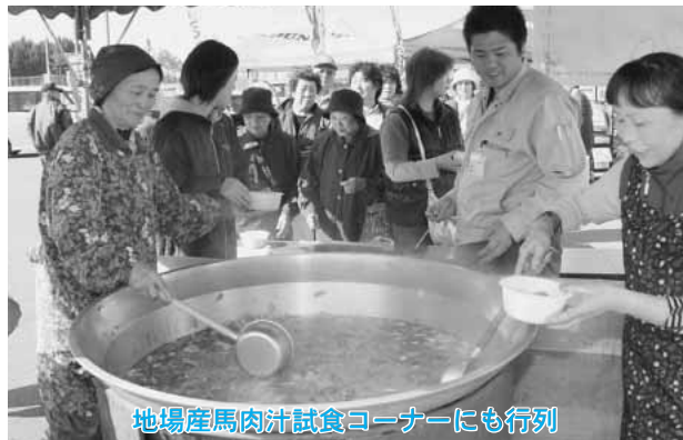
地場産馬肉汁試食コーナーにも行列