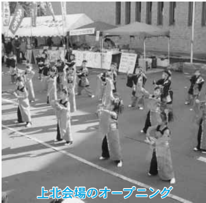
上北会場のオープニング