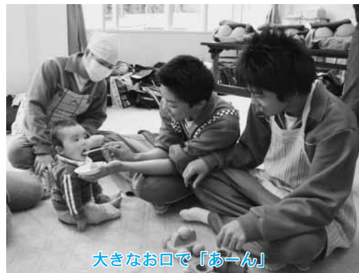
大きなお口で「あーん」