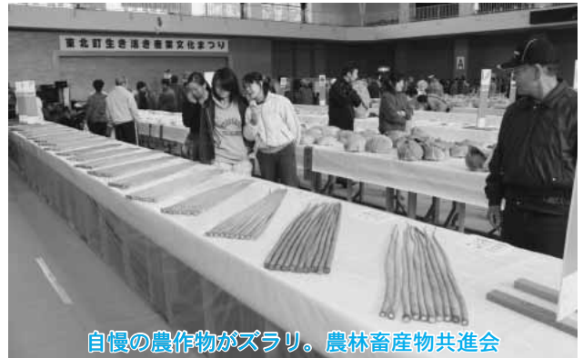
自慢の農作物がズラリ。農林畜産物共進会