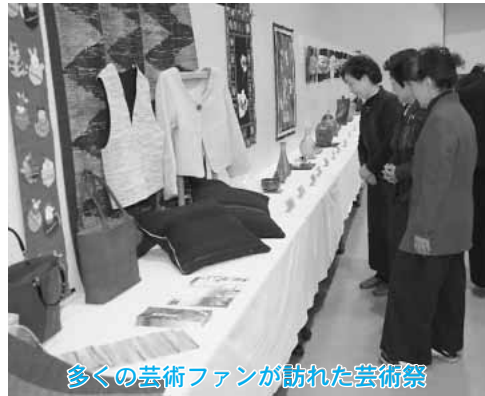
多くの芸術ファンが訪れた芸術祭