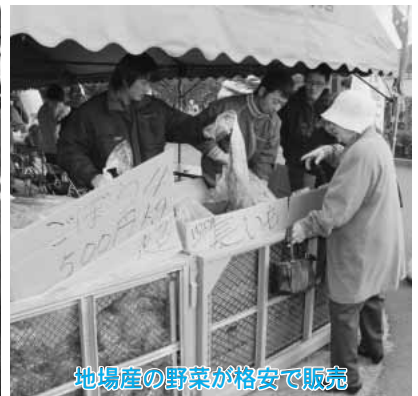
地場産の野菜が格安で販売