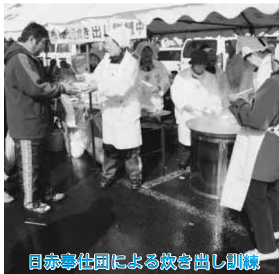
目赤奉仕団による炊き出し訓練