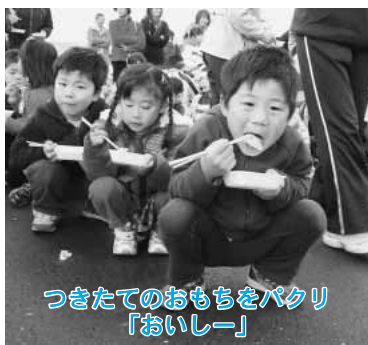
つきたてのおもちをパクリ 「おいしー」