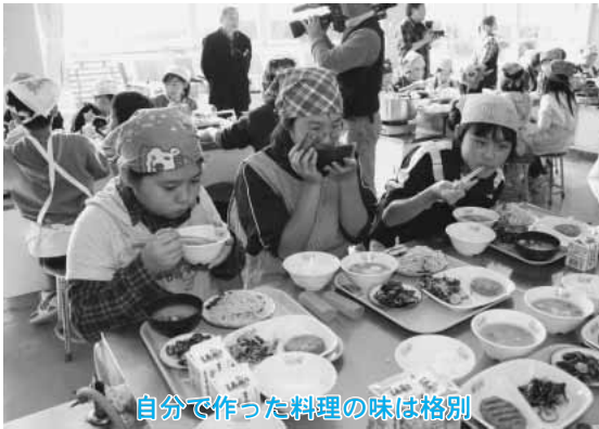
自分で作った料理の味は格別

調理後はみんなで試食。ほとんどの児童がシジミ汁しか味わったことがないということでしたが、初めて食べたシジミのスパゲティとバター炒めのおいしさに、全員大満足の様子でした。