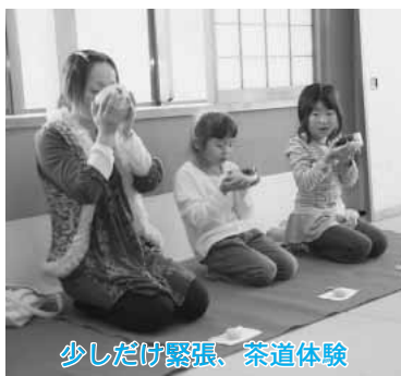
少しだけ緊張、茶道体験