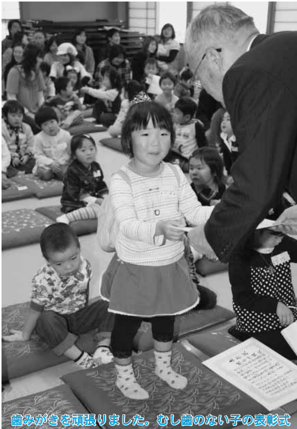
歯みがきを頑張りました。むし歯のない子の表彰式