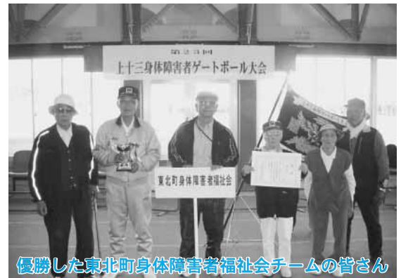
優勝した東北町身体障害者福祉会チームの皆さん