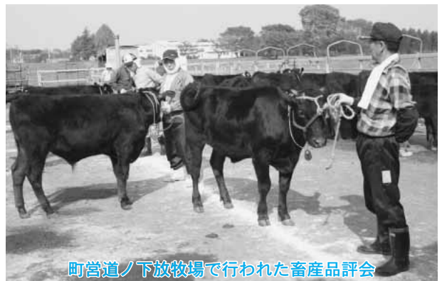
町営道ノ下放牧場で行われた畜産品評会