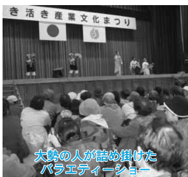
大勢の人が詰め掛けた バラエティーショー