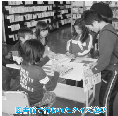
図書館で行われたクイズ遊び