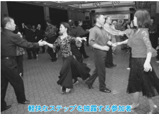
軽快なステップを披露する参加者