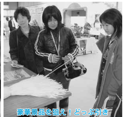
豪華景品を狙え！どっぶ引き