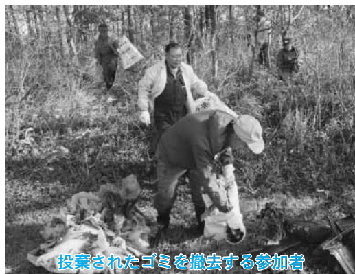
投棄されたゴミを撤去する参加者

この体験は、思春期の生徒の母性や父性、思いやりの心を養うために開催したもので、人見知りをして泣き出す赤ちゃんに戸惑いながらも、おもちゃを使って一緒に遊んだり、離乳食をあげたりしながら交流しました。またお母さんに出産の喜びや苦労話を質問し、子育ての大変さを感じ取っていました。