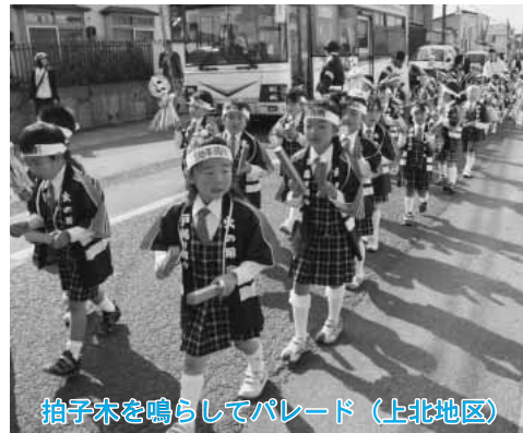
拍子木を鳴らしてパレード（上北地区）

上北地区では役場本庁舎前で出発式が行われ、同地区の消防団員や六保育園の園児ら約百十人が参加。ハッピー保育園の園児が鼓笛を披露したあと、「火事のない町をつくります」と元気に防火の誓いをしました。続いて防火パレードが行われ、参加者全員が上北町駅までを約二十分かけて練り歩き、町民へ火災予防をPRしました。両地区ではパレード終了後、消防団員が消防車両へ分乗して、警鐘を鳴らしながら町内を巡回し、町民へ火の取り扱いに注意するよう呼びかけました。