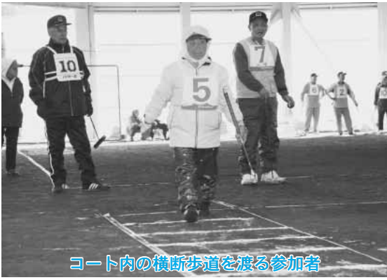
コート内の横断歩道を渡る参加者

この大会は十一月の「いきいきシルバー交通安全強調月間」に合わせて開催したもので、第一ゲートを通過させた参加者が、コート内に設けられた横断歩道を左右確認してから渡るなどして、交通ルールを再確認していました。