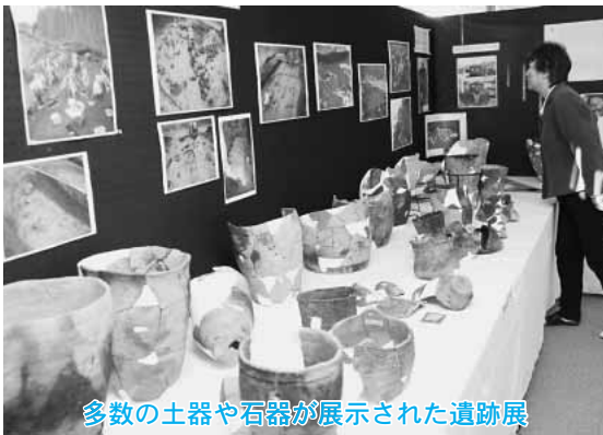
多数の土器や石器が展示された遺跡展

館内に展示された出土品は、縄文時代と平安時代のもので、模様のつけ方や用途などを分かりやすく解説。また、火山灰などが積もった住居跡の土層を接着剤ではがした模型も展示され、訪れた人は、日の本中央伝承の元になった都母の民の生活に触れながら、古代のロマンに思いをはせていました。