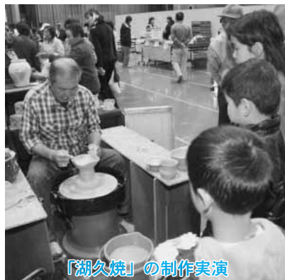
「湖久焼」の制作実演