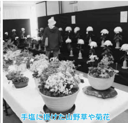
手塩に掛けた山野草や菊花