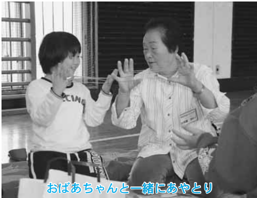
おばあちゃんと一緒にあやとり

また、昔遊びのあとにはお年寄りからなべっこ団子が振る舞われ、みんなでおいしくいただきました。