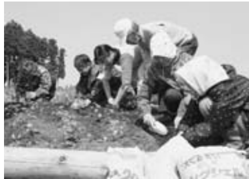
町内のいたるところが花で彩られました

各町内や職場などを花でできいにしてもらおうと、町社会教育課が町内八十六の団体などに、マリーゴールドやサルビアの苗約十八万本を配布しました。