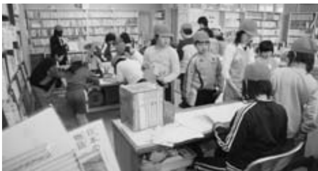
図書の貸し借りは児童会図書委員が担当。左奥は図書カード記入用デスク