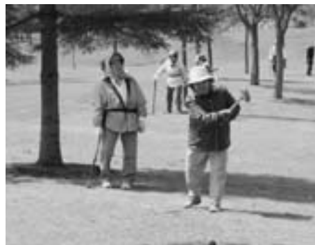
グラウンドゴルフを楽しむ参加者

第三回東北町グラウンドゴルフ大会が五月十八日、北総合運動公園グラウンドゴルフ場で行われ、百三十五人の参加者が熱戦を展開しました。大会は町グラウンドゴルフ協会の部と一般の部に分かれて行われ、参加者は競技を通して親睦を深めていました。