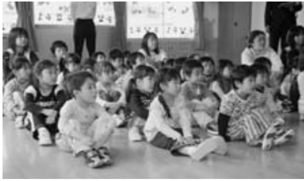
お話を聞く表情は真剣そのもの