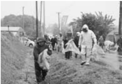
ゴミを拾い集める参加者

この活動は六月一日の「たばこの日」に合わせ、たばこのイメージアップを兼ねて町内の清掃奉仕活動を行ったもので、参加者は三班に分かれ、町民文化センターから新山地区までの歩道などに落ちていたたばこの吸殻や空き缶などを拾い集めながら、たばこやゴミのポイ捨てをやめるよう町民に呼びかけていました。