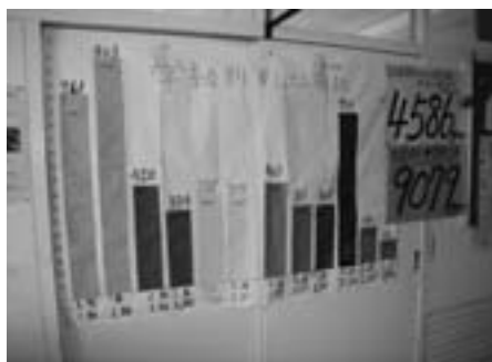
上北小図書委員が作成した 学級別貸し出し冊数グラフ

このような活動により、本の貸出冊数はこれまでの倍以上に増え、学校全体では年間六千冊以上、児童一人当たりの平均では十五冊を超えました。