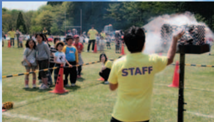
「火に小麦粉をかけたらどうなるでしょうか？」 サイエンスウルトラクイズは実験で正解を発表

「考えよう!地球について『びっくりエコ大作戦』」をテーマに開催されたこのイベントは、県内の高校生や大学生がスタッフとして参加。50を超える工作や科学の体験コーナーで子どもたちへ手ほどきしました。