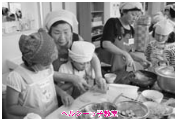
ヘルシーっ子教室

ヘルスマイトの長年の活動により、東北町の塩分の摂取状況や児童の朝食欠食率は、県下でもそれほど高くありません。