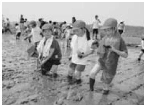
歓声をあげて田植えをする児童