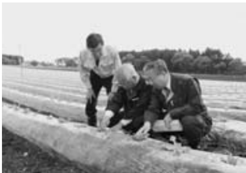
ひょう害を受けた葉タバコを調査する関係者

五月二十六日午前十一時過ぎに降ったひょうによる影響で、菩提寺地区の葉タバコが被害を受けました。 これにより、同地区約二十五％の作付面積のうち、約四割の葉タバコの葉に、穴が空いたりちぎれたりなどの被害がありました。 これを受けて五月二十七日、県たばこ耕作組合や県の職員らが現地調査を実施したほか、五月二十九日には、今後の対策等話し合う座談会が菩提寺地区集会所で開かれました。