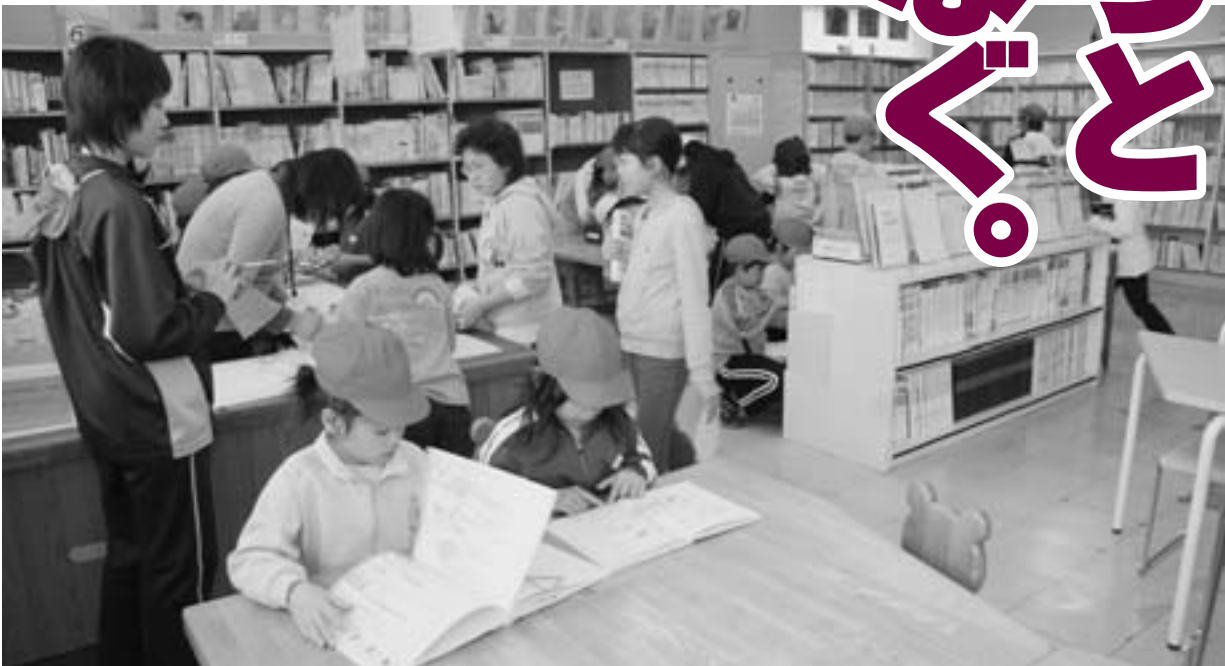
昼休みの上北小学校図書館の様子。環境の改善により、毎日大勢の児童が訪れます。

これは「学力向上アクションプラン」に掲げている「子ども読書推進事業」の取り組みのひとつで、児童への読書の習慣づけと、確かな学力の定着が期待されています。児童と本をつなぐための大切な役割を担う「学校司書」及び「学校司書補」そして「学校図書館」の活動を紹介します。