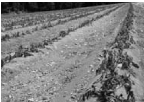
霜害により葉が黒く枯れたバレイシヨ

五月十二日未明の冷え込みによる影響で、東北地区のバレイシヨが霜の被害に見舞われました。 同日の朝は気温が零度近くまで冷え込み、同地区約八十％の作付面積のうち約六割のバレイシヨに、茎の生長点（頂芽）や葉が枯死するなどの被害がありました。 これを受け、県上北地域県民局地域農林水産部と農協、町の職員が五月二十二日、霜害の現地調査を実施。各農家へ今後の対応を指示しました。