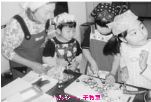
ヘルシーっ子教室

そんなとき“生きた知恵”を貸してくれる人、それが「食生活改善推進員（ヘルスマイト）」で、全国で約21万人が活動しています。