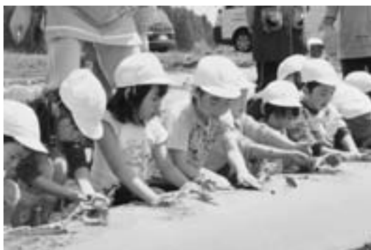
サツマイモの苗に土をかぶせる園児