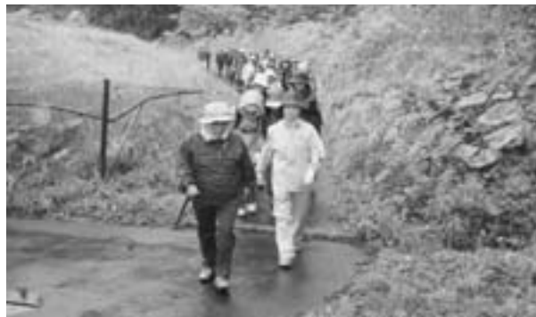
新緑の中を散策する参加者

町中央公民館の主催による第一回探訪ウォークが六月三日、野辺地町で行われ、参加した三十五人の町民が初夏の散策を楽しみ、心地よい汗を流していました。