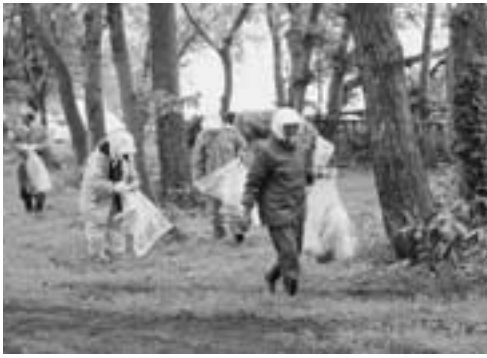
ゴミ袋を片手に湖畔を歩く参加者

また国土交通省高瀬川河川事務所の職員も応援に駆けつけ、ゴミ袋や軍手などを配って活動に感謝していました。