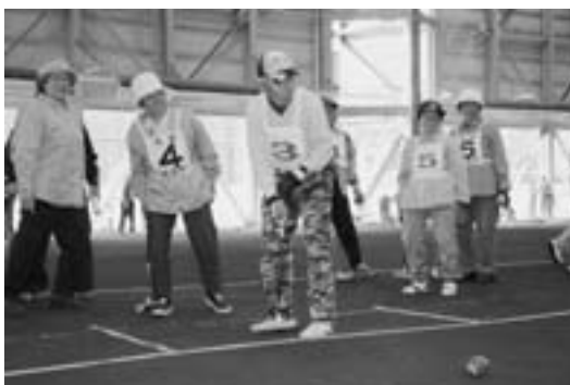
ゲートボールをプレーする参加者