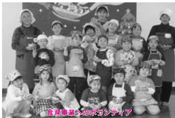
食育事業へのボランティア