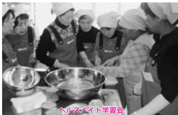
ヘルスマイト学習会

東北町ヘルスマイトは、子ども向けの食育教室から介護予防教室まで、ボランティアで幅広く活躍しています。