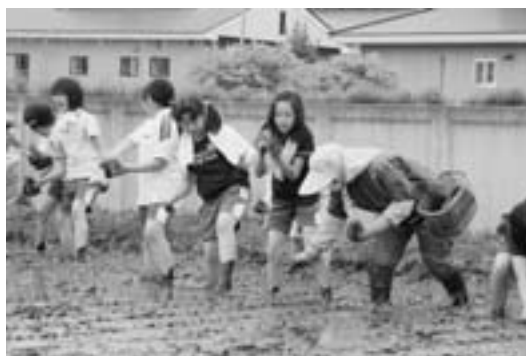
手足を真っ黒にして苗を植える児童