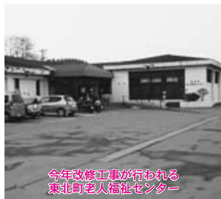
今年改修工事が行われる東北町老人福祉センター

超少子高齢化社会が到来する中、すべての町民が住み慣れた地域で、支え合い助け合いながら健康で元気に暮らせるよう、地域福祉体制づくりが重要となつてきております。