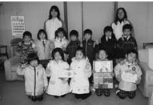
プレゼントを届けたハッピー保育園園児

ハッピー保育園の園児は十一月二十二日、「勤労感謝の日」にちなんで、竹内町長へプレゼントを届けました。