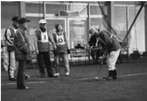
熱戦が展開されたゲートボール大会

第一回町長杯争奪ゲートボール大会が十二月七日、ふれあいドーム上北で行われました。大会は、町内外から参加した十八チーム約百二十名の参加者が、四ブロックに分かれて熱戦を展開。ナイスプレーにはお互いに声援を送りながら、選手同士の親睦を深めていました。