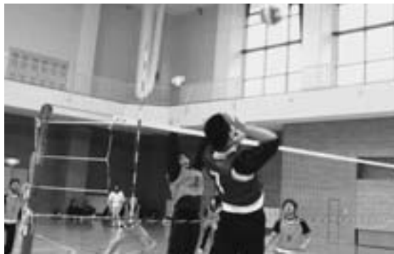
アタック!! ブロック!!

第二回B&G杯争奪バレーボール大会が十一月十八日、北総合運動公園総合トレーニングセンターで開催され、参加した男子七チーム、女子五チームが、トーナメント戦での熱い戦いを繰り広げました。