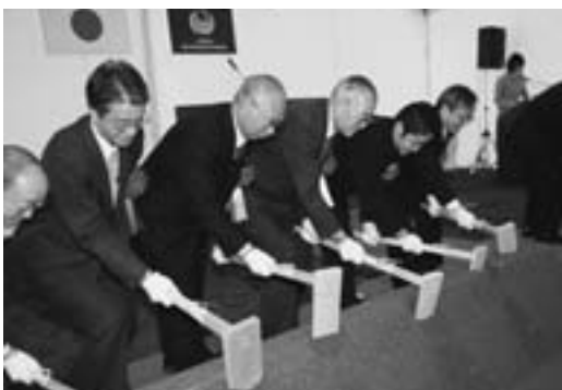
早期完成を願ってくわ入れ

この「上北道路」は青森市と八戸市を結ぶ高規格道路の空白区域の一部で、七・六六キの自動車専用道路。平成二十年代半ばの完成をめざしており、虫神地区に上北インターチェンジ（仮称）ができる予定となっております。