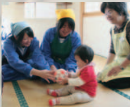
ボール遊びでふれあう「未来のママ」

生徒たちは、人形を使って赤ちゃんへの接し方などを学んだあと、本物の赤ちゃんとご対面。泣き出したり離乳食を食べてくれなかったりと、人形のように思い通りにいかない赤ちゃんに悪戦苦闘しながらも、育児の難しさや大変さを学んでいました。