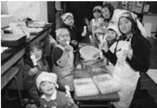
団子も上手にできたよー

参加した約三十名の児童と保護者は、協力し合いながら楽しく作業し、完成したうどんと団子は、囲炉裏を囲んでみんなでおいしくいただきました。