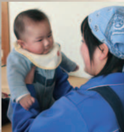
赤ちゃんのかわいさに 生徒もついつい笑顔に