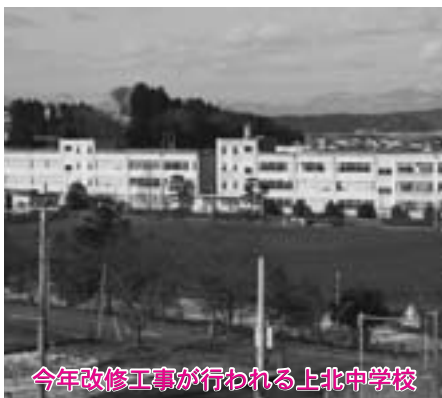
今年改修工事が行われる上北中学校

また、町内各小中学校の校舎の老朽化が進んでいることから、昨年、甲地小学校の改築工事に着手しており、さらに今年は、上北中学校の大規模な改修工事を行うなど、子どもたちが安心して学べる環境づくりを進めて参ります。