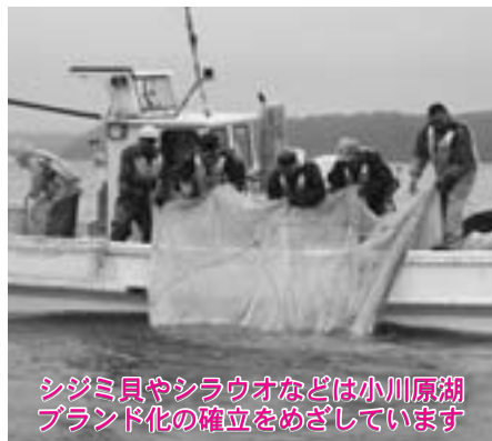
シジミ貝やシラウオなどは小川原湖ブランド化の確立をめざしています

わが町の基幹産業は、豊かな自然の恵みを生かした第一次産業であります。その全国に誇れる安全・安心の食料供給基地は極めて厳しい状況にあります。今こそ地域の知恵と英知を結集して、その商工、農水産業等の振興策に取り組んで参ります。