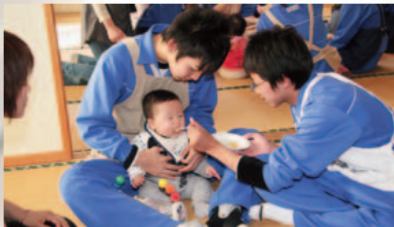
赤ちゃんに離乳食をあげる「未来のパパ」