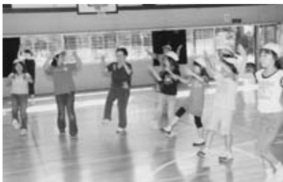
ナニヤドヤラを踊るいきいき教室学級生と児童

先生役となった高齢者の皆さんは、ナニヤドヤラの手の振り方や足の運び方などを児童へ教えたあと、実際に全員で輪踊りに挑戦。最初は全く踊ることのできなかつた児童も、曲に合わせて軽快に体を動かし、心地よい汗を流していました。