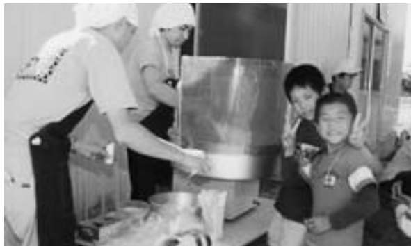
模擬店で楽しむ園児