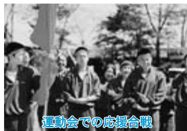
運動会での応援合戦

将来生徒がそれぞれの夢に向かい、自己実現を図る礎となる中学校3年間にしたいと思っています。そのためにも、保護者や地域の方々の学校に対する願いを受けとめ、教育活動を進めていく所存です。