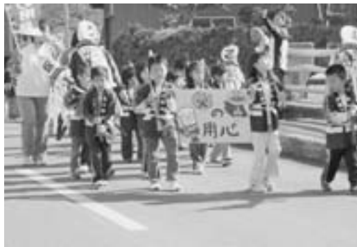
園児らがプラカードや旗を手にパレード

東北地区では、同地区の消防団員や八保育園の園児ら約百五十名が参加。館花通りで行われたセレモニーでは、園児全員で元気に防火の誓いをしました。 防火パレードは、参加者全員が約二十分かけて駅前の商店街を練り歩き、町民へ火災予防を呼びかけました。 パレード終了後、東北消防署の皆さんによる消防車と救急車の展示・説明が行われると、園児は実際に車両に乗り込んだり機器に触れたりして、緊急車両の大切さを学んでいました。