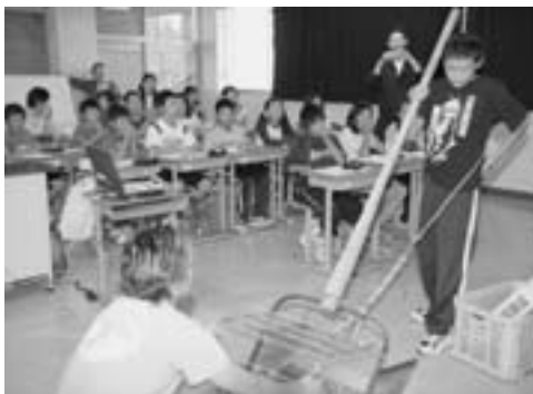
「ジョレン」の体験をする児童

この日は、八戸水産事務所の職員の方から小川原湖の水質や生態系などについて説明を受け、たあと、地元の漁師さんから、しじみ貝を採る「ジョレン」の体験をさせてもらうなど、小川原湖の生物や、漁業について理解を深めていました。