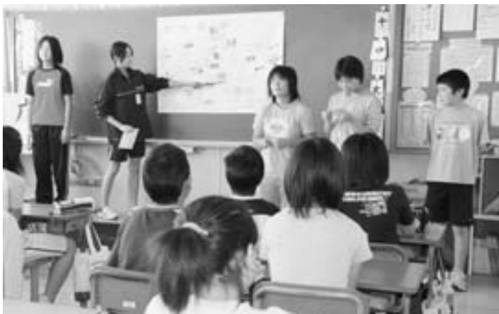
安全マップの説明をする6年2組の児童

これは、子ども自身が危険を予測し回避する能力を高めることを目的とした「青森県子ども安全スキルアップ事業」に、同校がモデル校として指定されたことを受けて行ったものです。