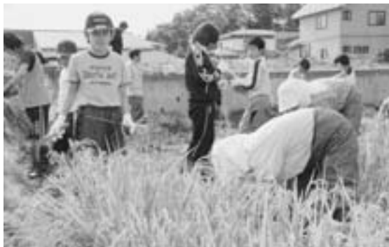
稲の刈り取り作業を行う児童

児童たちは今後、モチつき会を開催し、これまで観察してきた紫黒米の成長過程を発表することになっています。