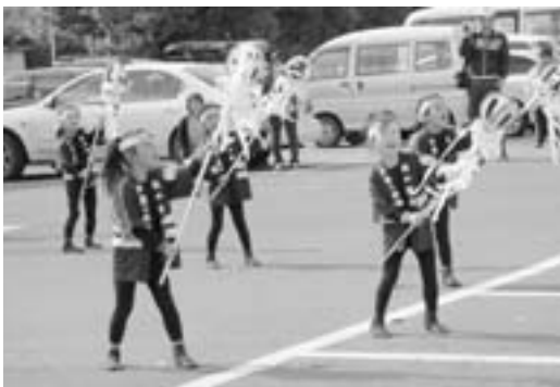
華やかなまとい振りを披露する小川原保育園園児

パレードは、参加者全員が上北町駅までを約二十分かけて歩き、町民へ防火をPRしました。