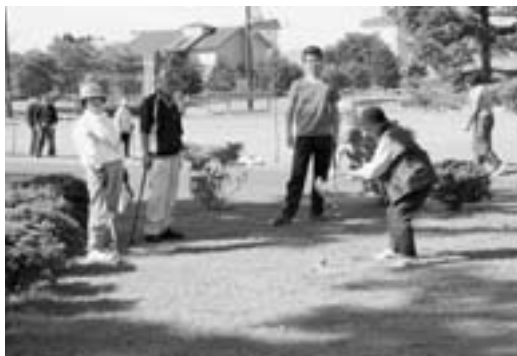
グラウンドゴルフ競技