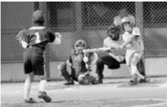
決勝戦 東北第一スポ少 対 上北小ソフトスポ少