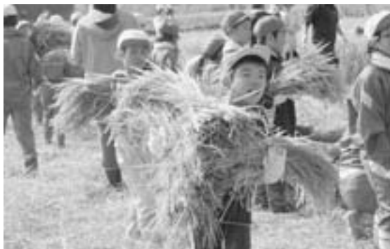
束ねた稲を運ぶ児童

刈り取った稲は脱穀・乾燥し、十二月の収穫祭でモチつきをして、収穫の喜びを味わうことにしています。