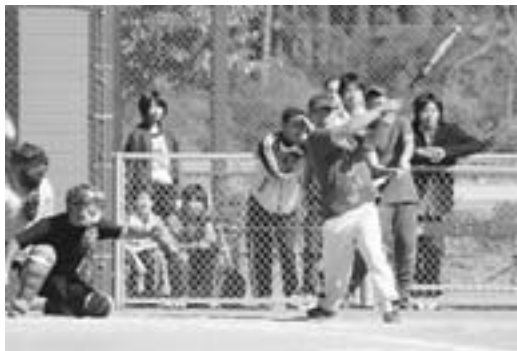
壮年男子ソフトボール競技