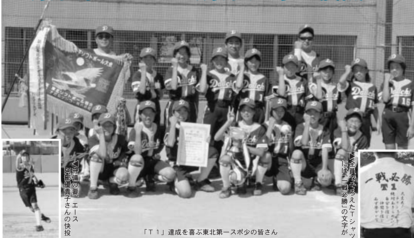
「T1」達成を喜ぶ東北第一スポ少の皆さん