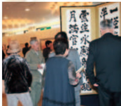
約200点の作品が芸術ファンを魅了