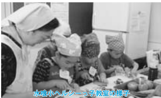
水喰小ヘルシーっ子教室の様子