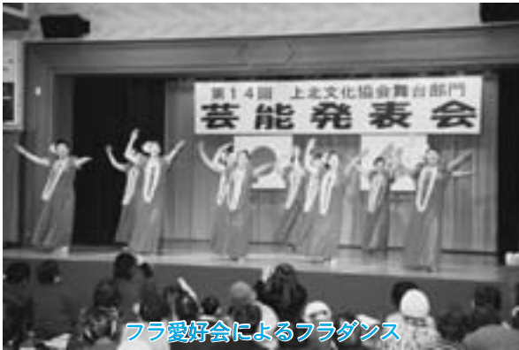
フラ愛好会によるフラダンス