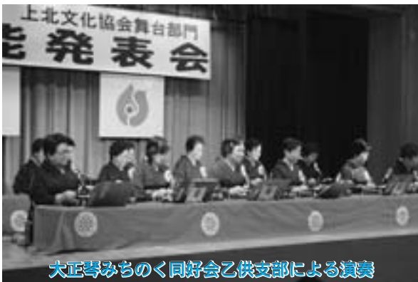
大正琴みちのく同好会乙供支部による演奏