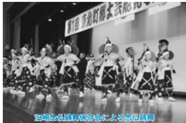
酒崎念仏舞保存会による念仏舞