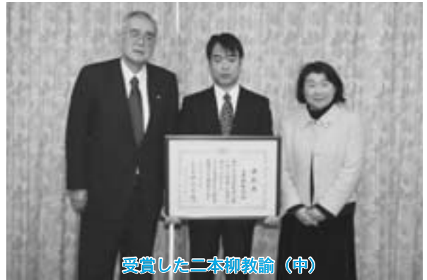
受賞した二本柳教諭 (中)