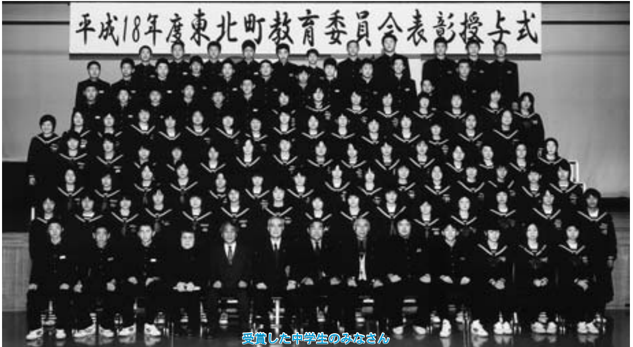
受賞した中学生のみなさん