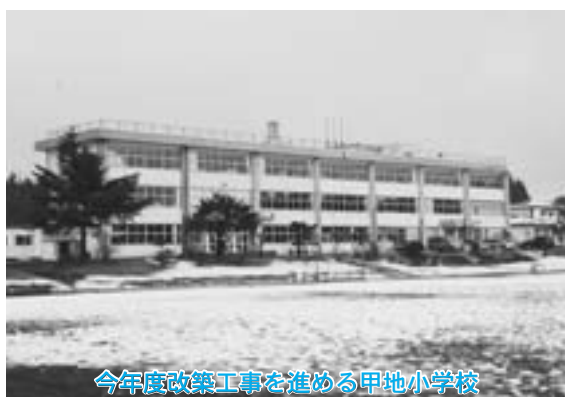
今年度改築工事を進める甲地小学校