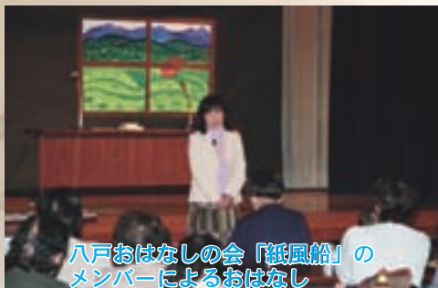
八戸おはなしの会「紙風船」の メンバーによるおはなし