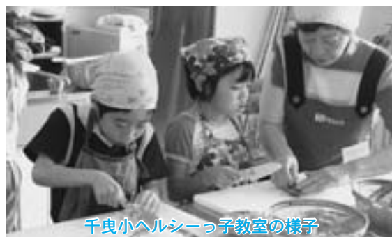
千曳小ヘルシーっ子教室の様子