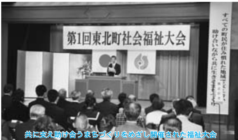
共に支え助け合うまちづくりをめざし開催された福祉大会