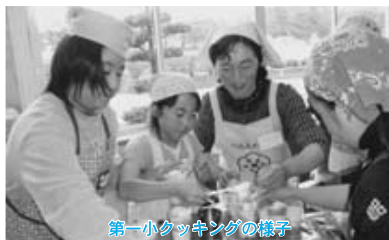
第一小クッキングの様子

「食育」は改まって取り組むのではなく、毎日の食卓から自然に身に付いていくものです。「何」をどのように食べて育つかは、勉強や遊び、運動をするのと同じように子供の成長に関わるとても重要な事です。そして家族そろっての食事は貴重なコミュニケーションの場になり子供の心の栄養源にもなっているのではないのでしょうか。