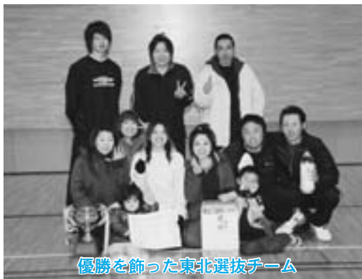
優勝を飾った東北選抜チーム

第一回東北町バレーボールナイターリーグ冬季大会が一月三十一日から三月十四日まで、北総合運動公園トレーニングセンターで行われました。 大会は、十チームが参加してのリーグ戦で熱戦が繰り広げられ、その結果、東北選抜がみごと優勝を飾りました。