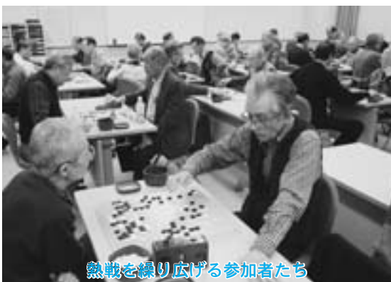
熱戦を繰り広げる参加者たち

第九回白魚・蛭・長芋・牛乳県下囲碁大会が二月二十七日・二十八日、一泊二日の日程で(株)青森原燃テクノロジーズセンターを会場に行われました。大会には、県内の有段者六十二人が参加し、A級(六段以上)、B級(五段以下)に分かれて熱戦を繰り広げました。会場での食事や入賞者への賞品として、町の特産品である長芋、しじみ、わかさぎ、牛乳などが用意され、参加者に変喜ばれていました。