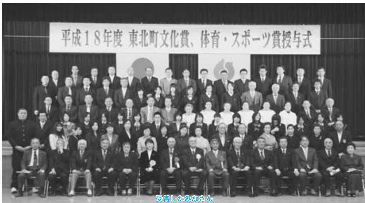
受賞したみなさん

平成十八年度東北町文化賞、 体育・スポーツ賞授与式が二月 二十四日、コミュニティセンター で開かれ、文化やスポーツの分 野で活躍した八団体・百三十一 名が授与されました。 なお、受賞者の方々は次のと おりです。 (敬称略)