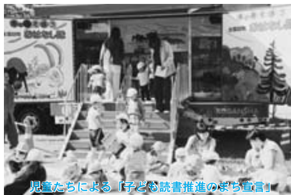
児童たちによる「子ども読書推進のまち宣言」