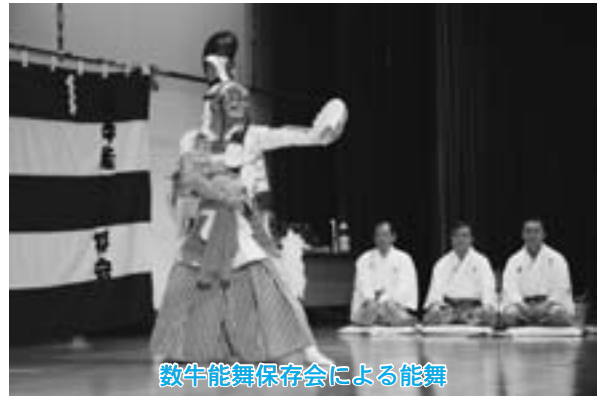
数牛能舞保存会による能舞

東北町文化協会上北支部主催の、第十四回舞台部門芸能発表会が三月十一日、町民文化センターで開かれ、約四百人の観客が様々な舞台を楽しみました。発表会には、上北・東北両支部から、十七団体約百四十五人が参加。舞台では、日頃練習している詩吟や踊り、歌や楽器の演奏など三十のプログラムが披露され、集まった観客からは大きな拍手が送られていました。