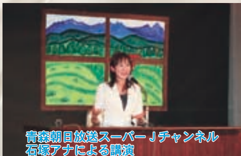
青森朝日放送スーパーJチャンネル 石塚アナによる講演