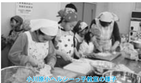
小川原小ヘルシーっ子教室の様子

町でも保育園(所)、学校をはじめ様々な所で個性を生かしたすばらしい取り組みを実施している所がいくつもあります。