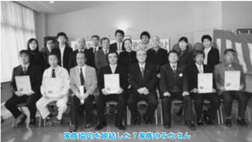
家族協定を締結した7家族のみなさん

農業を魅力ある職場にするため、休日や労働報酬、労働時間等についてルールを決める、家族経営協定調印式が三月二日、青森原燃テクノロジーズセンターで開かれ、七家族が家族経営協定を締結し、調印しました。