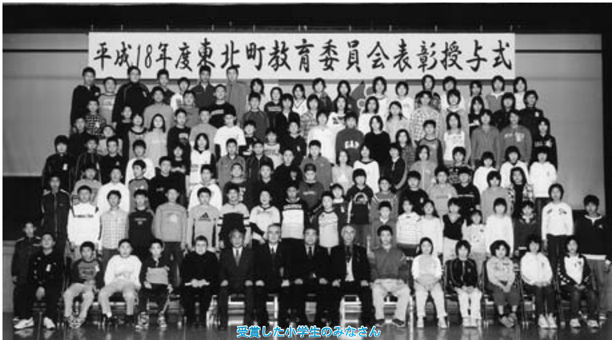
受賞した小学生のみなさん