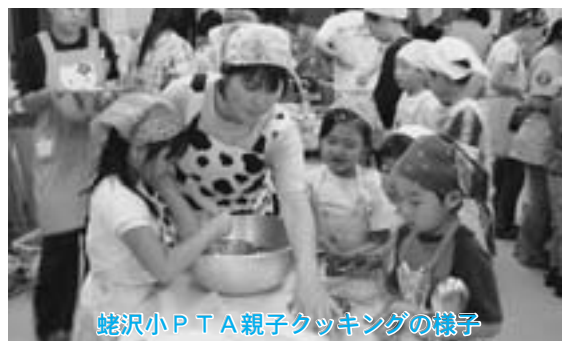
姥沢小PTA親子クッキングの様子

町では食育を推進するための様々な事業を平成19年も実施する予定です。興味のある方は是非ご参加、また保健センターまでお問い合わせ下さい。