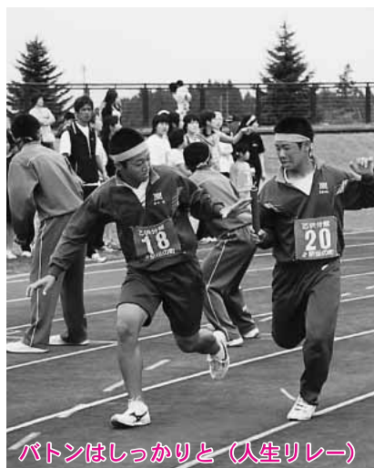
バトンはしっかりと（人生リレー）