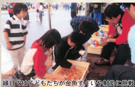
縁日では子どもたちが金魚すくいや射的に挑戦