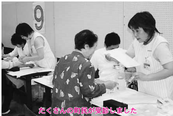
たくさんの町民が受診しました

町民の健康を願い 日曜いたわり健診 七月二日、コミュニティセンターで「日曜いたわり健診」が実施されました。 これは受診率アップと病気の早期発見、早期治療を図ろうと平成九年から行われていました。 平日の健診を受診できない方が早朝から足を運び、健康でありたい町民の願いにこたえていました。 健診を受けたから安心しないで、ふだんの生活の中でも健康に気をつけ、自己管理に努めましょう。