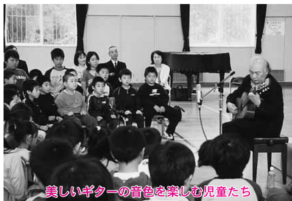
美しいギターの色を楽しむ児童たち

は、役場や保育園、道の駅など八か所。そのうち二十二人の生徒が訪問した蓼内久保(一)遺跡では、遺跡発掘作業に挑戦。スコップと一輪車を使って土を取り除いて約六千年前の地形を出す作業を行ったほか、移植ベラを使って土を削り出す作業を体験。土器などの遺物を確認しながら慎重に細かな作業に取り組んでいました。