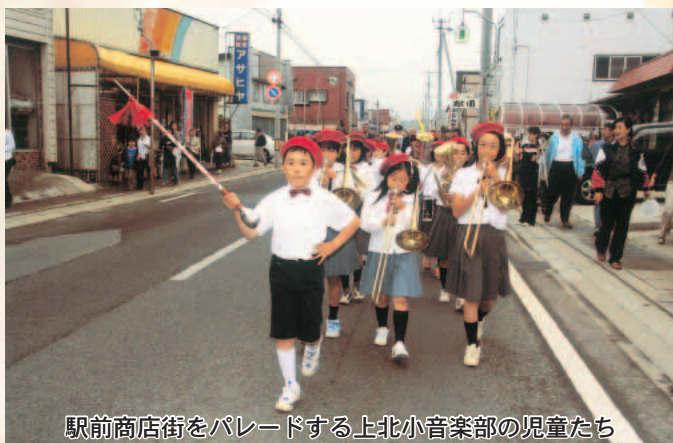
駅前商店街をパレードする上北小音楽部の児童たち

夏恒例の「かみきた夏まつり」が7月1日と2日、上北町駅前イベント広場を主会場に開催されました。