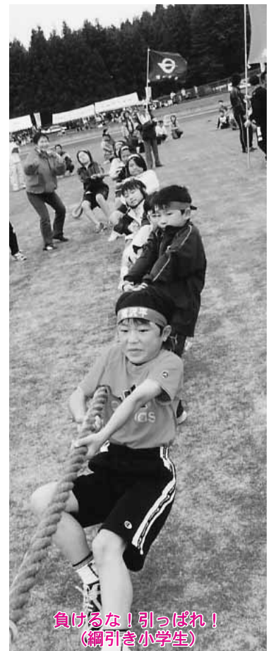
負けるな！引っぱれ！ （綱引き小学生）