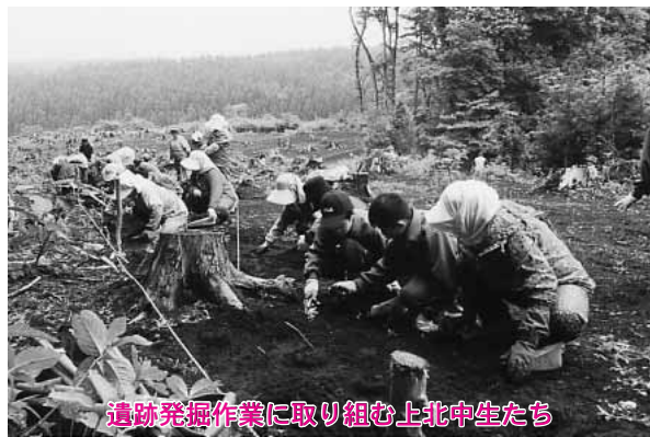
遺跡発掘作業に取り組む上北中生たち