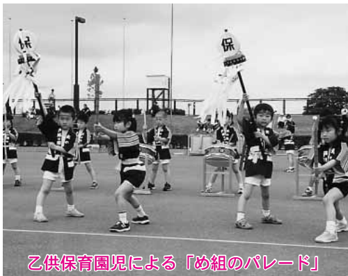
乙供保育園児による「め組のパレード」