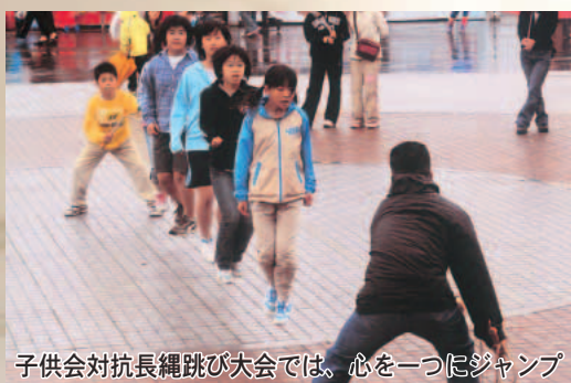
子供会対抗長縄跳び大会では、心をついにジャンプ