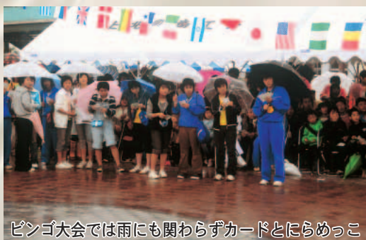
ビンゴ大会では雨にも関わらずカードとにらめっこ