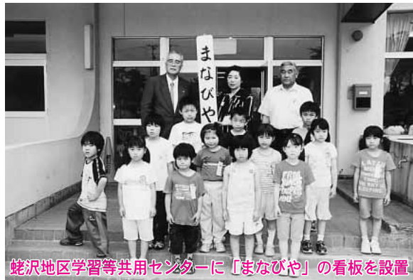
蛭沢地区学習等共用センターに「まなびや」の看板を設置

町では七月三日、町内七か所にある「学童保育クラブ」内に「まなびや」を設置しました。 この「まなびや」は、学童保育と連携し、図書館職員や読書活動ボランティアを週一・二回派遣して、紙芝居や読み聞かせを行うほか、読書や宿題等ができる環境を提供し、自ら学ぶ習慣を身につけるとともに、帰宅後の家庭学習や家族とのコミュニケーションの時間を確保・充実させることをねらいとしています。