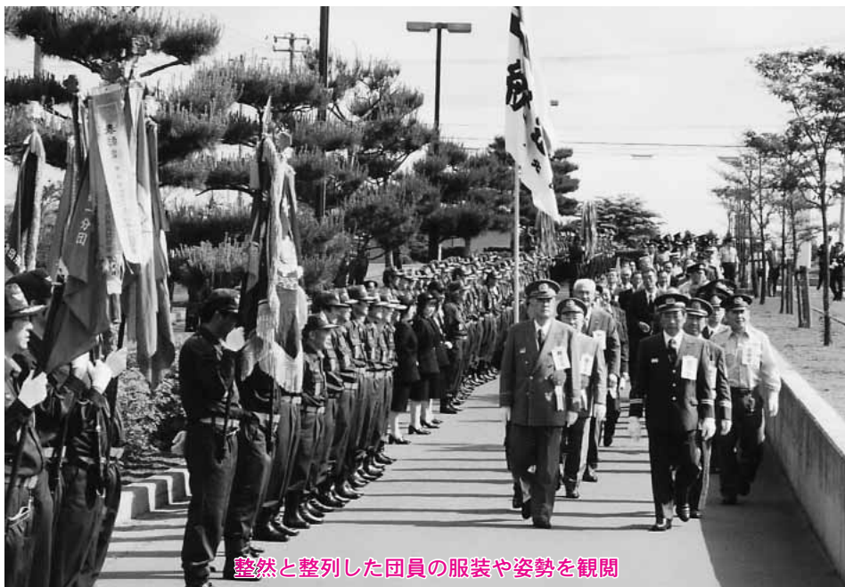
整然と整列した団員の服装や姿勢を観閲