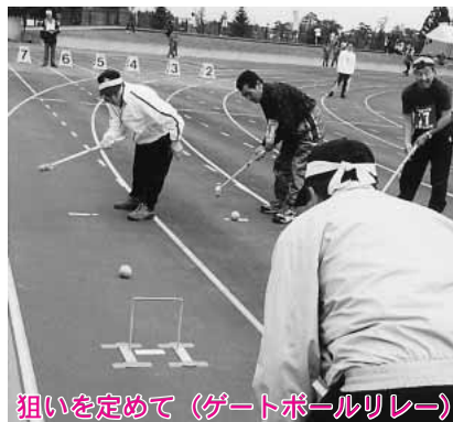
狙いを定めて（ゲートボールリレー）