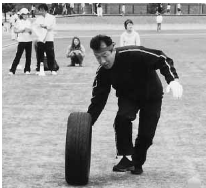
ナイスバランス！（タイヤローリング）