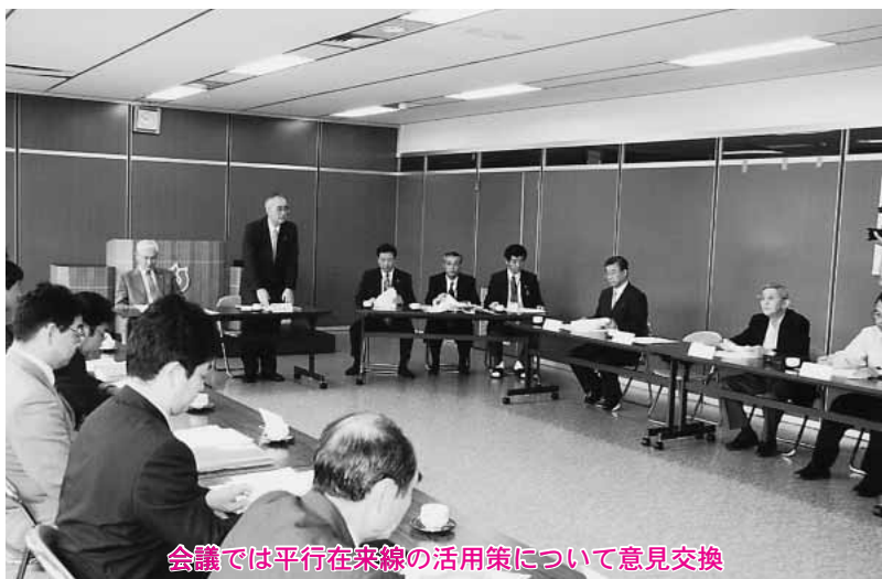
会議では平行在来線の活用策について意見交換

町は七月四日、東北新幹線新青森駅開業でJRから経営分離される平行在来線の有効活用策を話し合う「青い森鉄道活用会議」を設置し、役場本庁舎で初会合を開きました。