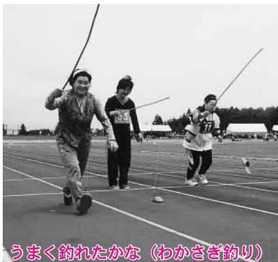
うまく釣れたかな（わかさぎ釣り）