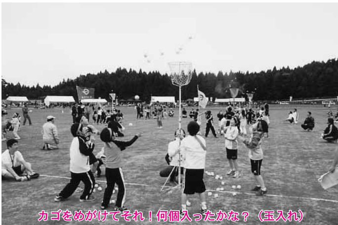
カゴをめがけてそれ！何個入ったかな？（玉入れ）

「いい汗・いい顔・明るい町づくり」を大会スローガンに、第1回東北町民大運動会が7月9日、北総合運動公園陸上競技場で開催されました。