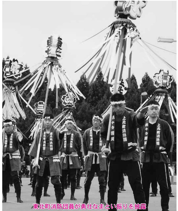
東北町消防団員が勇壮なまとい振りを披露