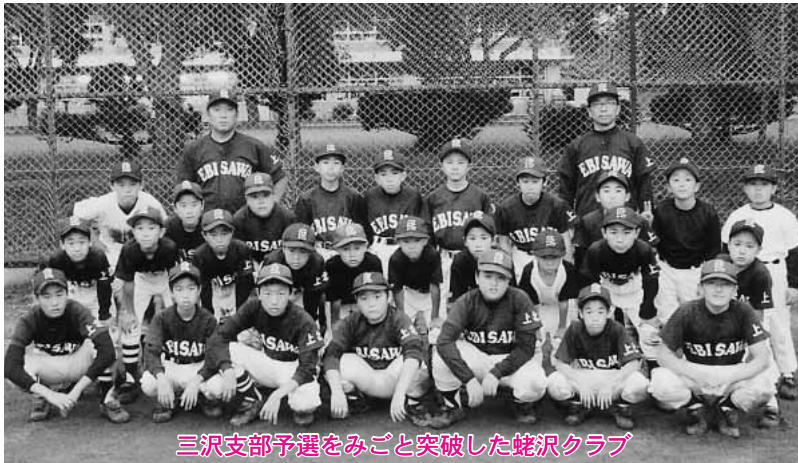
三沢支部予選をみごと突破した蛭沢クラブ