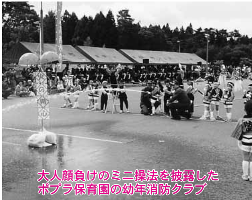
大人顔負けのミニ操法を披露した ポプラ保育園の幼年消防クラブ