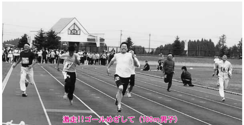
激走!!ゴールめざして（100m男子）