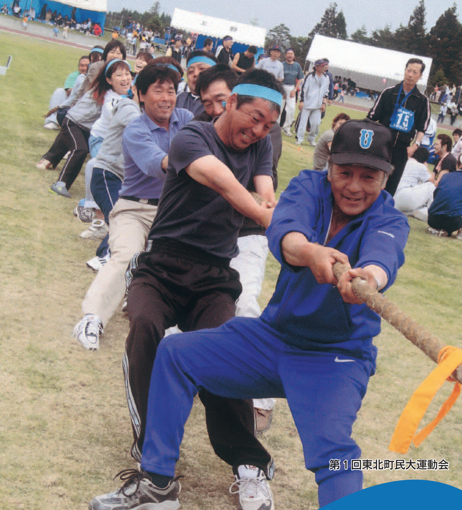
第1回東北町民大運動会