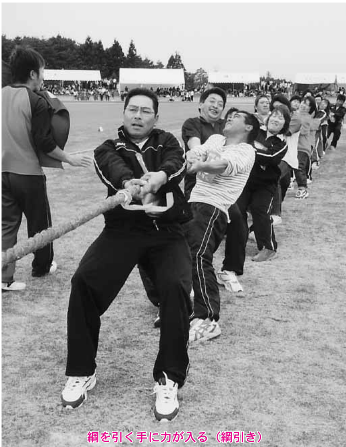
綱を引く手に力が入る（綱引き）