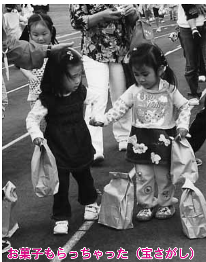
お菓子もらっちゃった（宝さがし）