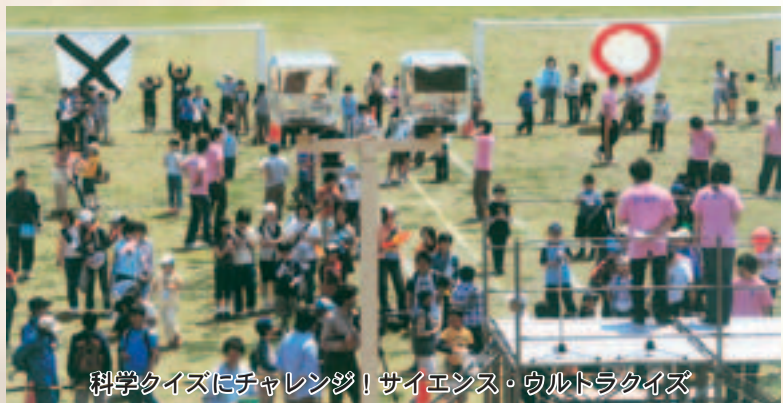
科学クイズにチャレンジ！サイエンス・ウルトラクイズ

(株)青森原燃テクノロジーセンターは5月27日、「サイエンスフェスティバル」を開催しました。