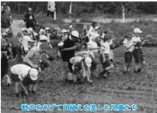
歓声をあげて田植えを楽しむ児童たち

第一小学校（柿崎茂校長）は五月十九日、全校児童七十三人が学校近くの学校田で毎年恒例の田植えを行いました。この田植えは総合的な学習の一環として、毎年五年生が中心となってもち米の田植えや収穫を行っています。児童たちは、地域の方々から苗の植え方を教わりながら、泥だらけになって田植えを楽しんでいました。児童たちは今後、米の成長を観察しながら秋に収穫し、餅つき会を行うことにしています。