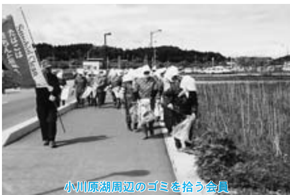
小川原湖周辺のゴミを拾う会員

町たばこ青年部・女性部は六月一日、小川原湖公園付近で会員約百二十人が参加して、クリーンアップ活動を行いました。