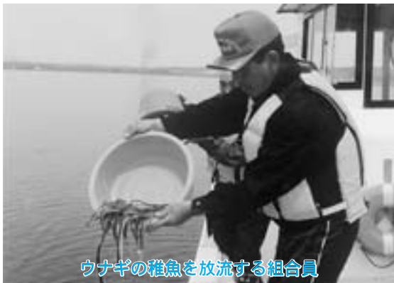
ウナギの稚魚を放流する組合員