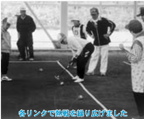
各リンクで熱戦を繰り広げました