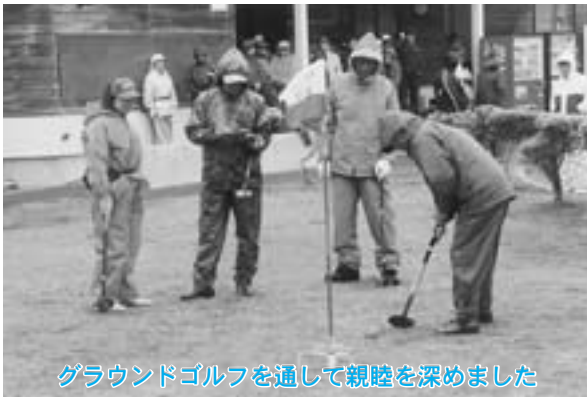
グラウンドゴルフを通して親睦を深めました

競技は、Aブロック(団体・個人戦)とB・Cブロック(個人戦のみ)に分かれて、二十四ホールで行われ、選手の皆さんは日頃の練習の成果を発揮して熱戦を展開。みんな楽しくプレーしていました。