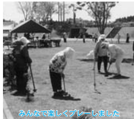
みんな楽しくプレーしました

第一回東北町グラウンドゴルフ大会が五月二十一日、北総合運動公園グラウンドゴルフ場で行われ、約百三十名の選手が参加して行われました。