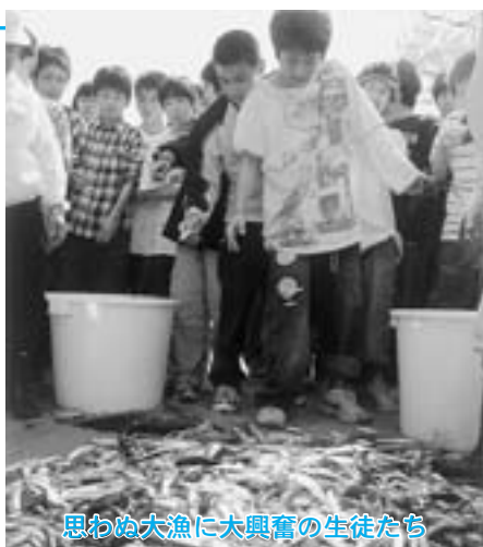
思わぬ大漁に大興奮の生徒たち

漁のあとには、小川原湖産のシジミ汁などが振舞われ、生徒たちは「おいしい」と笑顔を見せていました。