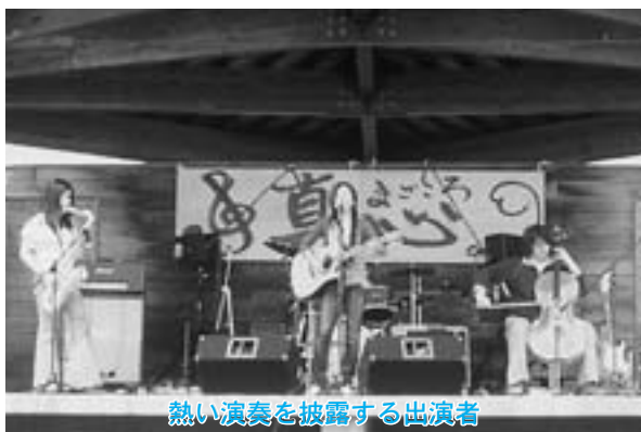
熱い演奏を披露する出演者

客席には、ふれあい村を訪れた親子連れやバンド仲間など約三百人が集まり、出演者の熱い演奏に大きな声援と拍手を送っていました。