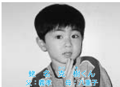
★毎日の仕上げ磨き、特に寝る前にしてます★