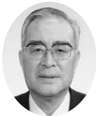
東北町長 竹内 亮一