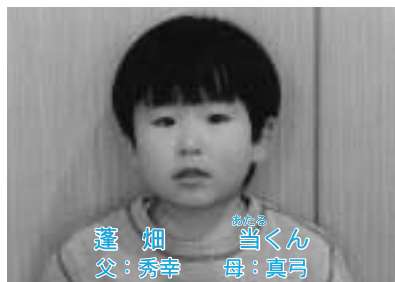
★フッ素入りのハミガキ使ってます★