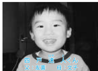
★フッ素入りのハミガキ粉を使って仕上げ磨きしています★