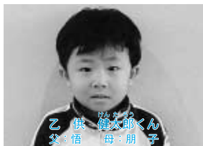
★夜は仕上げ磨きを頑張っています★