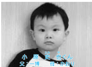
★寝る前に甘い物は控えます★