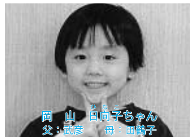
★フッ素塗りました★