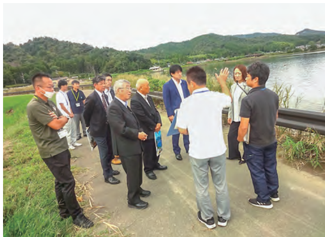
R5.10.4 福井県三方五湖へ視察 (久々子湖)