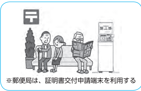
※郵便局は、証明書交付申請端末を利用する

【要望】住民票等は買い物とは違い、必要なときだけとりに行くので、郵便局やコンビニでやっていることを忘れて役場に行ってしまうこともあるので、ここでもこういうことができますよというのが明確に分かるような表示も必要だと思います。