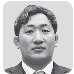
高田 五郎 議員