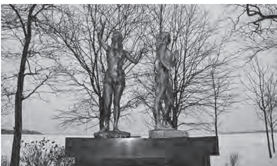
湖畔の玉代勝代姫像

町長答弁 小川原湖への流入河川としては、七戸川、土場川、砂土路川、姉沼川など大小20余りの河川があり、流域は本町を含め県内7市町村に跨る大変大きな流域面積を誇っております。広域に関しては、国、県、流域7市町村、関係団体、有識者等で行く小川原湖流域水環境対策協議会に参加しております。